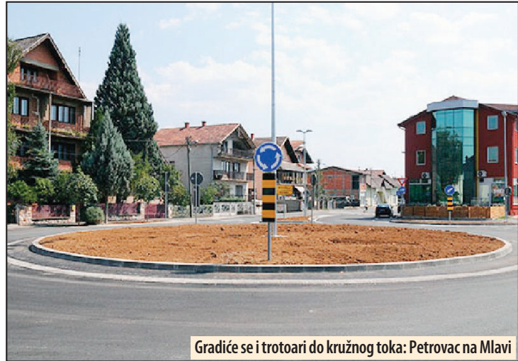
Gradiće se i trotoari do kružnog toka: Petrovac na Mlavi

Učešće Ministarstva je 50 odsto od ukupnog iznosa, odnosno 6.141.467 dinara, dok će ostatak kao i sredstva za uplatu PDV-a obezbediti lokalna samouprava. Ovim projektom glavna saobraćajnica Ulica Srpskih vladara, od marketa „Grin“ do kružnog toka, dobiće trotoare sa obe strane kao i nove zelene površine. Radovi na sprovođenju ovog projekta planirani su na proleće tekuće godine. Z. V.