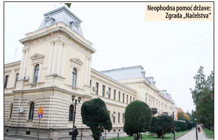
Neophodna pomoć države: Zgrada „Načelstva“

Nacrt plana kapitalnih ulaganja za Požarevac