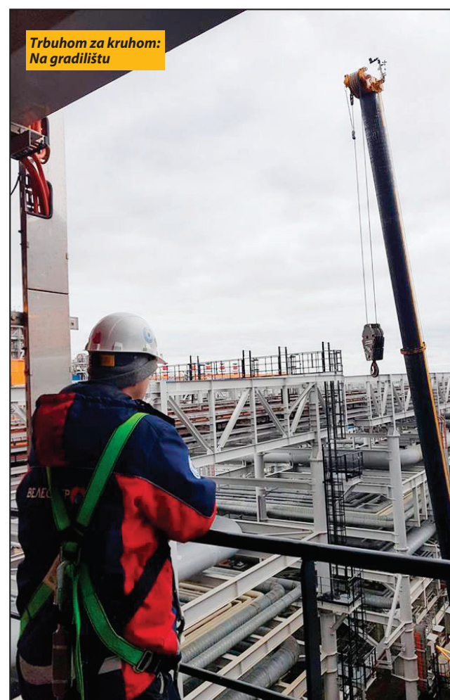
Trbuhom za kruhom: Na gradilištu