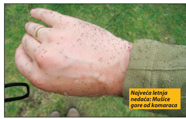
Najveća letnja nedaća: Mušice gore od komaraca

Glavni razlog, pored nemaštine u rodnom kraju, što i pored svega toliki broj ljudi radi u Sibiru je što sve pare koje zarade ostaju. Jednostavno novac nema gde da se potroši, pa tih, u najboljem slučaju par hiljada dolara ostaje čista zarada.