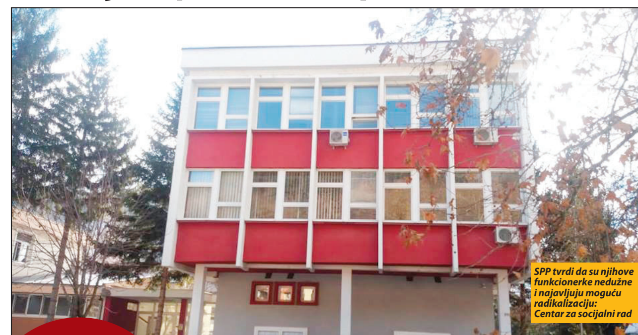
SPP tvrdi da su njihove funkcionerke neuduzne i najavljuju moguću radikalizaciju: Centar za socijalni rad

Sumnja se da je S. H., u svojstvu odgovornog lica Centra za socijalni rad Prijepolje, tokom decembra 2017. godine omogućila pravnim i fizičkim licima da u postupku nabavke pribave imovinsku korist od oko 990.000 dinara, a Centru za socijalni rad nanela štetu od oko 1.142.000 dinara, uključujući i iznos PDV-a. Osumnjičena A.T. koja je takođe poslana u Centru za socijalni rad u Prijepolju, tereti se da je, zloupotrebom službenog položaja, pomogla S.H. da izvrši navedeno krivično delo. Nakon što je osumnjičenim određeno zadržavanje do 48 sati, one su, uz krivičnu prijavu, privedene Posebnom odeljenju za suzbijanje korupcije Višeg javnog tužilaštva