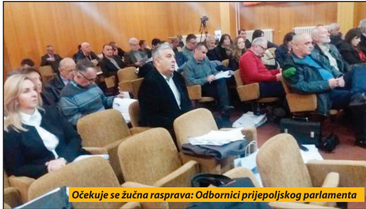
Očekuje se žučna rasprava: Odbornici prijepoljskog parlamenta

Pred odbornicima Skupštine opštine Prijepolje naći će se predlog Statuta opštine kao jedan od najvažnijih dokumenata svake lokalne samouprave.