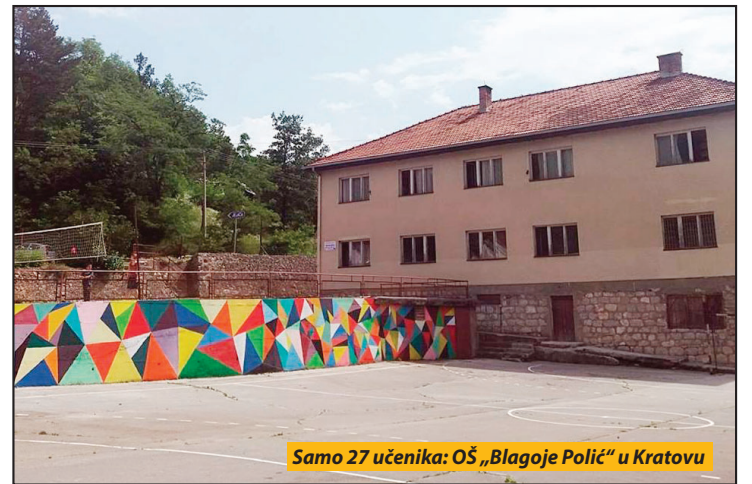
Samo 27 učenika: OŠ „Blagoje Polić“ u Kratovu

- Cilj izrade elaborata za je da bude stručna i informaciona podloga za donošenje Odluke o mreži javnih osnovnih škola u Priboju. U njemu je prikazan pravni osnov za njegovu izradu, navedeni su izvori podataka o opštini Priboj (istorijski, demografski i statistički) koji su u njemu prikazani, kao i način na koji su ti podaci prikupljeni. Takođe, prikazani su podaci o postojećoj mreži ško-