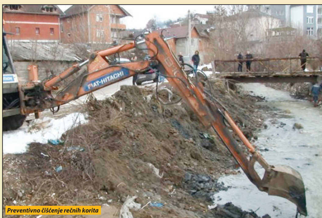
Preventivno čišćenje rečnih korita

Ostalo još, čaršiji da sa sigurne udaljenosti posmatra proteste diljem Srbije. Ne bi niko da šeta (možda asfalt nije njihov ili bi da se radi na dođem ti), al se šetači onako u sebi, podržavaju. Mi smo uz vas, ali nismo sa vama. Što je sigurno, sigurno je. Opet će se, ovde naći neko da, kad sve bude gotovo i delio se kolač, da kaže „Mi rušili režim, a ostatak Srbije nam pomagao“. Nije čaršija stigla da vidi gde je na mapi „Budućnost Srbije“. Od obećanog, ionako, nikad ništa. Čaršija gostu doček i aplauze, on čaršiji obećanja do sledeće kampanje, pardon, viđenja. S. N.