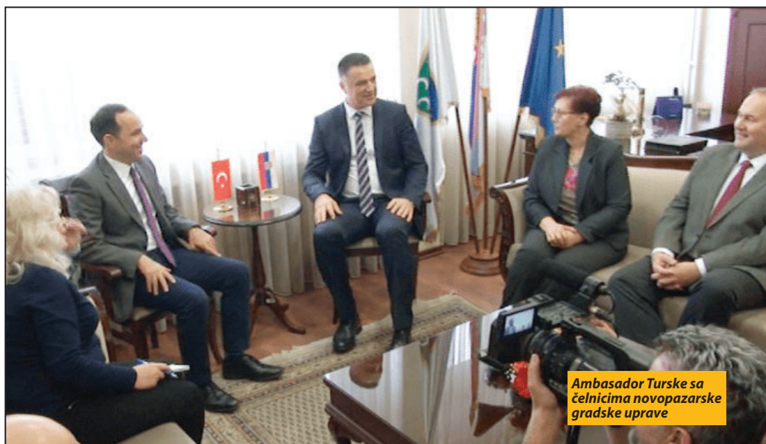
Ambasador Turske sa čelnicima novopazarske gradske uprave