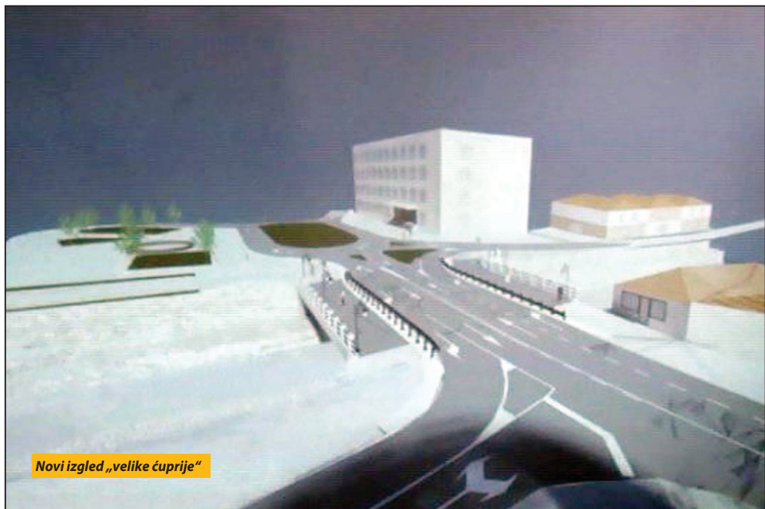
Novi izgled „velike ćuprije“