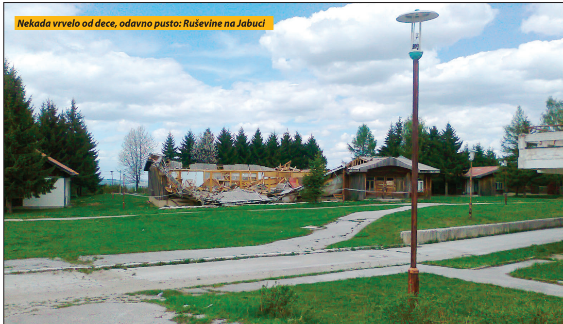
Nekada vrvelo od dece, odavno pusto: Ruševine na Jabuci

Beograd - Nezadovoljstvo javnosti urodilo je plodom, pa su nadležni oduvali od prodaje spornih objekata na Jabuci. Agencija za licenciranje stečajnih upravnika u obaveštenju o prodaji Ugoštiteljsko-turističkog preduzeća „Putnik Prijepolje“ juče objavljeno u dnevnom listu Politika „obaveštava potencijalno zainteresovana lica da se otkazuje prodaja nepokretne i pokretne imovine... grupisane u celinu 2 i celinu 3“. To znači da Muzej pionira i omladine i Spomen-dom „Boško Buha nisu na prodaju. Na prodaju ostaje hotel „Mileševo“. S. D.