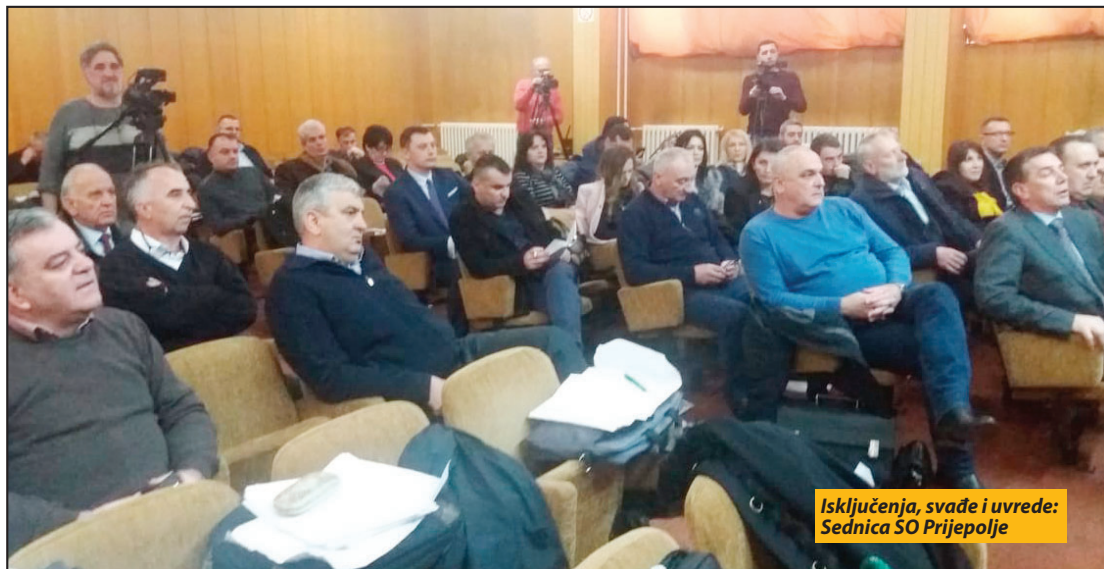
Isključenja, svađe i uvrede: Sednica SO Prijepolje

Tek na kraju je saopšteno da formulisani zaključak opozicije o pokretanju procedure razrešenja i imenovanja direktora Centra za socijalni rad nije valjan, da se o njemu ne može ni izjašnjavati