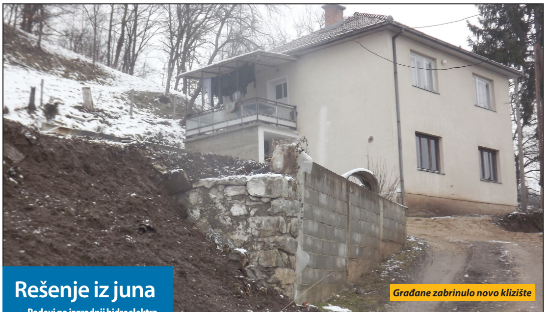
Građane zabrinulo novo klizište