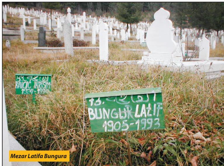
Mezar Latifa Bungura

je Latif Bungur rođen 1905. godine, koji zbog starosti nije mogao da ide sa ostalom grupom.