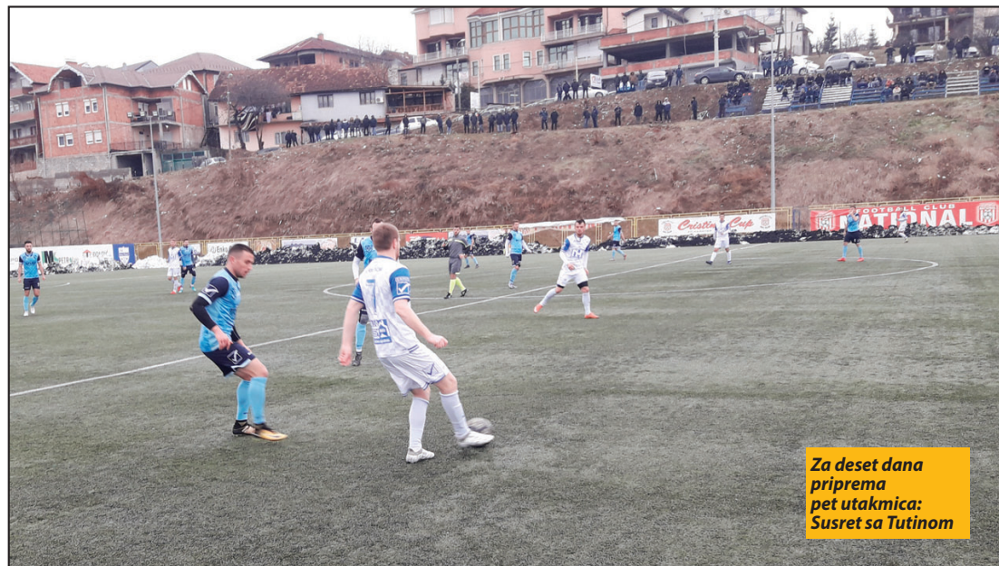
Za deset dana priprema pet utakmica: Susret sa Tutinom