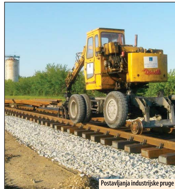
Postavljanje industrijske pruge

Rudarski sistemi su prošli kroz velike i značajne remonte, uz nekoliko kvarova na osnovnoj mehanizaciji. Najvažniji posao je bio na rekonstrukciji ugljenog sistema i novoj trasi izvoza uglja dužine 10 kilometara. Time su stvoreni uslovi za dalje napredovanje kopa i radijalan