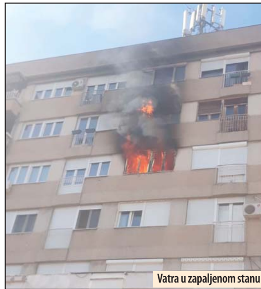
Vatra u zapaljenom stanu

Požarevac - U stanu zgrade koja se nalazi u ulici Radomira Vujovića na broju 12, na četvrtom spratu palate „Morava“ u centru Požarevca, u sredu oko podneva izbio je požar, koji je vrlo brzo zahvatio i stan na petom spratu. Na sreću, stradalih i povređenih nije bilo, samo su se nagutali dima vlasnica Jelena Popović i nekoliko komšija.