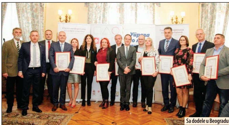
Sa dodele u Beogradu

Nagrade i priznanja dodelili su Ministarstvo državne uprave i lokalne samouprave i SKGO u okviru Projekta „Unapređenje dobrog upravljanja na lokalnom nivou“ koji je deo programa „Podrška Vlade Švajcarske razvoju opština kroz unapređenje dobrog upravljanja i socijalne uključenosti — Swiss PRO“, u realizaciji Kancelarije Ujedinjenih na-