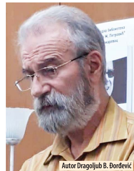
Autor Dragoljub B. Đorđević

Autor je, koristeći tri nivoa pristupa životu i delu Šabana Bajramovića - fascinaciju, razumevanje i prenošenje saznanja, uokvirujući ga u