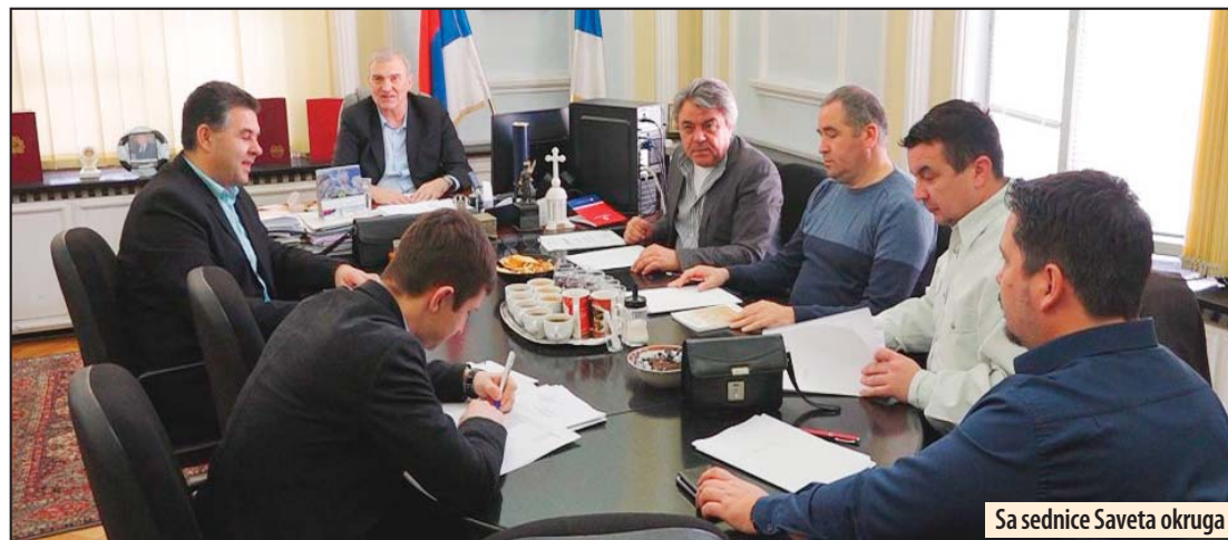
Sa sednice Saveta okruga

Razmatrana je i aktuelna zdravstvena situacija u odnosu na prethodni izveštajni period broj obolelih od gripa se smanjuje i nema epidemije. Takođe, zbog nepovoljne epizootiološke situacije u zemljama u okruženju (Rumunija, Bugarska i Mađarska) preduzimaju se preventivne mere za sprečavanje pojave zarazne bolesti afričke kuge svinja. Jedna od mera odnosi se na lovačka društva, koja su dobila mogućnost izlovljavanja divljih svinja.