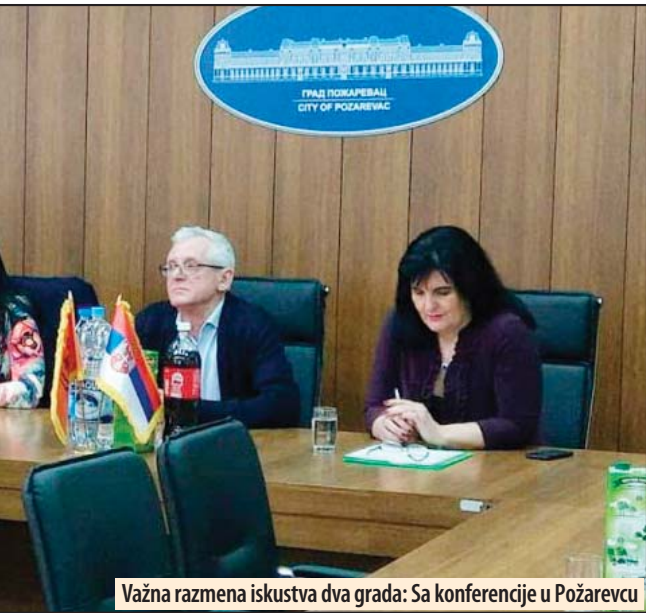
Važna razmena iskustva dva grada: Sa konferencije u Požarevcu