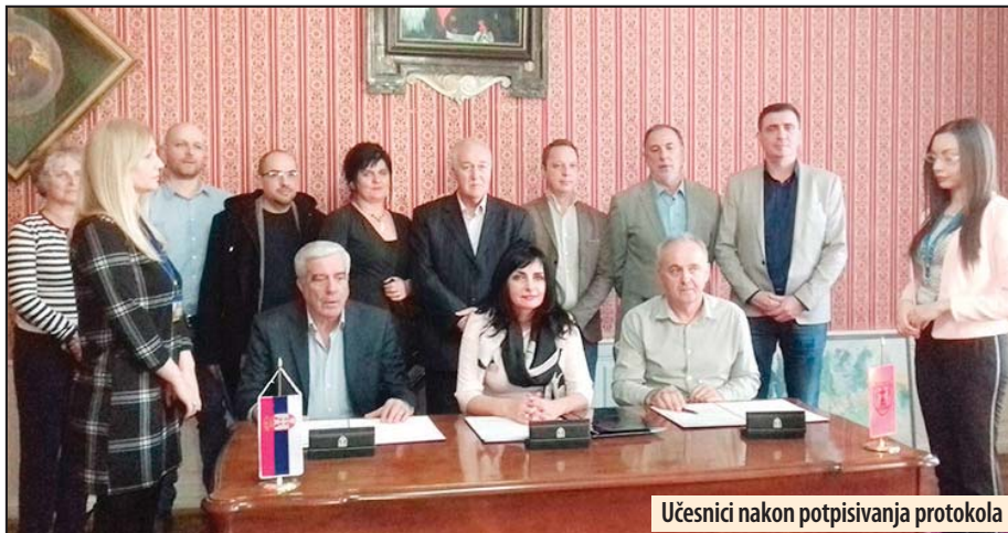
Učesnici nakon potpisivanja protokola

U Požarevcu potpisan protokol o primeni vaspitnih naloga