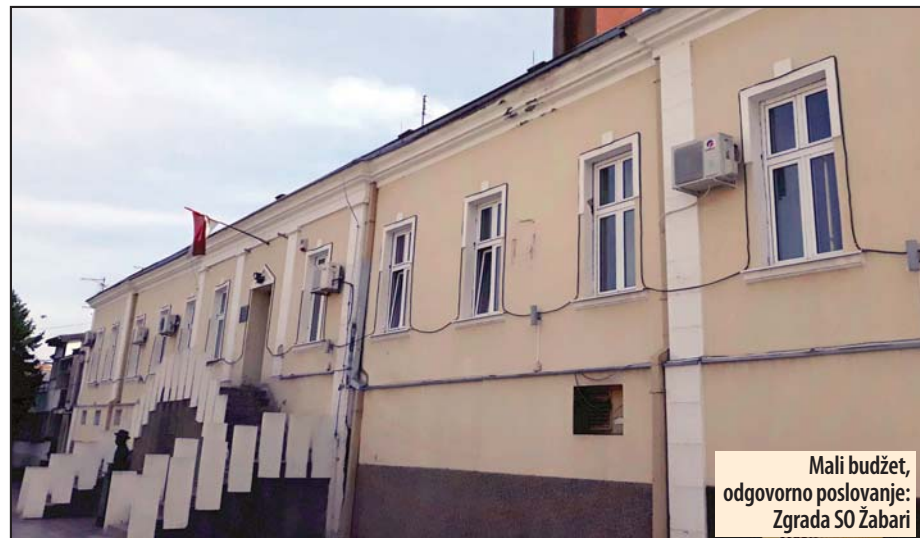
Mali budžet, odgovorno poslovanje: Zgrada SO Žabari