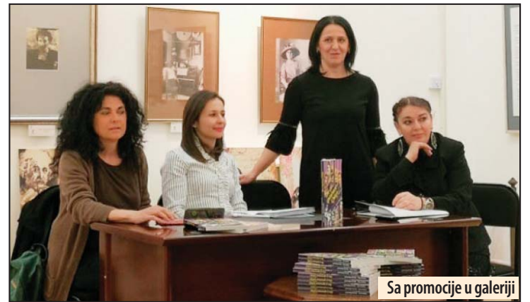
Sa promocije u galeriji

Promocija publikacije „One su promenile Srbiju“