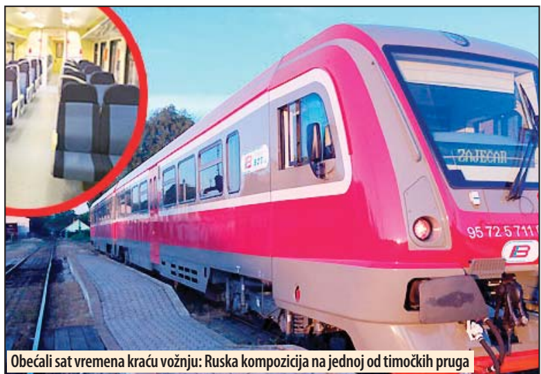
Obećali sat vremena kraću vožnju: Ruska kompozicija na jednoj od timočkih pruga

stom od 90 odsto. Međutim, razdaljinu od oko 90 kilometara između Požarevca i Majdanpeka, vozovi će prelaziti za dva sata i 23 minuta, iako je, dok je trajala obnova koloseka najavljivano da će vožnja na ovom pravcu trajati sat i po vremena, što bi značilo da bi prosečna brzina ostvarena između ova dva mesta iznosila oko 60 kilometara na čas. Sada, sudeći po novom redu vožnje, prosečna brzina između dva mesta će biti oko 37km/h, tako da nije jasno zašto će se putničke kompo-