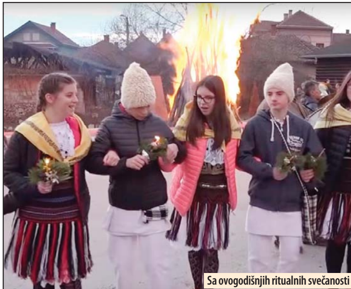
Sa ovogodišnjih ritualnih svečanosti

Pored obreda paljenja vatre i nameñivanja narodnih kola preminulima bez sveća, održan je i bogat kulturno-umetnički program. Kako ova manife-