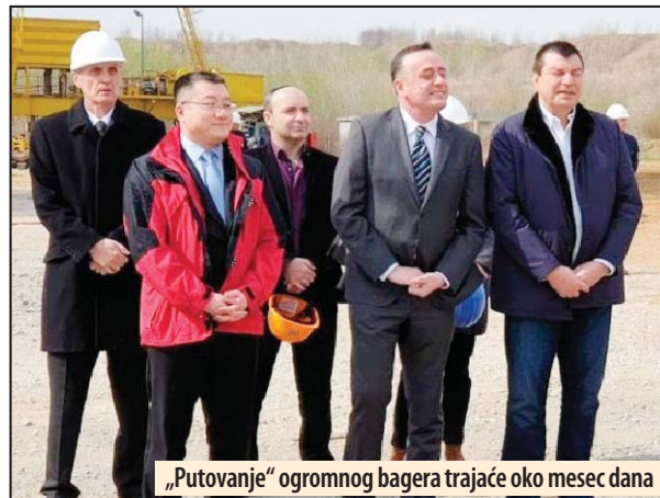
„Putovanje“ ogromnog bagera trajeće oko mesec dana

Montaža rotornog bagera je počela 2016. godine. Vrednost iznosi sto miliona dinara. Nosi-