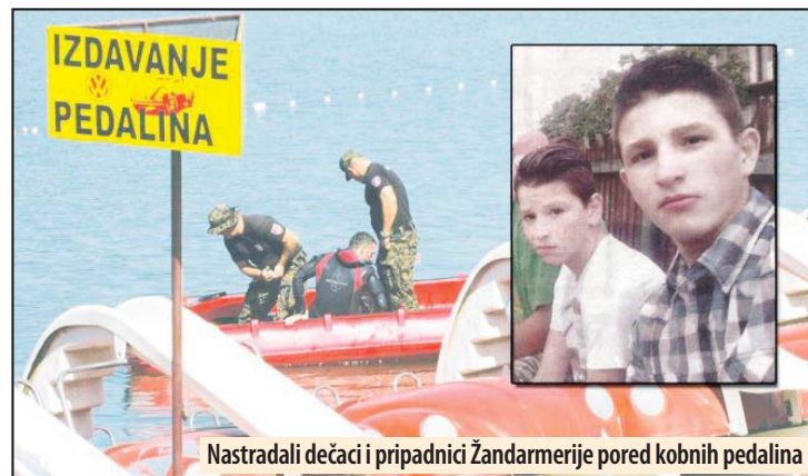
Nastradali dečaci i pripadnici Žandarmerije pored kobnih pedalina

Direktor škole i školski trener bili su optuženi jer nisu vodili računa o bezbednosti osnovaca, koje su kobnog dana doveli na jezero posle fudbalske utakmice u Velikom Gradištu. Supružnici iz Niša optuženi su jer su pedali-