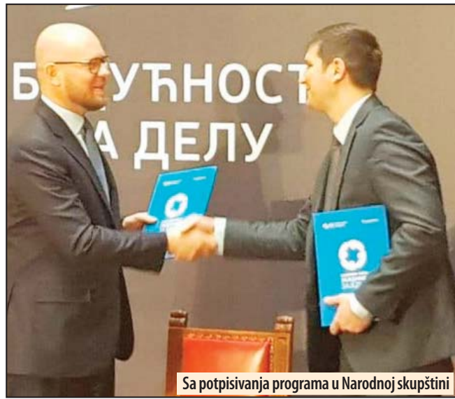
Sa potpisivanja programa u Narodnoj skupštini

Tokom poslednjih 11 godina, kompanija NIS je u društveno odgovorno poslovanje uložila 3,7 milijardi dinara, a samo u rad zdravstvenih ustanova širom Srbije uloženo je gotovo 100 miliona dinara. Ove godine kompanija će uložiti oko milion evra u zdravstvene ustanove u 13 gradova i opština širom Srbije, a sredstva će biti uložena u okviru projekta „Zajednici zajedno“. Z. V.