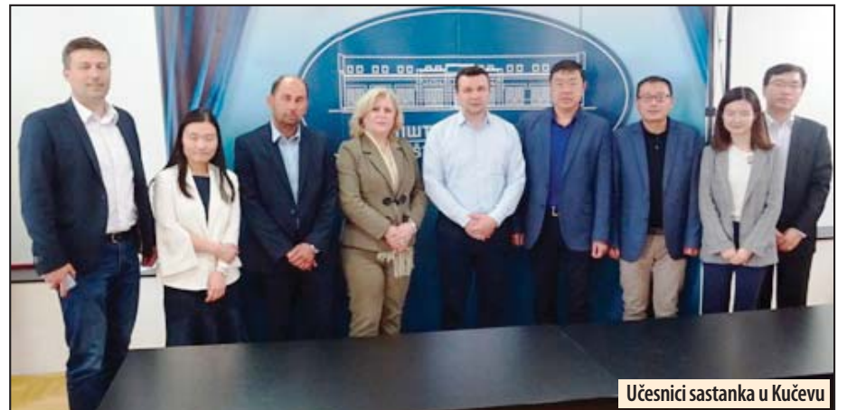
Učesnici sastanka u Kučevu

- Elektroprivreda Srbije se oslanja na dva rudnika, dva površinska kopa Kolubara i Drmno. Površinski kop „Drmno“ je projektovan da proizvede oko devet miliona tona godišnje, a plan je da u narednom periodu proizvodnju podignemo na 12 ili 13 miliona tona, iz prostog razlo-