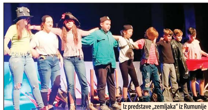
Iz predstave „zemljaka“ iz Rumunije

„Dositejevci“ iz Temišvara obišli su požarevačku školu, osetili njen duh i prisustvovali sjajno osmišljenom i izvedenom kulturno umetnički programu domaćina. Bila je ovo prilika da se gostima lično kao i njihovoj školi uruče prigodni pokloni kojim je dominirao slogan „Dositej Dositeju“. Sa druge strane, mladi Temišvarci upoznali su vršnjake da njihova škola ima oko 200 učenika