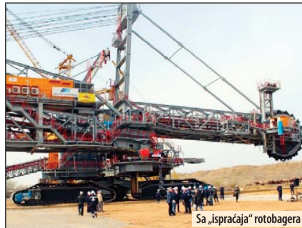
Sa „ispraćaja“ rotobagera

Mašinsku montažu bagera uradila je „Goša montaža“, dok je za elektro montažu bila zadužena firma „Mikrokontrol“ iz Begorada. Opremu za pogonske stanice i radove na mašinskoj montaži uradila je „Goša Fom“ iz Smederevske Palanke, dok je elektro montažu izvela beogradska kompanija „Hidro-Tan“. Podisporučilac CMEC-a za odlagač je firma FLSmidtx, nekadašnji Sandvik. Mašinsku montažu odlagača uradila je firma Ferromont iz Beograda, a elektro montažu firma „Mikrokontrol“ takođe iz Beograda. Projekat za trafostanicu „Rudnik 5“ uradio je Elektroistok Projektni biro Beograd, a radove izvodi Energeotehnika Južna Bačka iz Novog Sada.