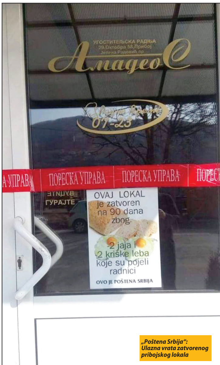
„Poštena Srbija“: Ulazna vrata zatvorenog pribojskog lokala

- Da, dobro ste pročitali zbog dva jaja, koja su u subotu 23. februara pojeli zaposleni za doručak, dovedeno je u pitanje šta ćemo svi mi jesti naredna tri meseca, tokom kojih će restoran biti zatvoren po nalogu poreske inspekcije. Pošto je proverom utvrđeno da su sve porudžbine izdate tog jutra uredno kucane na fiskalnoj kasi, inspektorka, prilično neprijatna i drska, utvrdila je da smo ipak oštetili budžet Republike Srbije za dva jaja koja je pojeo konobar, a za koja nije imao fiskalni račun uz direktnu pretnju: „Proći ćete gore nego da ste ubili čoveka“. I prošli smo izgleda, pošto se u ovoj zemlji takvima i ne sudi nego se koplja lome o leđa građana koji pokušavaju da žive život dostojan čoveka. Kao student četvrte godine farmacije, koji do sada nije razmatrao opciju odlaska u inostranstvo nakon završetka studija, uviđam da sam 23 godine živela u iluziji da se u Srbiji može živeti od svog rada, a da ti tata pri tom nije obezbedio posao, kad je pro-