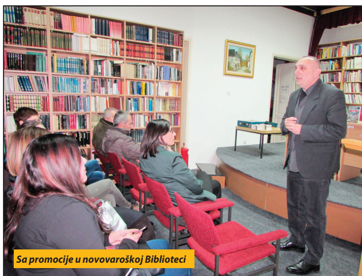
Sa promocije u novovaroškoj Biblioteci

- Iako mogu da posluže kao sjajna zabava, crtice u knjizi mnogo govore o nama samima. Štivo tera na razmišljanje i o tome kakav smo narod, koliko toga ne znamo, a važno je za našu istoriju i nacionalni identitet. Tako će čitaoci u knjizi moći, između ostalog, i da saznaju ko je i zašto „zaboravio“ da devet godina sahrani vojvodu Putnika, ili zašto crkva slavi i obeležava Milanski edikt a namerno gura pod tepih činjenicu da je prvi edikt o verskoj toleranciji potpisan dve godine ranije baš u Srbiji. U knjizi je i priča o prvom papi Srbini, kao i saznanje da je jedan Srbin bio na čelu i Vaseljenske patrijaršije, kao i ona da je čuveni Franc List prvi koncert održao u Ečkoj u Vojvodini - kazao je pred brojnim ljubiteljima pisa-