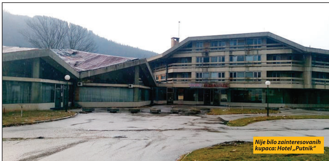
Nije bilo zainteresovanih kupaca: Hotel „Putnik“

Nije uspela prva prodaja „Putnika“ Prijepolje