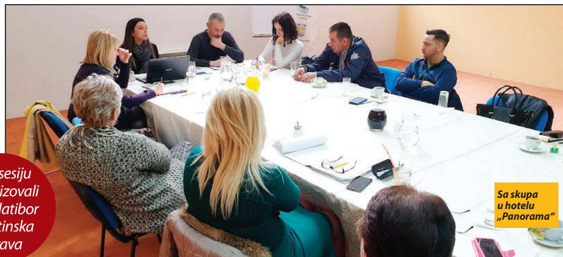
Info-sesiju organizovali RRA Zlatibor i Opštinska uprava

Na skupu u hotelu „Panorama“ okupilo se dvadesetak lokalnih privrednika - vlasnika i predstavnika mikro, malih i srednjih preduzeća, a najviše interesovanja na sastanku ispoljili su vlasnici iz oblasti prehrambene industrije. Reč je uglavnom o novoregistrovanim preduzetnicima koji su se orijentisali na proizvodnju i preradu mleka i sira. Nešto iskusnija u preduzetničkim vodama je i Stojanka Paunović iz firme „Viskon“ za koju su, kako kaže,