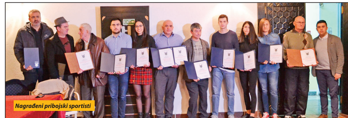
Nagrađeni pribojski sportisti