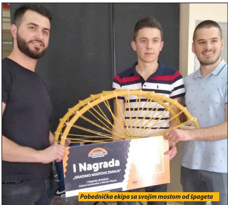
Pobednička ekipa sa svojim mostom od špageta

problem predstavljaju gomile koje se odlazu pored kontejnera. Sa druge strane, građani imaju puno primedaba na održavanje javne higijene, na odnošenje smeća iz domaćinstava i pražnjenja „prebukiranih“ kontejnera. Onima koji se brinu o javnoj higijeni saveznik nisu ni uske ulice zakrčene parkiranim automobilima sa obe strane, niti deponija smeća koja je od grada udaljena 23 kilometra. Uređenje rečnih korita tek treba da počne. Te plivajuće deponije, redovno se čiste bagerima i proširuju korita, ali se sve brzo vraća na početak. S. N.