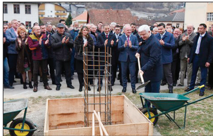
Vrijednost projekta 5,4 miliona evra: Premijer Marković polaže kamen temeljac

- Prije dvije nedjelje smo potpisali Ugovor o izgradnji ovog objekta, danas obilježavamo početak radova polaganjem kamena - temeljca. Želim da izrazim zadovoljstvo što će ovaj objekat biti jedan od najljepših i najboljih u Crnoj Gori koji će obezbijediti potpune uslove i najveće standarde za preko 1200 učenika koji će pohađati ovu školu ali i za zaposlene u školi. Škola će imati više od 20 namjenskih učionica, preko 6 specijalizovanih kabineta, zajedničke prostorije za vannastavne aktivnosti, a škola će imati fuskulturnu salu. Vrijednost investicije je preko 5 miliona eura. Danas svedočimo još jednoj činjenici da ono što obećamo to i uradimo. Učenici će za 26