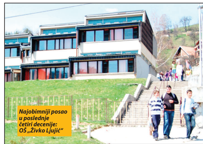
Najobimniji posao u poslednje četiri decenije: OŠ „Živko Ljujić“

Prva faza radova podrazumeva kompletnu sanaciju obe školske zgrade i fiskulturne sale, a druga izgradnju kotlarnice na bio-masu