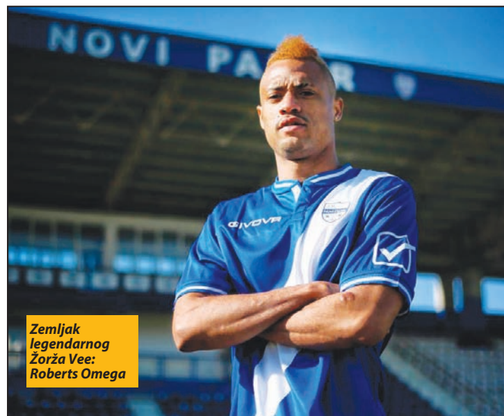
Zemljak legendarnog Žorža Vee: Roberts Omega

pio i za najbolji nacionalni tim ove zemlje. U Moldaviji je branio boje Tiraspolja i najboljeg tamošnjeg kluba Šerifa. Često se nalazio u sastavima ova