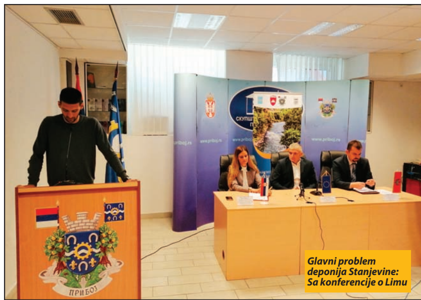
Glavni problem deponija Stanjevine: Sa konferencije o Limu