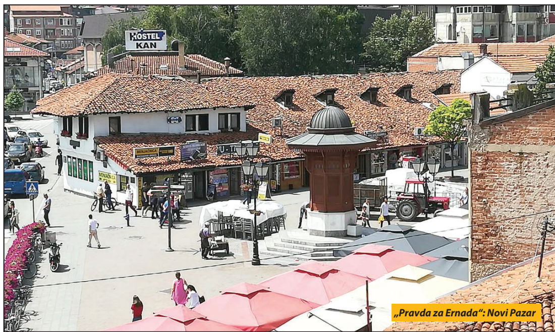
„Pravda za Ernada“: Novi Pazar