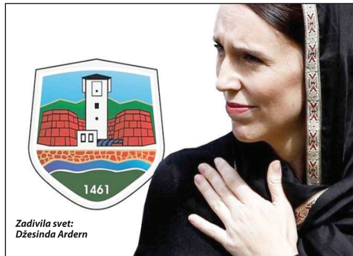
Zadivila svet: Džesinda Arden

Novopazarski gradonačelnik Nihat Biševac uputio je pismo premijerki Arden, u kojem je obavestava o dodeli priznanja. U pismu je još naveo da u ovom gradu „zajedno žive muslimani i hrišćani i mi vrlo dobro znamo šta sve može da donese mržnja na rasnoj, etničkoj ili verskoj osnovi. Nakon sukoba, koji su devedesetih godina zahvatili bivšu Jugoslaviju, ulažemo puno napora da od Novog Pazara izgradimo stabilnu multietničku sredinu u kojoj se ljudi neće deliti po naciji ili veri, već zajedno graditi zajednicu u koju su svi dobrodošli. Zadivljeni smo Vašom i reakcijom celokupne javnosti Novog Zelanda, kada ste u tim teškim trenucima pokazali da su poštovanje različitosti i zajedništvo najveće tekovine moderne civilizacije. Vašim primerom inspirisali ste milione širom planete da budu bolji. Pokazali ste da su ljubav i saosećajnost vrednosti za koje se treba boriti, da je snaga