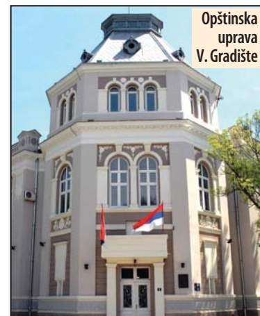
Opštinska uprava V. Gradište