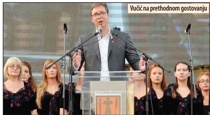
Vučić na prethodnom gostovanju

okviru aktuelne kampanje, za saobraćaj će biti zatvorene pojedine ulice. U petak, 5. aprila, počev od 19 časova, ulica Tabacka čaršija, kružni tok i Lenjinova ulica do nedelje, 07. aprila u 1 sat posle ponoći. U subotu, 6. aprila,