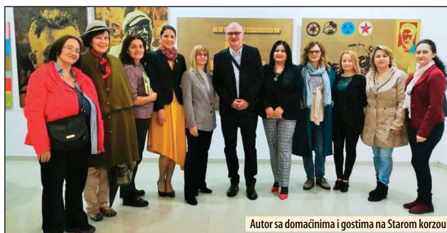
Autor sa domaćinima i gostima na Starom korzou

ka... Osim umetnosti, žanr odlikuje i društvena angažovanost, te svojevrsna pank ideologija koja se bazira na ideji protivljenja svakom ranije definisanom i nametnutom centru moći. Pank je u biti bunt,