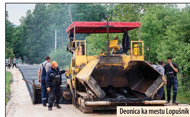
Deonica ka mestu Lopušnik

- Ovu priliku bih iskoristio da građanima Lopušnika najavim početak asfaltiranja puta