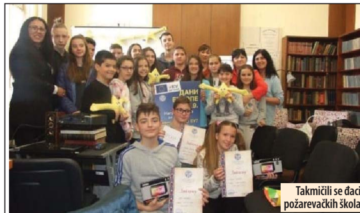
Takmičili se đaci poževevačkih škola

državnim institucijama, kulturnim ustanovama, organizacijama civilnog društva, institucijama i pojedincima.