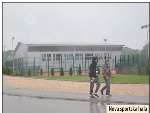
Nova sportska hala

košarkaški kamp „Teo 4“ kroz koji je prošlo 1.000 dece uz 20.000 pansionerskih dana, ističe Milić i podseća da se sada asfaltira put Ram - Topolovnik, koji je od velikog značaja za projekte razvoja i takođe imaju podršku vrha države. Od turizma živi oko 400 ljudi, a biće ih još, jer se godišnje ostvari 120.000 noćenja, a kroz grad prođe 600.000 do 700.000 gostiju.