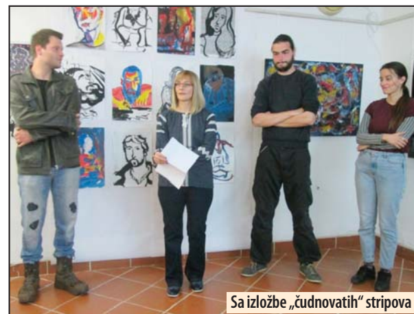
Sa izložbe „čudnovatih“ stripova

- Ona voli umetnost i životinje i ima životnu radost. Zbog toga i pravi sve te divne uloge koje svi obožavamo, kazala je Dragičević. Svetozar Cvetković je u čast svoje koleginice otpjevao pesmu „Smile“ (osmeh) Net King Kola i kazao da je ona velika divna tajna, a Jelica Sretenović da je san svake srpske glumice da dobije nagradu „Žanka Stokić“, koja je simbol profesije. Z. V.