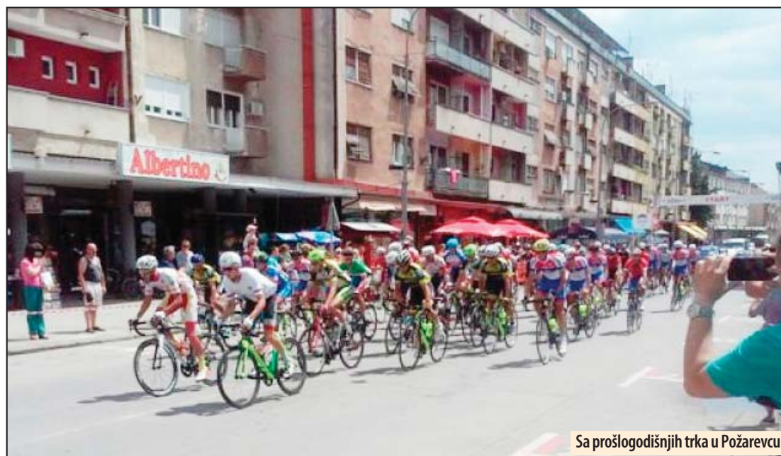
Sa prošlogodišnjih trka u Požarevcu

Požarevac - Grad Požarevac će biti domaćin završnice ovogodišnje, 59. po redu, biciklističke Trke kroz Srbiju pošto će svečani ulazak takmičara u cilj, a time i određivanje konačnog plasmana ekipa i pojedinaca, biti održan 2. avgusta u Požarevcu.