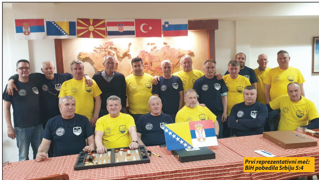
Prvi reprezentativni meč: BiH pobedila Srbiju 5:4

Nije mnogo medijski raširena, ali je atraktivna. Kad se s njom prvi put susretnete rekli biste, zato što se u njoj kao rekvizit koristi kockica da je faktor sreće dominantan, a nije, iako se ne može u potpunosti zanemariti. Strategija, taktika, analiziranje pozicije, snalaženje kod protivnikovih kontraudara, sve to zastupljeno je u tavli i čini je misaonom igrom koja se velikom brzinom primila na prostoru Bosne i Hercegovine i Makedonije, u poslednje