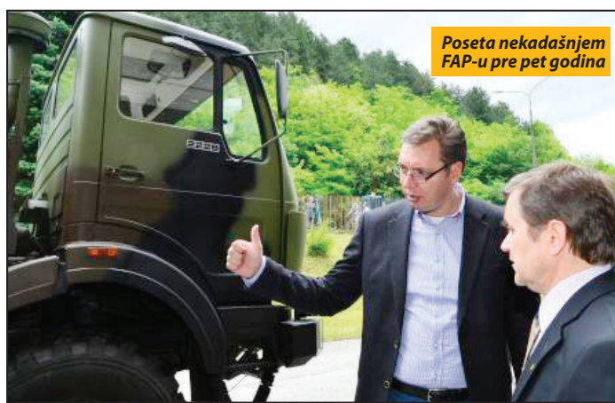
Poseta nekadašnjem FAP-u pre pet godina

On je ovo izjavio u okviru poziva građanima da dođu na vojnu paradu, koja se danas održava u Nišu. Vojna parada u Nišu organizuje se 10. maja, povodom Dana pobe, a Vučić je pozivajući Nišlije i ostale građane da prisustvuju paradi još dodao da će to biti prilika da prvi put vide neke stvari u arsenalu srpskog oružja i to koliko je srpska vojska napredovala i koliko je snažnija. „Ono što će posebno