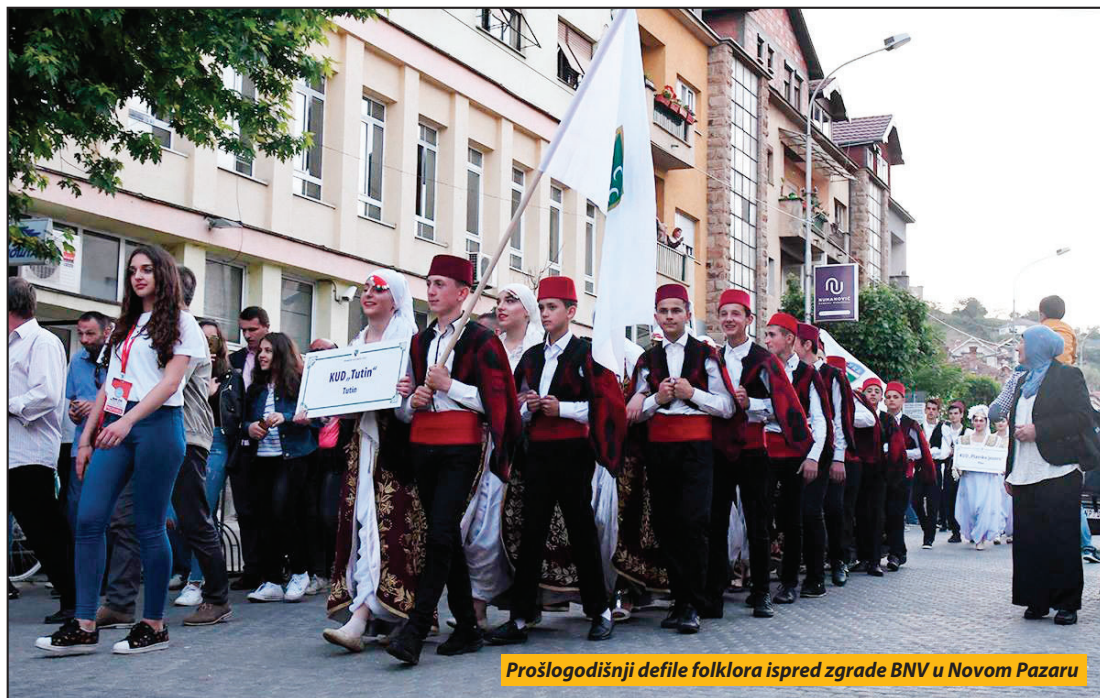
Prošlogodišnji defile folkloru ispred zgrade BNV u Novom Pazaru