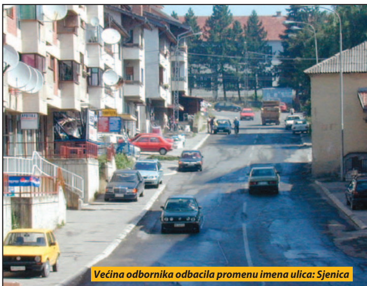
Većina odbornika odbacila promenu imena ulica: Sjenica

Skidanje sa dnevnog reda ovih inicijativa, sasvim sigurno, u pitanje je dovelo dalje poštovanje Sporazuma o strateškoj saradnji između SDA i SDP,