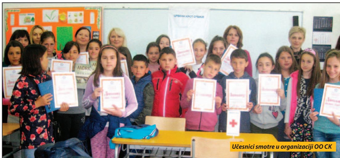
Učesnici smotre u organizaciji OO CK

Opštinsko takmičenje osnovaca „Šta znaš o Crvenom krstu“