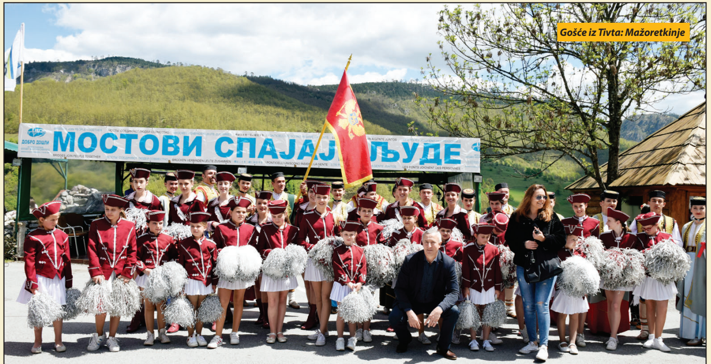
Gošće iz Tivta: Mažoretkinje

Pljevlja - Lijep majski vikend 11. maja i prelijep ambijent na mostu na Đurđevića Tari, doprinio je da jedanaesta po redu manifestacija „Mostovi spajaju ljude“ privuče veliki broj posjetilaca iz Pljevlja i okruženja. Organizatori tradicionalne manifestacije su NVO Tara, TO Pljevlja, opštine Pljevlja i Žabljak uz podršku Ministarstva održivog razvoja i turizma, Nacionalna turistička organizacija Crne Gore i Vlade Crne Gore.