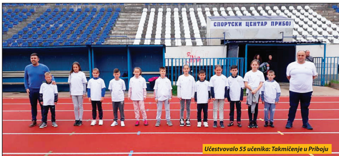
Učestvovalo 55 učenika: Takmičenje u Priboju

Priboj - U Priboju je u okviru regionalne sportske manifestacije Sportske igre mladih, održano takmičenje u atletici. Atletski miting u disciplini trka na 60 metara za decu uzrasta od šest do 10 godina, koji predstavlja kvalifikacije za državno prvenstvo, održan je