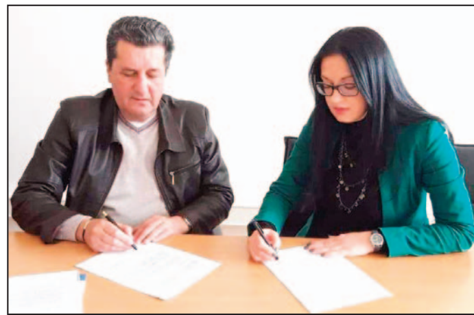
Sa potpisivanja ugovora u prostorijama CSR

- Programom će biti obuhvaćeno 50 prvaka. Pravo na besplatan boravak na moru umaju deca samohranih roditelja, mališani iz porodica koje se nalaze na evidenciji Centra za socijalni rad, kao i onih materijalno ugroženih čiji mališani dosada nisu bili na moru. Ukoliko ostane slobodnih mesta, priliku da uživaju na crnogorskom primorju imaće i deca čiji su jedan odnosno oba roditelja zaposleni,