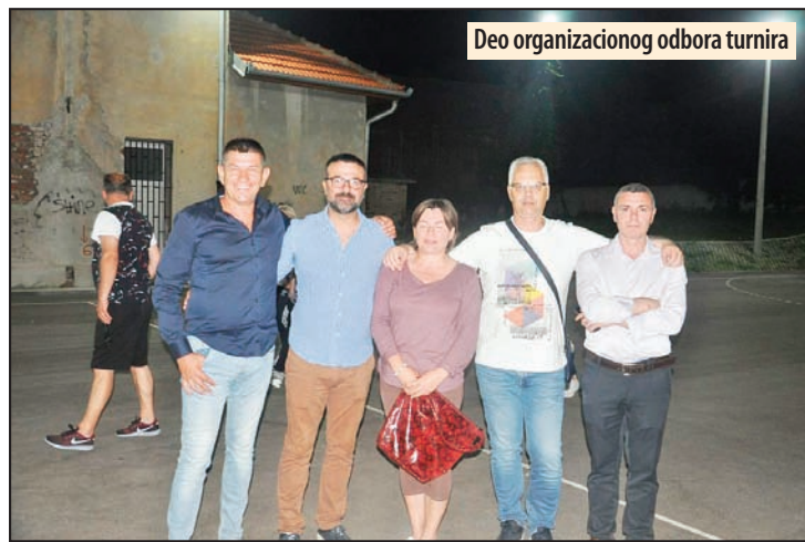
Deo organizacionog odbora turnira

pošto su fudbaleri iz „Bugarin petrola“ potpuno pali psihološki nakon primljenog gola u poslednjem minutu, promašivši oba penala koja su šutirali,