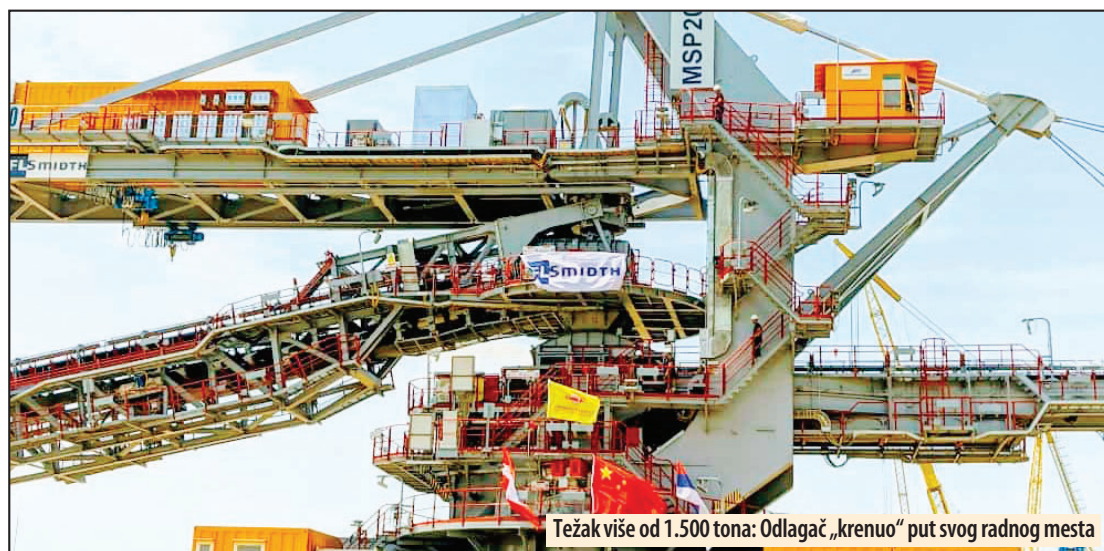
Težak više od 1.500 tona: Odlagač „krenuo“ put svog radnog mesta

d. direktora „Elektroprivrede Srbije“ je naglasio da je ovo važan i veliki dan za EPS, za rudarski sektor posebno, i podvukao da se poslednjih nekoliko godina značajno i intenzivnije ulaže u rudarski sektor.