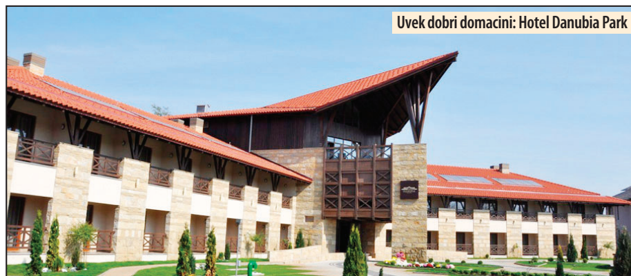
Uvek dobri domaćini: Hotel Danubia Park

Info sesija „EU PRO“ za podršku u poslovanju