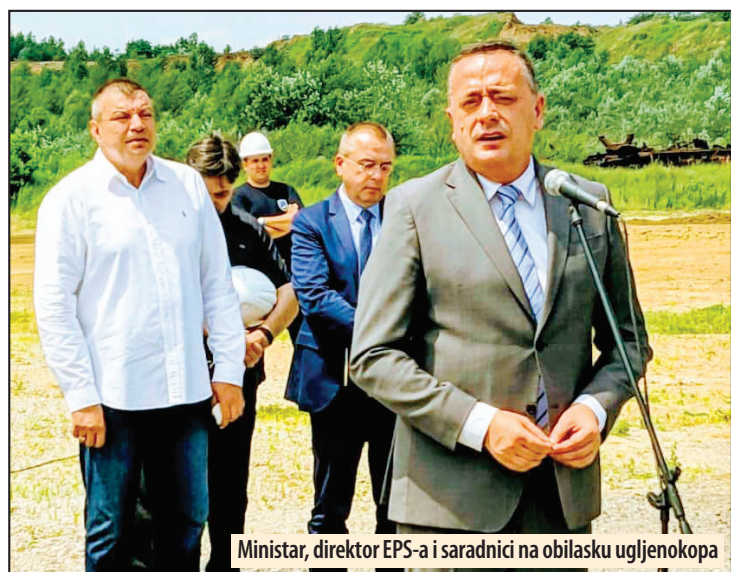
Ministar, direktor EPS-a i saradnici na obilasku ugljenokopa

bari planiramo nabavku dva kompletno nova sistema. Najvažnija tačka u proizvodnji električne energije u EPS-u je uglaj. Zato uglju dajemo prednost. Ru-