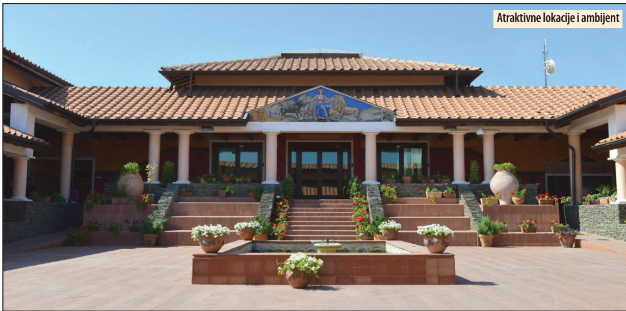
Atraktivne lokacije i ambijent