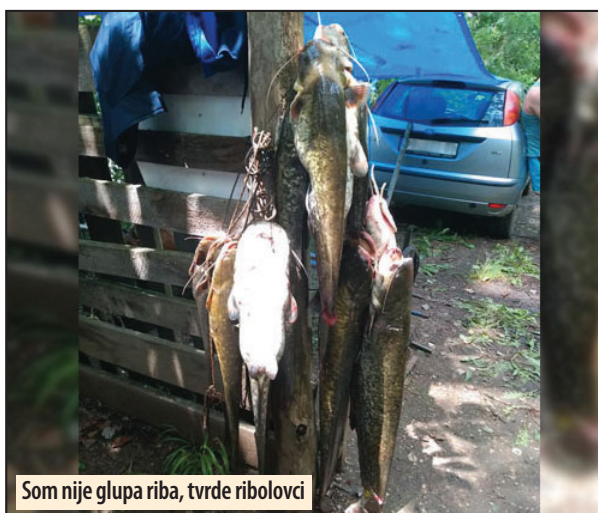
Som nije glupa riba, tvrde ribolovci