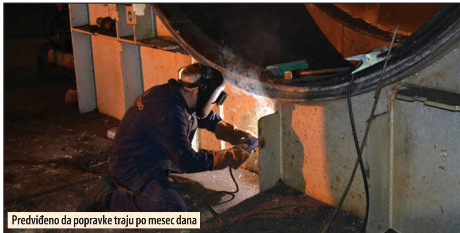
Predviđeno da popravke traju po mesec dana

Ono što prethodi realizaciji bilo kog remonta u termoelektranama jeste planiranje, a ono podrazumeva da svaki zahvat