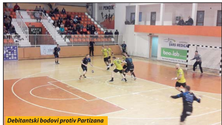
Debitantski bodovi protiv Partizana