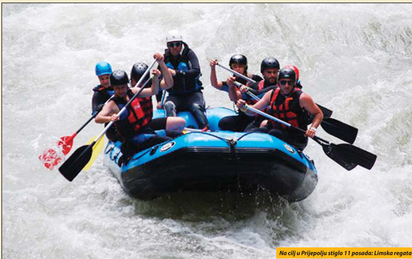
Na cilj u Prijepolju stiglo 11 posada: Limska regata

Prijepolje - Nakon svečanog otvaranja 20. jubilarne Limske regate, koje je prošlog vikenda organizovano u Plavu, niz bukove Lima krenulo je 15 posada. Na plažu Petrovac, u Prijepolju, gde je za učesnike regate organizovan doček, stiglo je 11 posada.