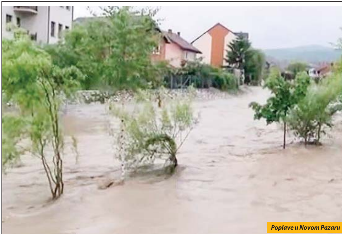
Poplave u Novom Pazaru