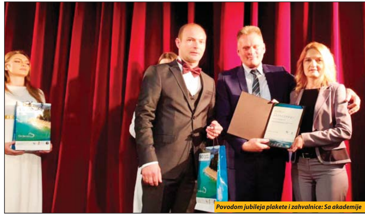
Povodom jubileja plakete i zahvalnice: Sa akademije

Obeležena 90-godišnjica organizovanog turizma u novovaroškom kraju