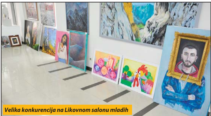
Velika konkurencija na Likovnom salonu mladih

Novi Pazar - Nijedan konkurs u Novom Pazaru nije probudio toliku radoznalost, kao onaj tek završeni u Domu zdravlja. Ova zdravstvena ustanova, posle dugo vremena, raspisala je konkurs za prijem u stalni radni odnos jednog stomatologa. I ne bi ništa bilo čudno da za jedno mesto nije konkurisalo njih 19. Rezultati će biti poznati za nekoliko dana, a direktor Doma zdravlja dr Ervin Čorović poručuje da će sve biti transparentno i po zakonu. Glavni kriterijum je prosečna ocena studiranja, a učesnici konkursa će moći da vide dokumenta drugih kandidata. Na evidenciji Filijale Nacionalne službe zapošljavanja u ovom gradu ima više od 18 hiljada nezaposlenih, a među njima je i 26 stomatologa. S. N.