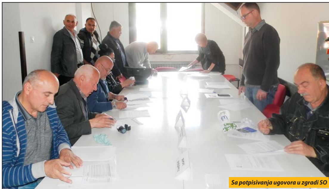
Sa potpisivanja ugovora u zgradi SO

Pare iz opštinske kase za udruženja „Kozomor“, „Zlatni breg“, „Uvačka reka mleka“, „Zlatarka“, „Stari zanati za novo doba“, „Stara Raška“, „Kitonja“, kinološko i eko društvo i strelce protivgradne zaštite