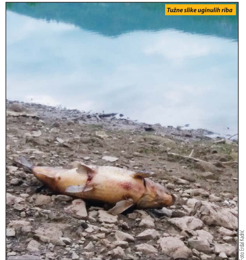
Tužne slike uginulih riba