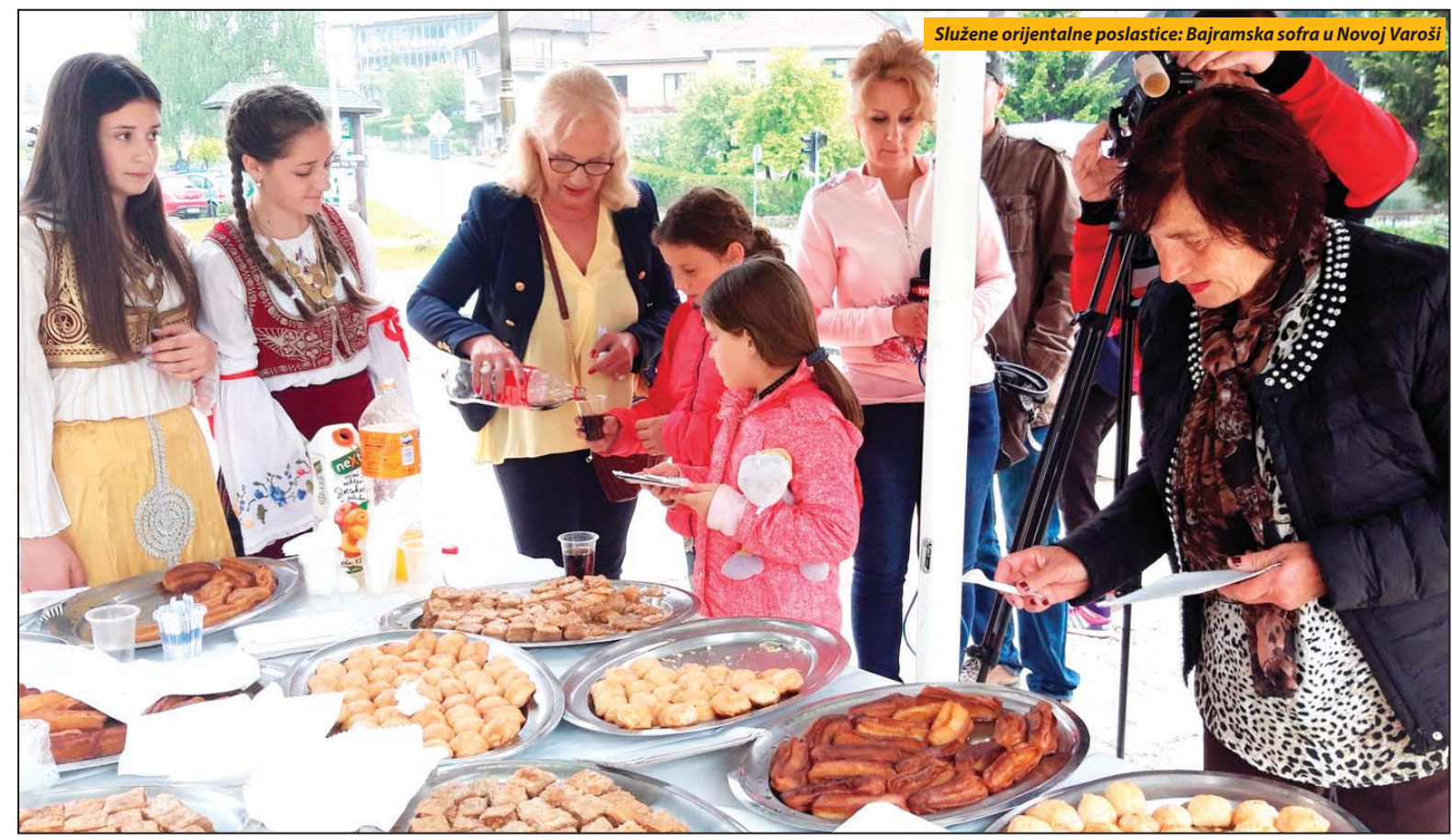
Služene orijentalne poslastice: Bajramska sofru u Novoj Varoši

Muslimanskim vernicima bajramsku poruku, iz beogradske Bajrakli džamije, uputio je vrhovni poglavar IZ Srbije reisu-l-ulema Sead Nasufović, koji je pozvao vernike da rašire svoja prsa i rašire svoja srca za prijem božanskih darova. „Ako to već od sada nismo uradili, iskoristimo poslednje trenutke Ramazana i sakupimo snagu oprosta prema onima koji su nam zlo naneli ili nas na bilo koji način uvredili. Zato na sutrašnji dan proširimo svoje ruke za bratski zagrljaj pre-