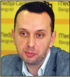
Piše: Teo Taraniš

Đe smo mi, a đe je Evropa - rečenica koja se u narodu često koristi sa namerom da ukaže na raskorak između stanja u nas i onoga što smatramo „standardima i dostignućima razvijenih evropskih demokratija“, možda ponajbolje ilustruje aktuelni trenutak evropskih integracija Republike Srbije. Prevedena u političku ravan, ova rečenica potvrđuje da postoji ozbiljan „raskorak“ nalazi u najnovijem izveštaju Evropske komisije za Srbiju koji upozorava da reforme ne idu u dobrom pravcu ili se dešavaju vrlo sporo. Čitanje pomenutog izveštaja izazvalo je različite reakcije. Predsednicu Vlade izveštaj je zabavio, organizacije civilnog društva imale su bitno drugačiji stav prema onome što piše u izveštaju.