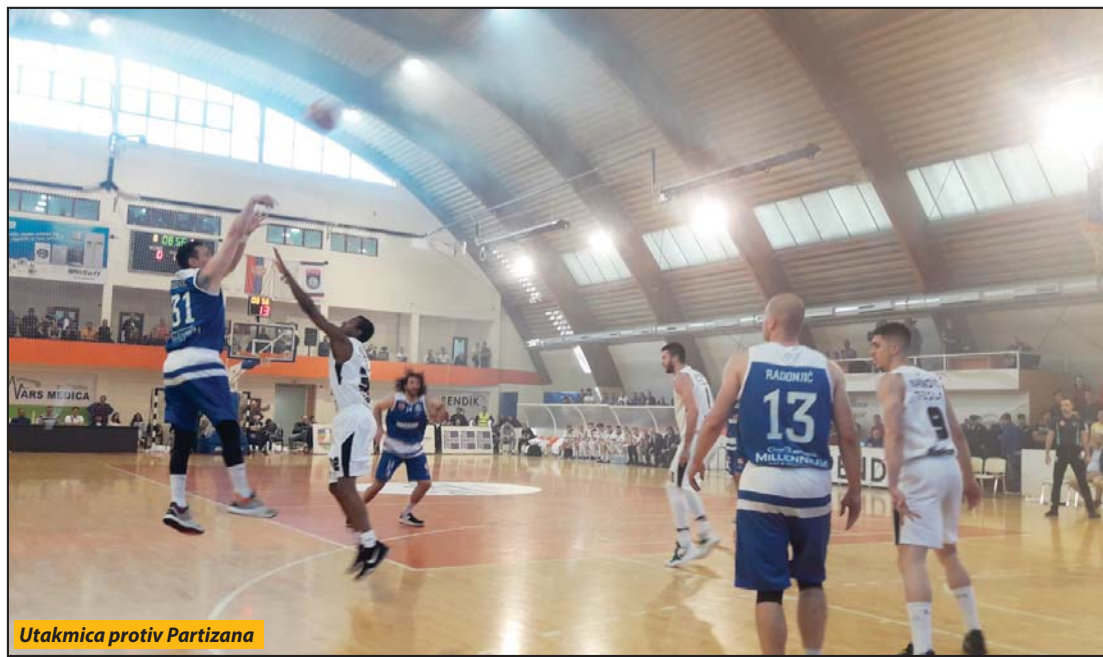
Utakmica protiv Partizana

posle mesec dana od starta lige zajedno sa čelnicima kluba dolazim do ključka da bi ambicije mogle i da porastu. Tada podižemo lestvicu i meta nam postaje plasman u prve četiri ekipe. Dobro znam da su u drugim centrima, možda i u samom Novom Pazaru, sa skepticizmom gledali i na našu prvu želju - ulazak u osam koji vodi do Superlige. Svrstavali su nas i u grupu timova koji će se boriti za opstanak u KLS, što ja, naravno, ni u jednom trenutku nisam dovodio u pitanje. Druga