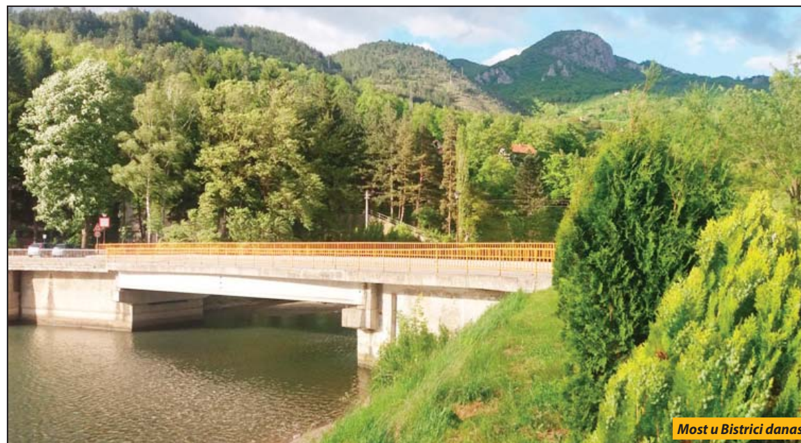
Most u Bistrici danas

Prijepolje - Mostovi su posebna priča o neimarskim poduhvatima. Mostovi su i velika metafora. Preći na drugu stranu, povezati, spojiti, prevazići prepreku... Prijepolje se uklapalo u tu „sliku“ i tu „mostovsku poeziju“ ali i neimarske poduhvate. Most u Šarampovu bio je uvek poseban. I Prijepoljci čekaju s uzdahom da počnu ponovo radovi, da se most vrati njegovim žiteljima. I dok čekaju gledajući kako nema pomaka već godinu i po, a tužna načeta konstrukcija nekoliko izaziva nelagodno, stigoše na red godine prisećanja na mostove koje smo gradili. Velike i značajne. Najvažnije tada u državi. Oba su bombardovana 1999. i obnovljena iste godine.