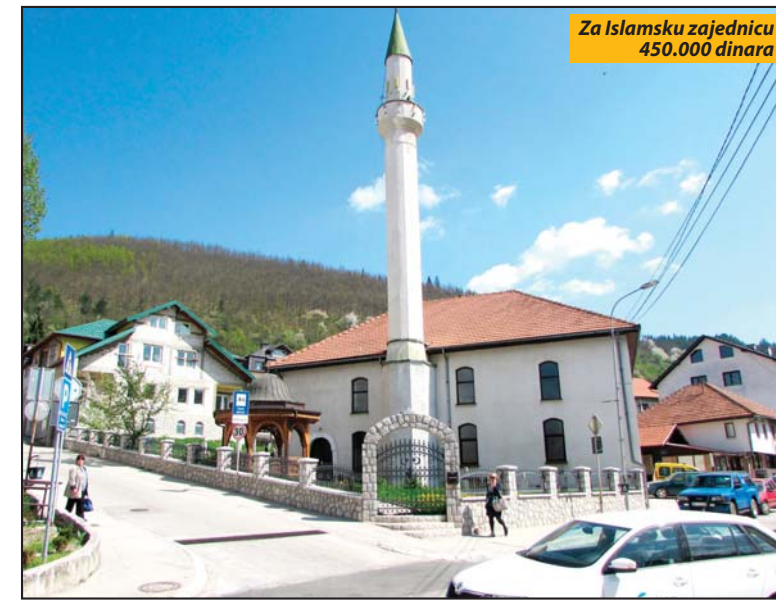
Za Islamsku zajednicu 450.000 dinara

Lokalna samouprava u skladu sa mogućnostima još od 2014. putem projektnog finansiranja pomaže obnovu bogomolja, a najveći iznosi za ove namene opredeljeni su ove i prošle godine - podseća predsednik Vasiljević. R. P.