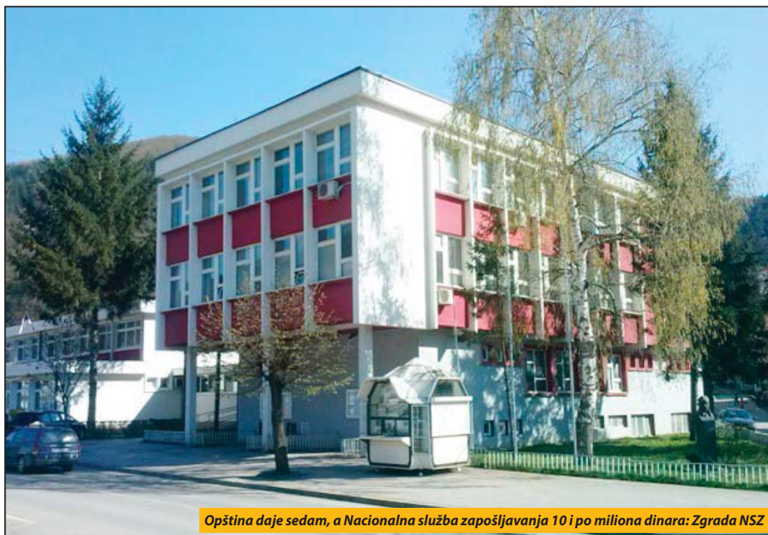
Opština daje sedam, a Nacionalna služba zapošljavanja 10 i po miliona dinara: Zgrada NSZ

■ Raspisan konkurs za sprovođenje javnih radova na kojima se angažuju nezaposlena lica i nezaposleni sa invaliditetom