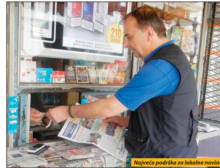
Najveća podrška za lokalne novine

roških novina pod nazivom „Javni interes u Varoškim novinama“ trebalo sufinansirati sa 1.400.000 dinara, a novoo-snovanu novovarošku televiziju „TV Zlatar“ za projekat „Zlatarska hronika“ sa 500.000 dinara. „Radio Zlatar“ moći će ove godine iz opštinske kase da račun na 300.000 dinara za realizaciju projekta pod nazivom „Blago našeg kraja“.