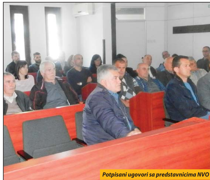
Potpisani ugovori sa predstavnicima NVO

Pola miliona dinara usmereno je i za podršku u radu udruženja koja deluju u oblasti ekologije. Iz opštinske kase će tako sa 290.000 dinara biti podržan projekat „Zebinovac - naš park“, koji je na javnom pozivu kandidovalo Udruženje „SMART“. Za realizaciju projekta pod nazivom „Za lepši grad“, lokalno Udruženje „Eko-Varoš“, dobiće sredstva u iznosu od 210.000 dinara. Pomoć iz opštinske kase od oko 100.000 dinara biće usmerena i za projektnu aktivnost Do-