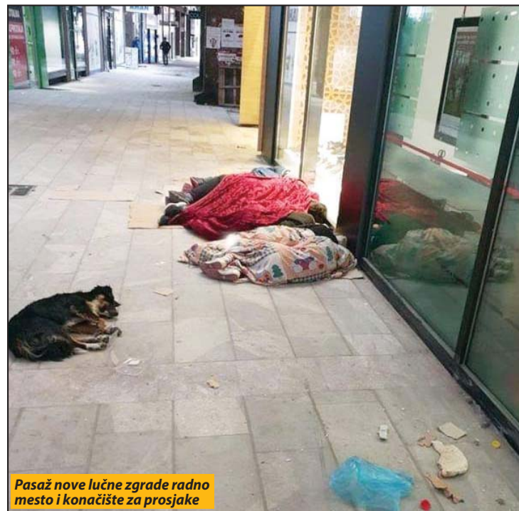
Pasaž nove lučne zgrade radno mesto i konačište za prosjake

Problem prosjačenja je dugo izražen u Novom Pazaru. U Centru za socijalni rad tvrde da je većina koja se bavi prosjačenjem iz dugih gradova (Beograd, Pančevo, Subotica, Čačak, Raška, Sjenica, Kragujevac i Kosovska Mitrovica), a „domaćih“ ima 6-7 i svi su iz romskog naselja Blaževo. Znaju se i dva punkta gde organizatori, u kombi vozilima, rano ujutru dovoze prosjake i kasno naveče ih sa istok mesta kupe. Takođe, znaju se i dve kuće, koje su organizatori prosjačenja, zakupili za smeštaj svojih „uposlenika“ i u njima konstantno boravi po njih stotinak. Za svakog se plaća 300 dinara dnevno. Tačan broj velikih i malih, starih i mladih prosjaka, ali se procenjuje da ih ima oko 300 svakog dana na ulicama ovog grada. Koncentrisani su u centralnim gradskim ulicama. Najviše ih je na terasama ugostiteljskih objekata, ispred velikih prodajnih objekata, mostovima, ali na posao idu i od vrata do vrata sa „potvrdama“ i fotografijama kojima se traži pomoć za obolelog člana porodice. Njihovo prisustvo, posebno je bilo vidljivo za vreme muslimanskog meseca posta Ramazana i Ra-