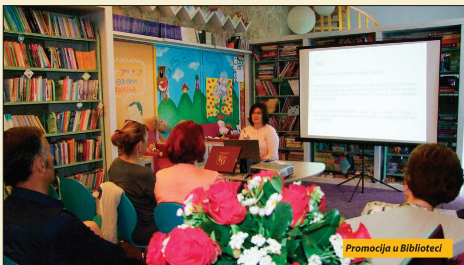
Promocija u Biblioteci

Ovo impozantno zdanje, nastalo kao amanet najvećeg legatora Bosne i Hercegovine, Gazi Husrev-bega, posle 480 godina, ima više od 100.000 bibliotečkih jedinica, a zbirka od 10 i po hiljada rukopisa na arapskom, persijskom, turskom i bosanskom jeziku od 2017. godine postala deo svetske pokretne kulturne baštine. Najstariji sačuvani rukopis iz te kolekcije datira iz 1106. godine. Gazi Husrev-begova biblioteka, pored toga što čuva rukopise od kojih neki predstavljaju izuzetne primerke