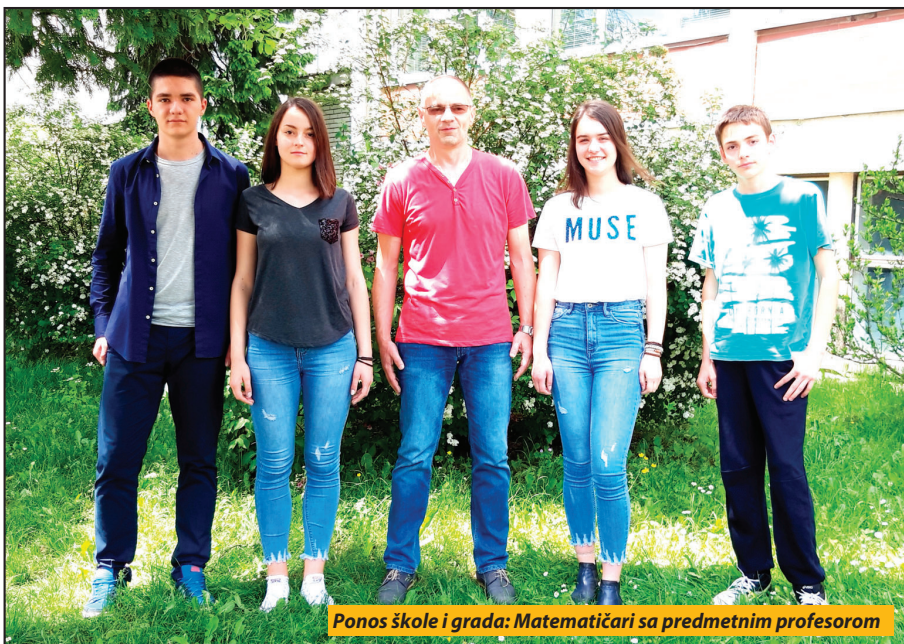
Ponos škole i grada: Matematičari sa predmetnim profesorom

Na ovoj tradicionalnoj matematičkoj olimpijadi, nedavno održanoj u Beogradu, mladi novovaroški matematičari su, os-