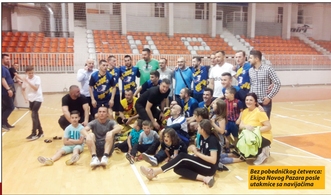
Bez pobeđničkog četverca: Ekipa Novog Pazara posle utakmice sa navijačima

U odlučujućoj utakmici Novi Pazar, bez četiri standardna prvotimca, izgubio od Ekonomca 8:2