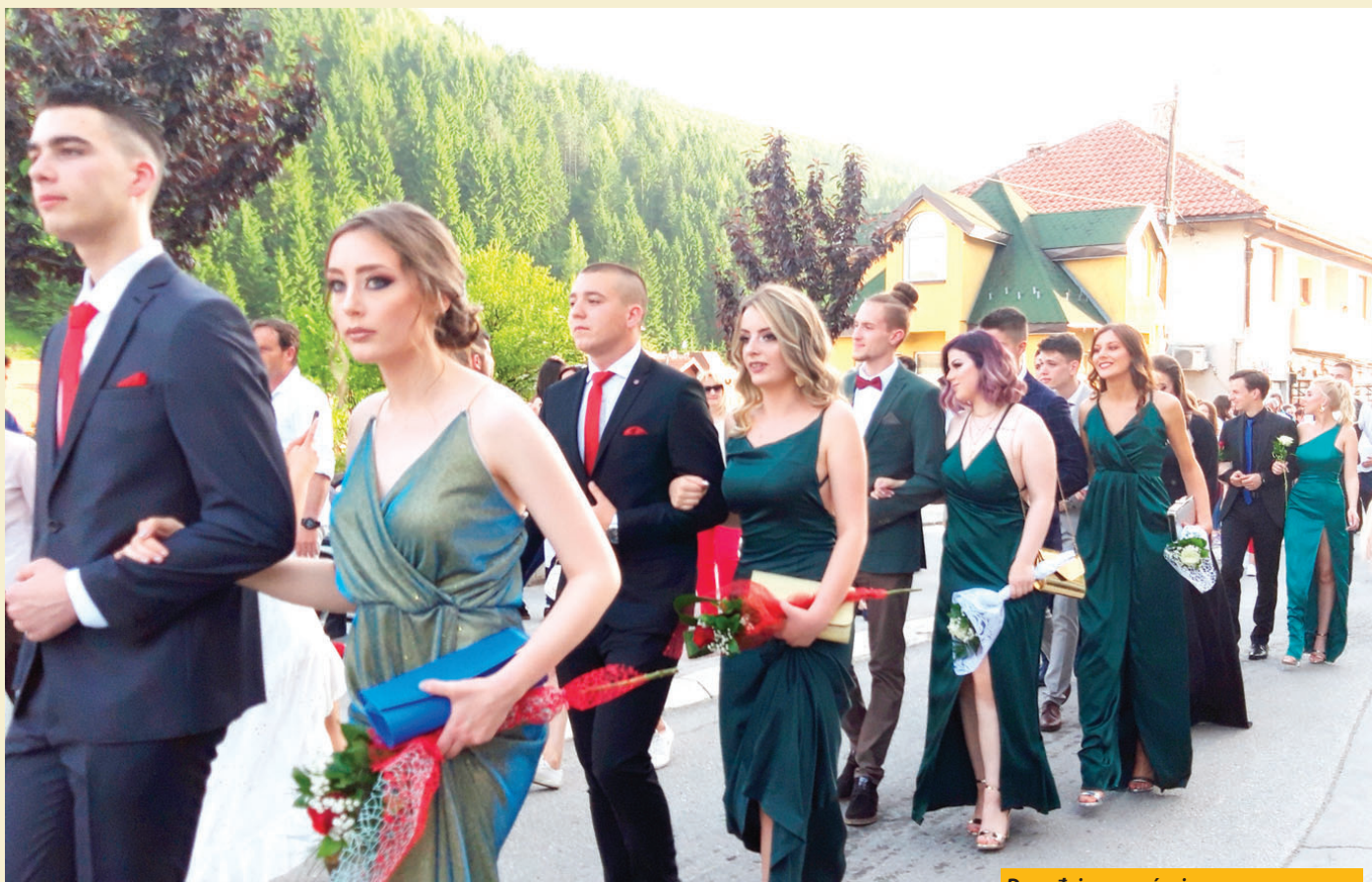
Događaj za pamćenje: Maturanti novovaroške Srednje škole

NOVA VAROŠ - Šetnja maturanata događaj je koji svakog juna izazove veliko interesovanje i razgali duše žitelja varošice na padinama Zlatara. Tako je bilo i pre nekoliko dana kada je stotinak svršenih srednjoškolaca prodefilovalo glavnom gradskom ulicom pleneći svojom lepotom, mladostu i razdraganošću. Ali i pažljivo biranim modernim kreacijama, kojima su, između ostalog, bat na