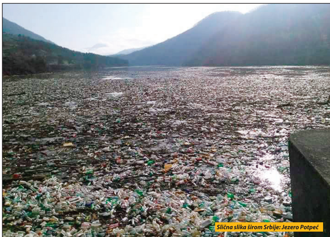
Slična slika širom Srbije: Jezero Potpeć

Priboj - Čišćenje jezera Potpeć od plastičnih flaša i ostalog plutajućeg otpada, u okviru akcije „Očistimo reke i jezera“ biće organizovano u sredu, 26. jula. Pribojska lokalna samouprava je jedna od 13 u Srbiji koje su, na predlog dnevnog lista Blic, prihvatile organizaciju akcije, a u čišćenju će učestvovati sportska udruženja, javna preduzeća i nevladine organizacije.