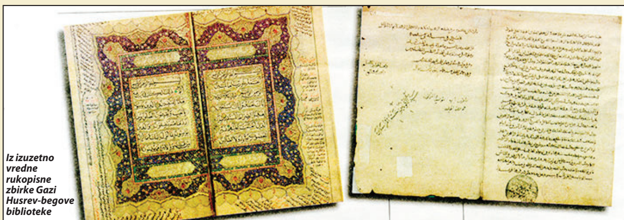
Iz izuzetno vredne rukopisne zbirke Gazi Husrev-begove biblioteke

Gazi Husrev-begova biblioteka predstavljena u Prijepolju