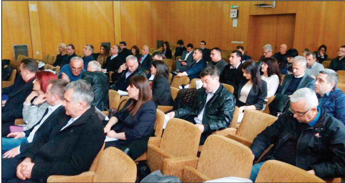
Prethodna sednica 28. marta: Odbornici SO Prijepolje