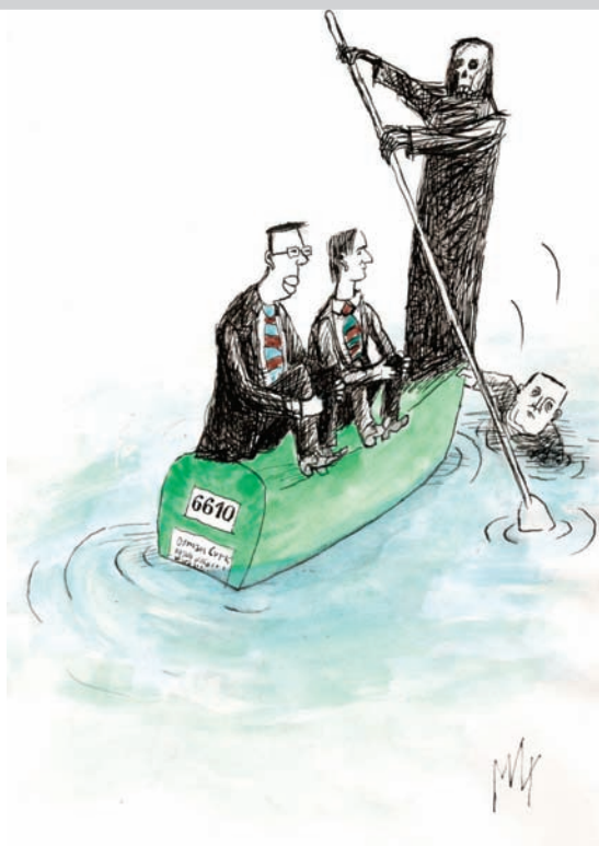
Ilustracija: M. Đerlek