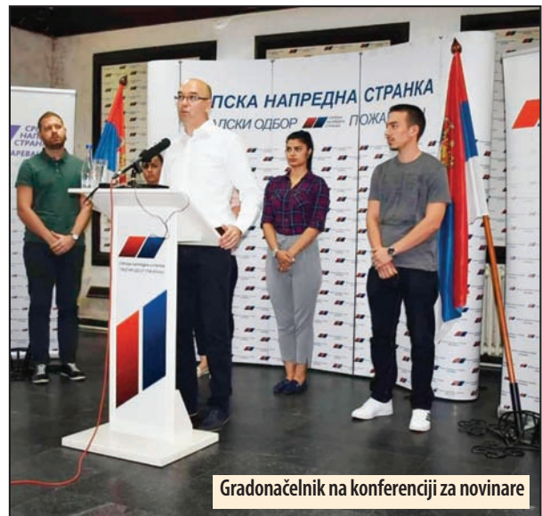
Gradonačelnik na konferenciji za novinare

- U periodu od 2016. do 2018. godine ulaganje u seoske MZ iznosilo je 1.028.918.707 dinara. U 2019. godini 345 miliona dinara, a na pomenuta ulaganja treba dodati 95 miliona koja očekujemo od EPS-a. Očekujemo da bude ulaganje u putnu infrastrukturu na pod-