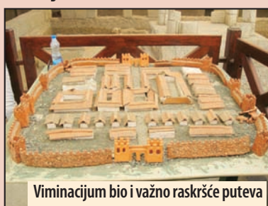
Viminacijum bio i važno raskršće puteva

Viminacijum je svoj puni procvat doživeo tokom 1. i 2. veka nove ere, kada je vojni logor prerastao u glavni grad velike rimske provincije Gornje Mezijske. Razvio se na raskrsnici najvažnijih puteva u imperiji i postao njen važan politički i privredni centar. U njemu je tada živelo oko 30.000 stanovnika. U vreme cara Hadrijana (2. vek nove ere) Viminacijum je dobio status municipijuma, što je podrazumevalo izvestan stepen autonomije. Najvažniju stepenicu u razvoju ovog grada predstavlja dobijanje statusa kolonije, u vreme cara Gordijana 239. godine. Jedna od značajnih privilegija kolonije bilo je pravo kovanja novca. Novac iz Viminacijuma postao je neobično važan za istoriju i hronologiju u oblastima srednjeg i donjeg Dunava.