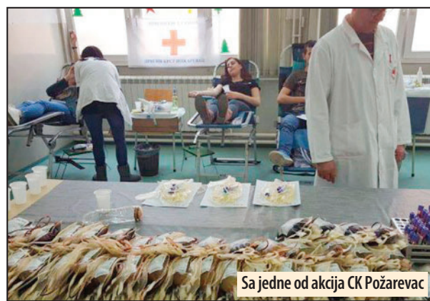
Sa jedne od akcija CK Požarevac

- Akcije dobrovoljnog davanja krvi koje organizuje naša organizacija i dalje su veoma uspešne. Novi zakon je krenuo da se u Požarevcu primenjuje u maju prošle godine i nije se osetio neki pad davalacstva, kao što je bio slučaj u drugim gradovima. Crveni krst Požarevac uvek prikupi nedeljne jedinice krvi koje su zacrtane pla-