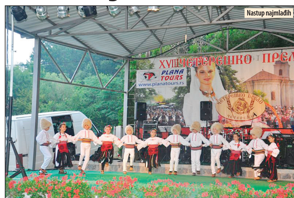
Nastup najmlađih

Svake godine u ovom velelepnom kompleksu okupljamo