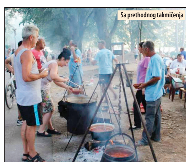
Sa prethodnog takmičenja

interesovanje među starijim ribolovcima vlada za lov na šarana. Odbojka je sport za koji žive Gradištanici, i kada se u Srbiji pomene odbojka, mnogi pomisle na ovu varošicu i obratno, kada se pomene Veliko Gradište mno-