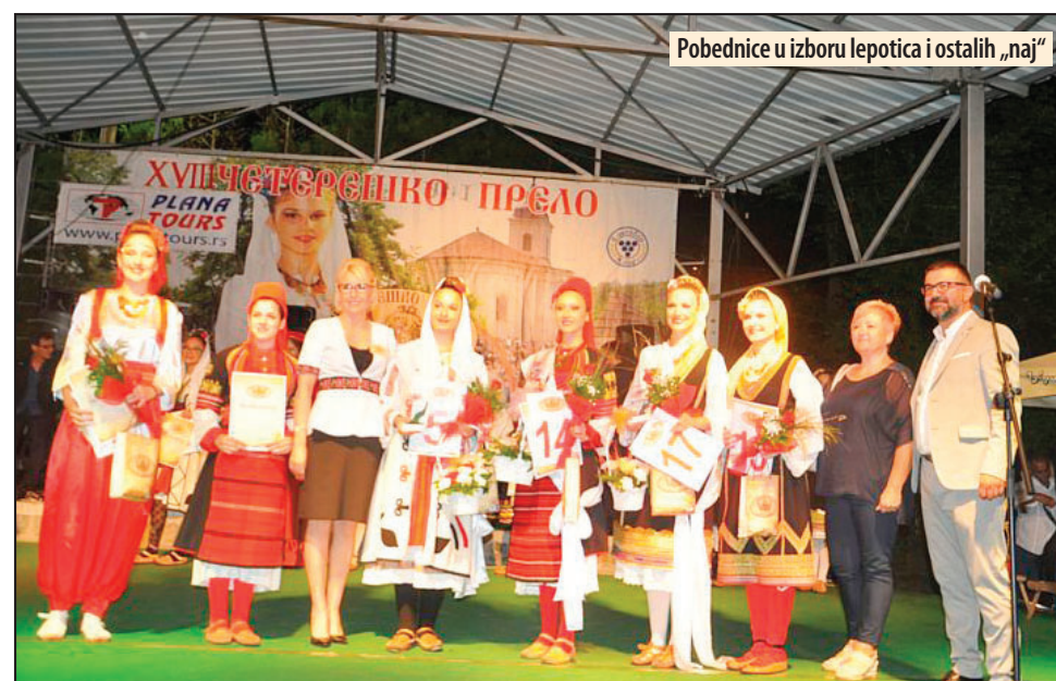
Pobednice u izboru lepote i ostalih „naj“