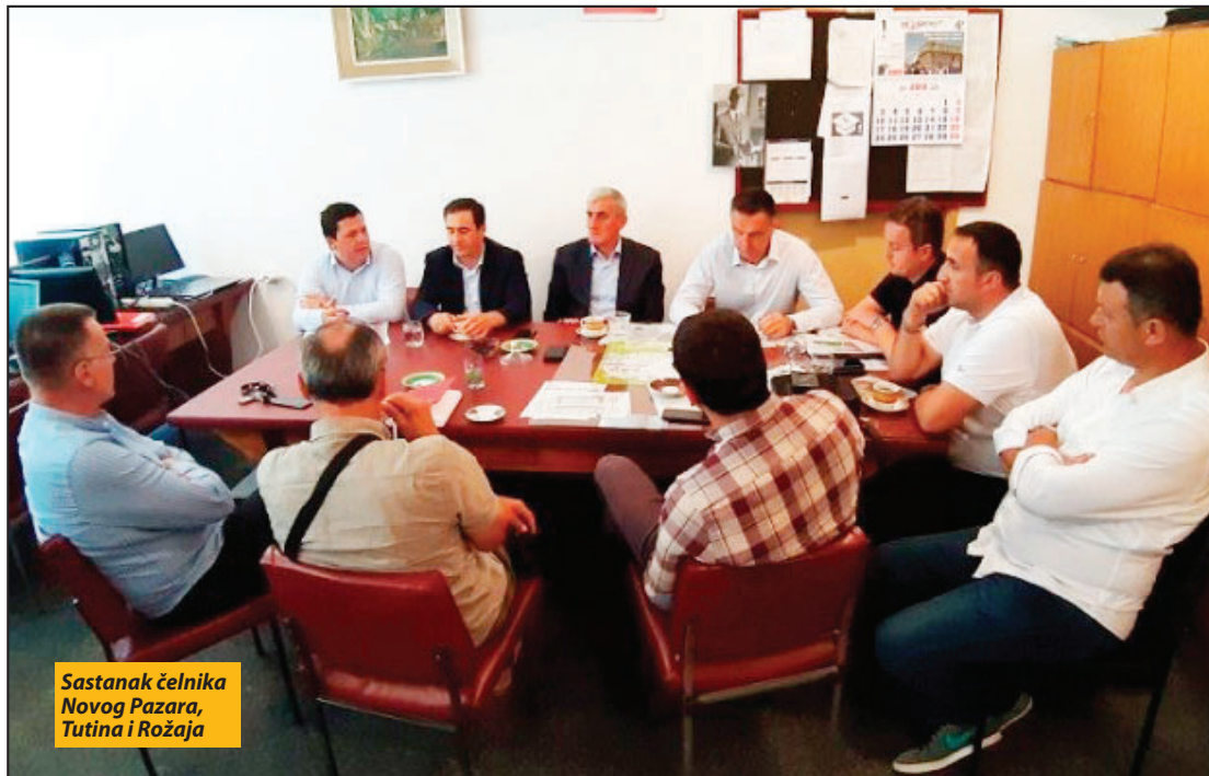
Sastanak čelnika Novog Pazara, Tutina i Rožaja