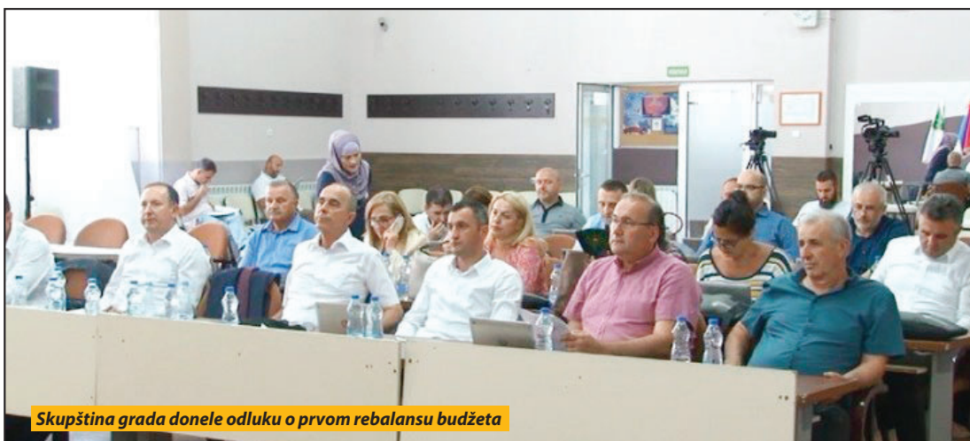
Skupština grada donele odluku o prvom rebalansu budžeta

Gradska skupština usvojila je odluku i o završnom računa budžeta za prošlu godinu. U ovom dokumentu se navodi da je u gradskoj kasi bilo 2,4 milijarde dinara ili oko 99 odsto planiranih sredstava. Ukupni rashodi bili su veći od 2,6 milijardi dinara, pa je na kraju fiskalni deficit bio 233 miliona dinara, ali kad se uračunaju i neutrošena sredstva iz prethodnih godina, on-