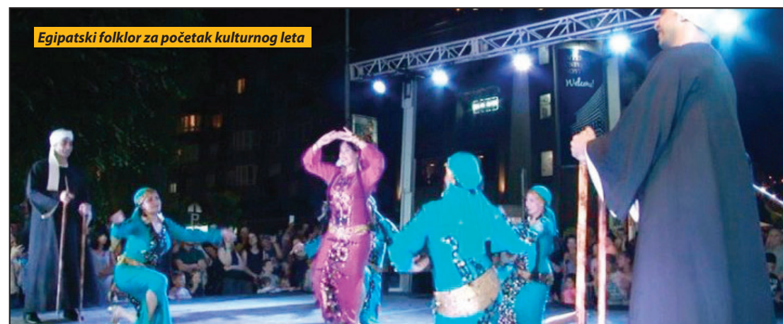
Egipatski folklor za početak kulturnog leta