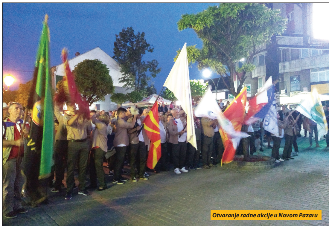
Otvaranje radne akcije u Novom Pazaru