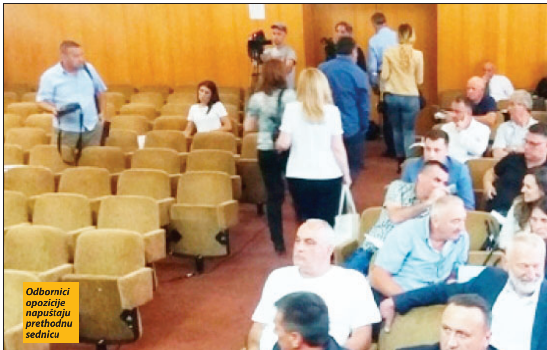
Odbornici opozicije napuštaju prethodnu sednicu

kilometra ovog puta ali je nova vlast, kako se navodi, konkurisala sa starim projektom za sredstva kod Ministarstva privrede. U septembru 2017. potpisan je ugovor sa firmom „Putevi Zlatar“ vredan 27 miliona i 637 hiljada dinara, od kojih je opština učestvovala sa nešto više od 16 miliona. Radov su započeti te godine ali do danas taj kilometar i po puta nije završen. Bilo je i naknadnih radova koji su naplaćeni sudskim putem i koji su opštinu koštali 20.000 dinara. Kako opozicija navodi u materija-