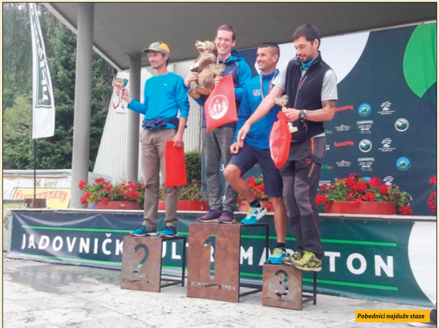
Pobednici najduže staze

Prijepolje - Na petom Jadovničkom ultramaratonu učestvovalo je ovog jula 209 trkača iz 10 zemalja, koji su trčali na tri staze dužine od 22, 53 i 73 kilometra. Pa iako vreme nije išlo na ruku takmičarima, niko od učesnika nije odustao od trke koja je, na zadovoljstvo organizatora, prošla bez većih problema.