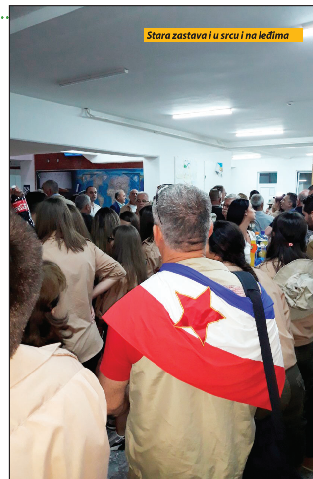
Stara zastava i u srcu i na ledima

Đerdapa pa do Triglava“, da akcijaši postanu ambasadori mira u svojim zajednicama. Počelo je u Novom Pazaru, koji ima tradiciju omladinskih radnih akcija. Do brigadirskog rastanka ostala su samo još dva dana. Sedmodnevna radna akcija je pilot projekat. Brigadiri rade na sređivanju lokacije na jezeru Gazivode poznatijem kao Ribaričko jezero, na kojoj treba da se izgradi Pazarska plaža, odnosno sportsko-rekreativni centar „Vitkoviće“. Ovaj projekat će se realizovati po fazama, a na površini od 2,6 hektara biće izgrađena plaža