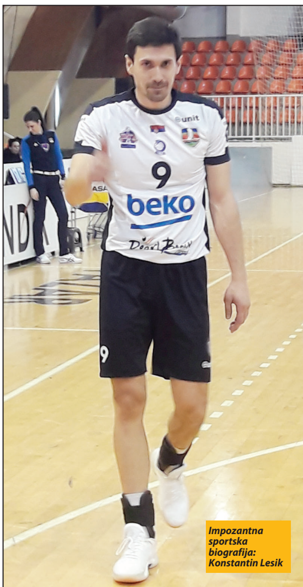
Impozantna sportska biografija: Konstantin Lesik