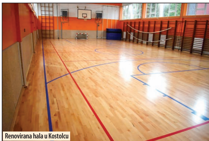
Renovirana hala u Kostolcu

Veliko Gradište - Opština Veliko Gradište u periodu od 27. jula do 16. avgusta organizuje javnu raspravu o nacrtu odluke o boravišnim taksama. Prema ovom nacrtu, za svaki dan boravka u ugostiteljskom objektu taksa bi koštala 80 dinara za odrasle, a 40 za decu od sedam do 15 godina starosti. Plaćanja bi bila oslobođena deca do sedam godina, lica upućena na banjsko i klimatsko lečenje, invalidi, učenici i studenti tokom organizovanog boravka, lica sa boravkom od preko 30 dana, kao i strani državljani koji su od ovog rashoda oslobođeni prema međunarodnim konvencijama i sporazumima. M. V.