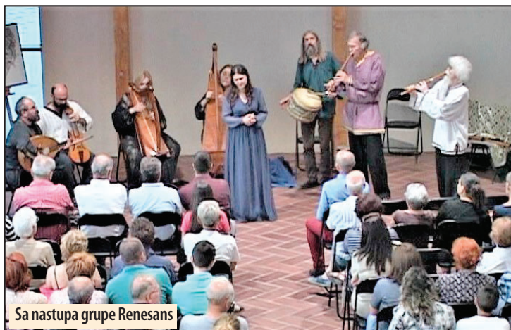
Sa nastupa grupe Renesans

certom označio je početak održavanja 12. po redu Međunarodnog sajma Dunava. Muziku srednjeg veka i putujućih svirača koju već pola veka predsta-