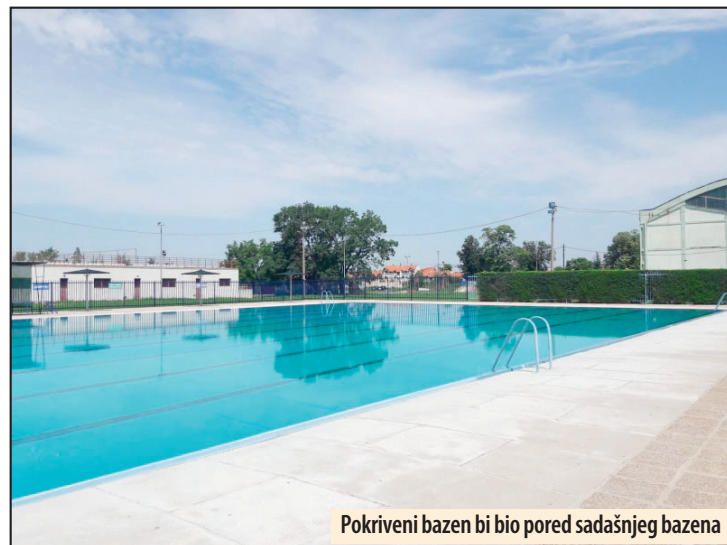
Pokriveni bazen bi bio pored sadašnjeg bazena

na je podloga, zamenjena sedišta, postavljena nova LED rasveta, urađen plato i fasada. Za rekonstrukciju Hale sportova iz budžeta izdvojeno je