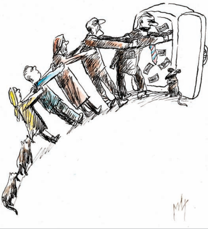
Ilustracija: M. Đerlek