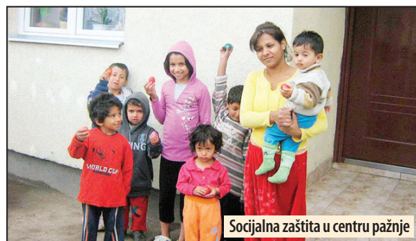
Socijalna zaštita u centru pažnje

Požarevac - Na zvaničnom sajtu Grada Požarevca objavljen je predlog raspodele novca za programe nevladinih organizacija i udruženja. Prema tom predlogu, trebalo bi da se raspodeli svih 14,3 miliona dinara i to na 48, uslovno rečeno, projekata. Doneto je i rešenje o odbijanju 31 projekta. Projekti su ocenjivani i po oblastima, a gotovo polovina novca od sedam miliona dinara u konkursu je namenjena za unapređenje socijalne zaštite. Novac mahom ide za nabavku materijalnih stvari. Tako je prihvaćeno više sličnih projekata u kojima se nabavljaju i dele socijalni paketi, školski pribor ili građevinski materijal. Jedno udruženje u ovoj oblasti dobilo je zbirno blizu 1,6 miliona dinara za tri projekta. To je humanitarno udruženje „Porodično preventivni edukativni centar“ kome su odobreni projekti „Socijalni paket“ (nabavka i podela paketa), „Pomoć socijalno ugroženom stanovništvu“