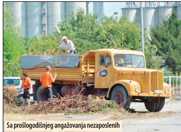
Sa prošlogodišnjeg angažovanja nezaposlenih

odnosno srazmerno vremenu radnog angažovanja na mesečnom nivou, koja se uvećava za pripadajući porez i doprinose za