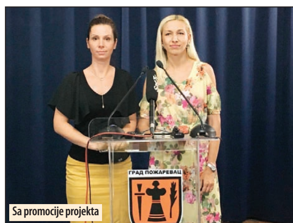
Sa promocije projekta

- Glavni cilj projekta jeste smanjenje nezaposlenosti među ženskom populacijom koja živi u ruralnom području, što se može postići jačanjem ženskog preduzetništva, unapređenjem veština i sposobnosti ciljane grupe. Planirana je obuka za započinjanje poslovanja za 40 žena iz seoskih područja i izrada 20 biznis planova zainteresovanim učesnicama. Plan je da se najpre obidu seoska naselja, gde bi u razgovoru sa ženskom populacijom bila predstavljena ideja projekta i objašnjena način sprovođenja obu-