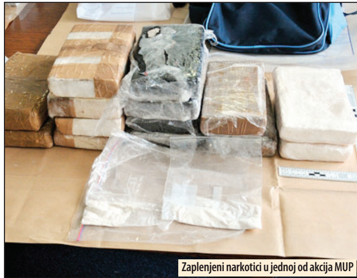
Zaplenjeni narkotici u jednoj od akcija MUP