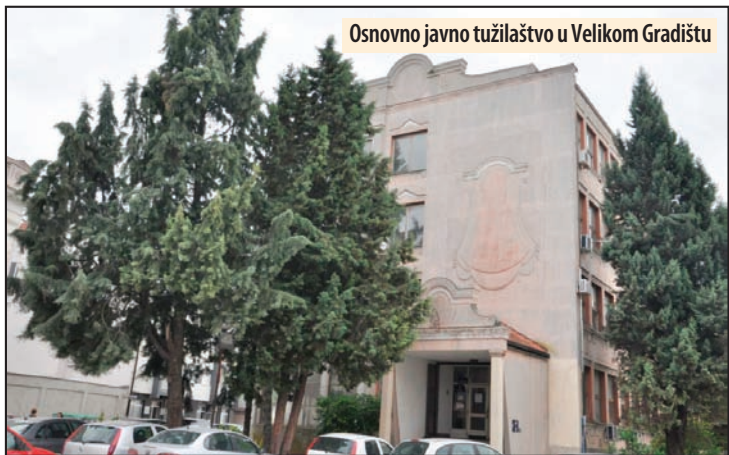
Osnovno javno tužilaštvo u Velikom Gradištu