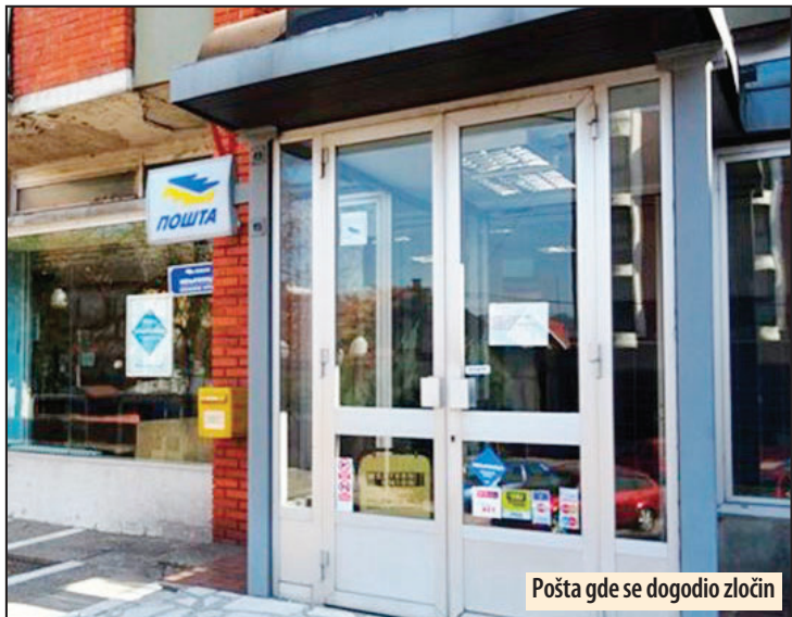
Pošta gde se dogodio zločin