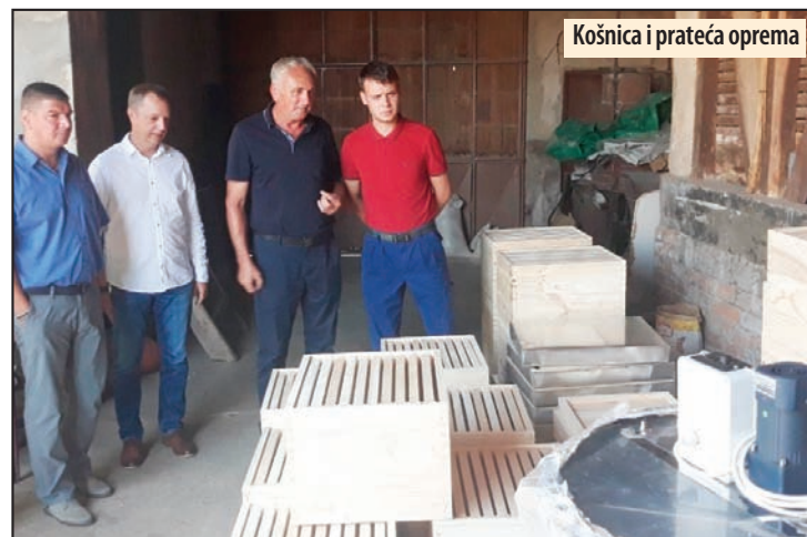
Košnica i prateća oprema

duzmu sledeće preventivne mere: - držati svinje zatvorene, sprečiti direktan kontakt svojih životinja sa divljim svinjama, ne hraniti svinje pomijama, koristiti zaštitnu odeću i obuću u kontaktu sa svinjama, prijaviti veterinaru i veterinarskom inspektor u što kraćem roku svaku obolelu i uginulu svinju,