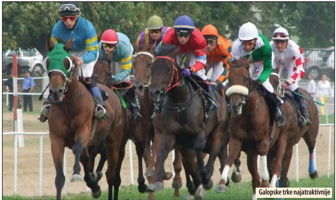
Galopske trke najatraktivnije