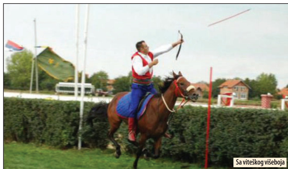
Sa viteškog višeborja