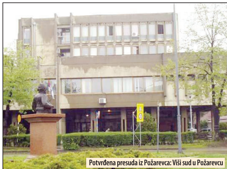
Potvrđena presuda iz Požarevca: Viši sud u Požarevcu

Posle hapšenja, u prisustvu advokata iz Velikog Gradišta koga je sam