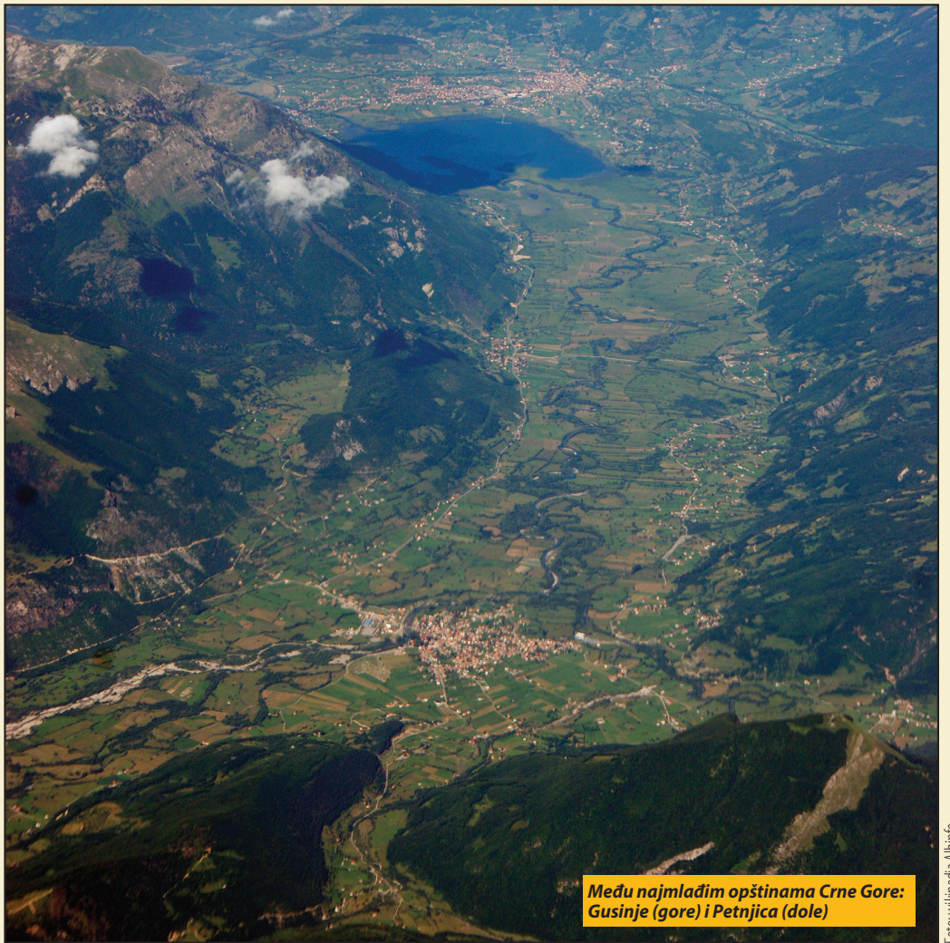
Među najmlađim opštinama Crne Gore: Gusinje (gore) i Petnjica (dole)

Naglasio je da je minula godina ispunjena brojnim ulaganjima u infrastrukturne projekte, od izgradnje vodovoda do modernizacije putne mreže. Najavio je da je u toku rekon-