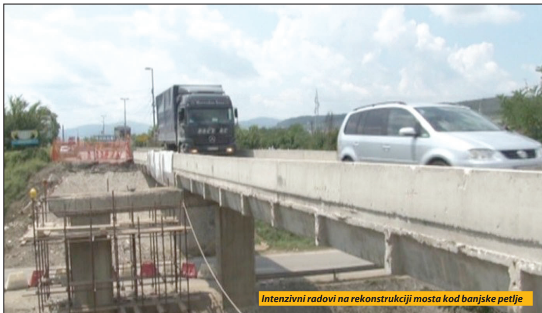
Intenzivni radovi na rekonstrukciji mosta kod banjske petlje