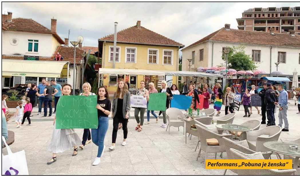
Performans „Pobuna je ženska“