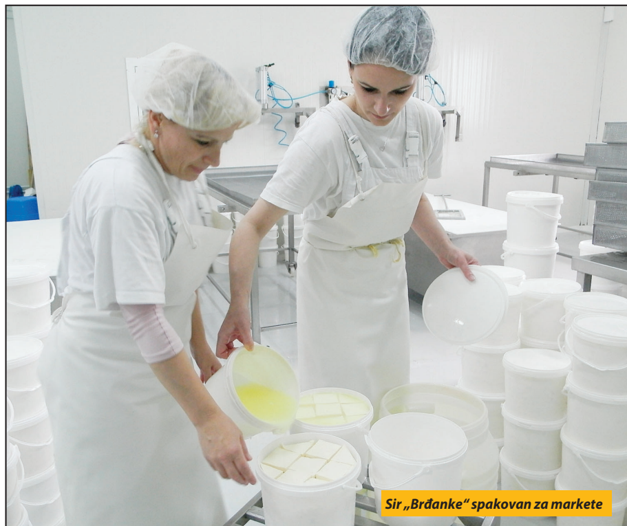
Sir „Brđanke“ spakovan za markete

- I „Brđanka“ je od osnivanja 2010. godine poslom bila vezana za poljoprivredu i selo, pa je mlekara došla kao normalan sled događaja. Osim što smo od vajkada, kao i drugi u selu prvi-