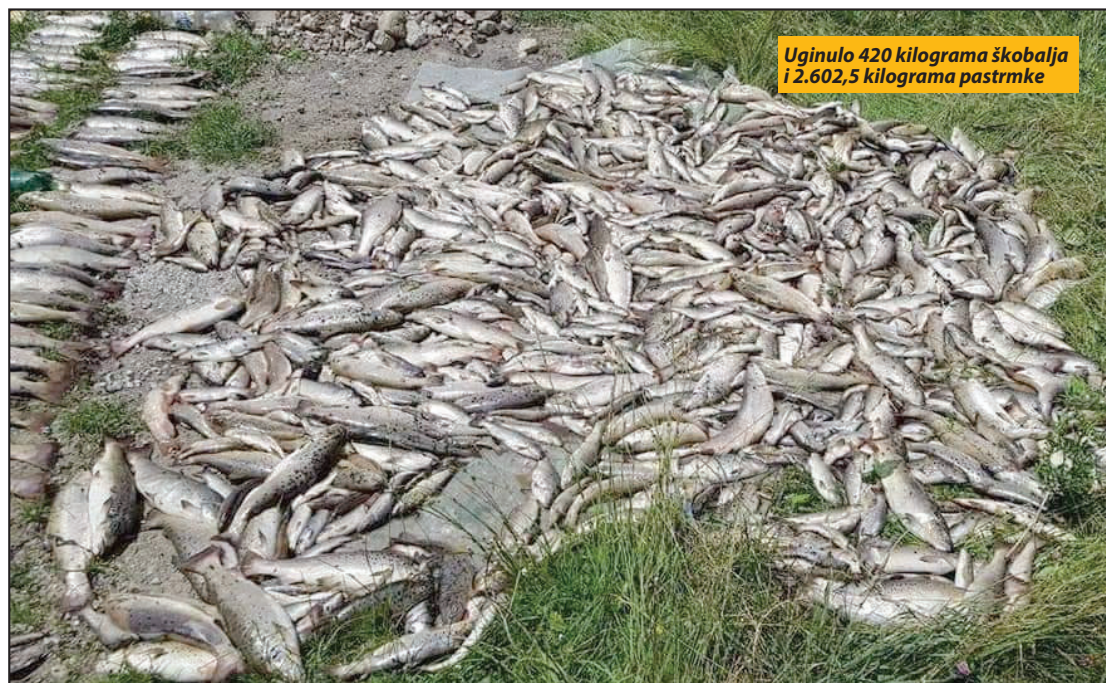
Uginulo 420 kilograma škobalja i 2.602,5 kilograma pastrmke