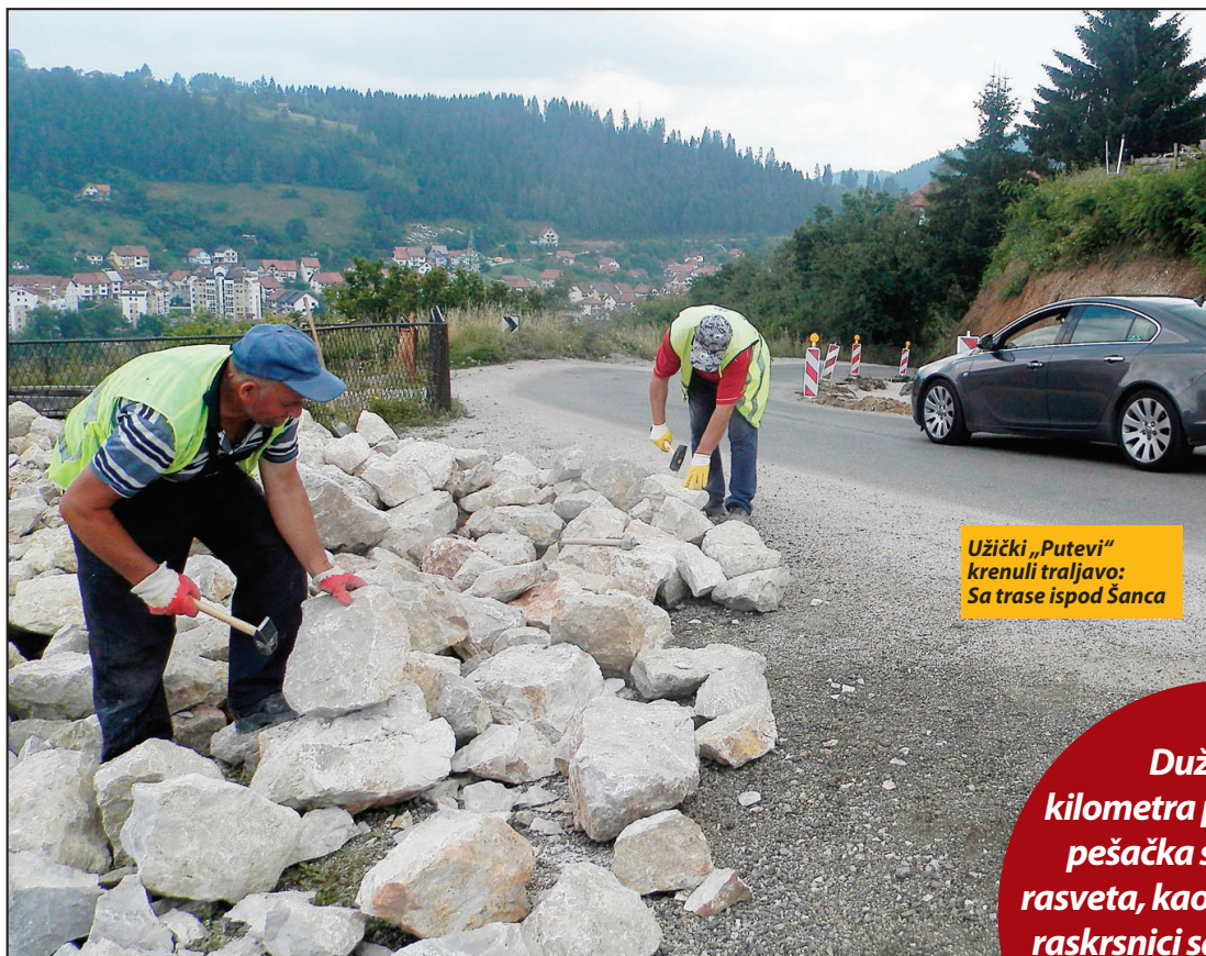
Užički „Putevi“ krenuli traljavo: Sa trase ispod Šanca

- Kako se ne bi ugrozila bezbednost pešaka i potkopale kuće u naselju Šanac, na predlog „Puteva Srbije“ projekat koji je pre osam godina urađen uz učešće i po zahtevima tadašnje vlasti, pretrpeo je značajne izmene. Prema novom, pešačka staza sa obe strane gradiće se samo na delu od Branoševca do iznad mini-piće terena. U nastavku, pešačka staza je predviđena samo s donje strane, biće široka dva metra i uključivaće se u pešačku stazu koja se od „Panorema“ već spustila do Milanovca. Zbog toga će na ovom delu potporni zidovi planirani sa gornje, leve strane, biti nešto niži, a umesto od betona radiće se sistemom gabiona, odnosno od lomljenog kamena koji se slaže u žičane koševе. Sve to će pojefti-