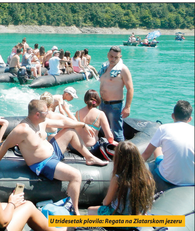
U tridesetak plovila: Regata na Zlatarskom jezeru