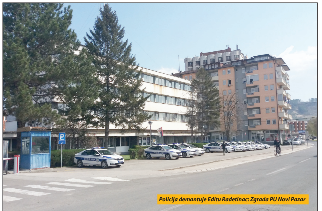
Policija demantuje Editu Radetinac: Zgrada PU Novi Pazar

Novi Pazar - Ni posle više od nedelju dana ne stišavaju se priče o slučaju Edite Radetinac. Ova četrdesetogodišnja Novopazarka optužila je policijske službenike PU Novi Pazar za maltretiranje i višesatno zadržavanje u policijskoj zgradi. Tvrdi da su je policijski službenici napali, pred dvoje maloletne dece i da je, tom prilikom, dobila hematoma na ruci.