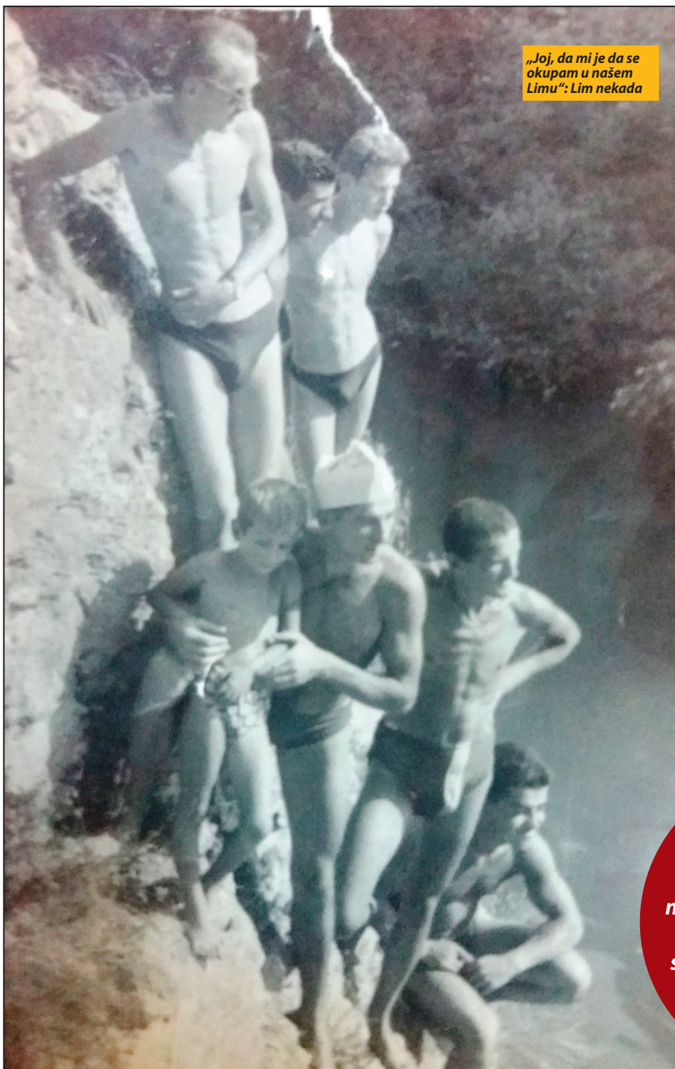
„Jo, da mi je da se okupam u našem Limu“: Lim nekada

Lim je bio nešto što se podrazumevalo, sigurno, neprolazno. Na drugu stranu reke prelazilo se čamcima, svuda su bile „rakite“, odnosno vrbe, pa su obale bile skrivene. Žene su izlazile na reku da peru veš, sve sa prakljačama. Ostalo je zapisano i kako se kraj Lima sušila vuna, pa je izgledalo da je sneg pao kad mu vreme nije. Svoje poslove kraj reke obavljali su oni koji su zanatom bili vezani za