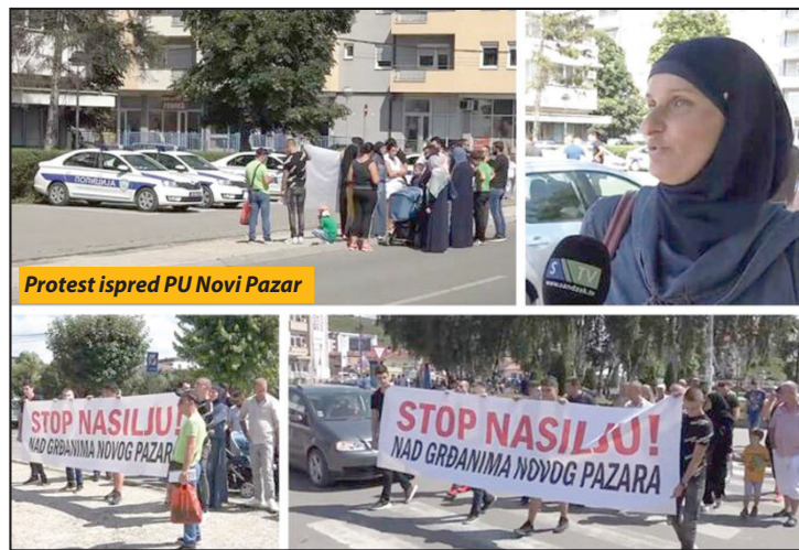
Protest ispred PU Novi Pazar

rekla i medijima, sve se dogodilo poslednjeg dana jula ove godine, kada je otišla u Policijsku upravu da podigne ličnu kartu za svog sina. PU Novi Pazar, u saopštenju, demantovala je sve optužbe.