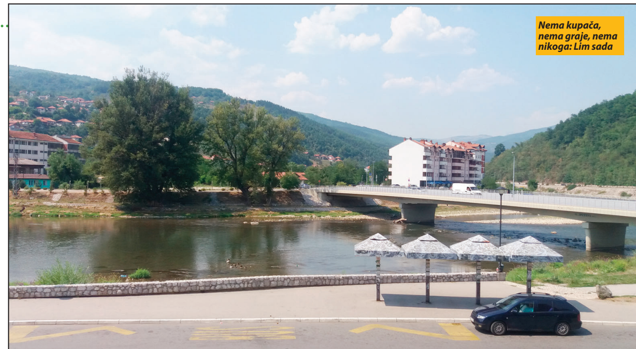
Nema kupača, nema graje, nema nikoga: Lim sada

Prijepoljci su Lim uvek smatrali izuzetnom rekom. Pedesetih godina prošlog veka počinju veliki planovi, pa i oni „turistički“. I tu je sve stalo, na velikim, nerealizovanim planovima