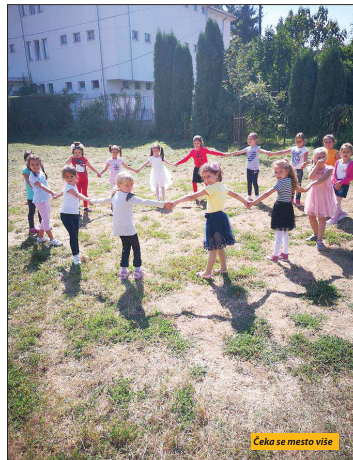
Čeka se mesto više

Konkretni rokovi trebalo je da se definišu, kako je tada rečeno, kada u ovaj grad dođu predstavnici Ministarstva prosvete zaduženi za investicije. Projekat za novi objekat je urađen. Umesto sadašnjih šest, novi vrtić će imati 16 učionica, izgrađenih i opre-