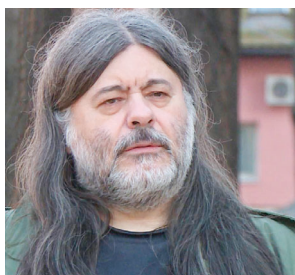
Teofil Pančić / Beograd