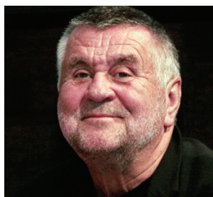
Rajko Grlić / Zagreb