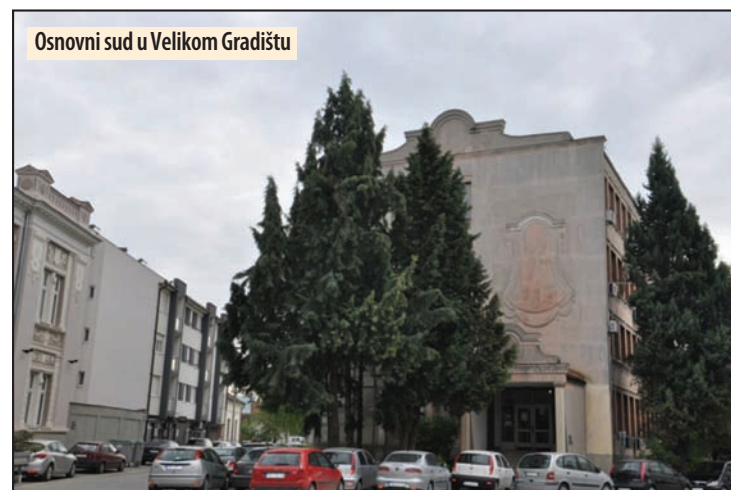
Osnovni sud u Velikom Gradištu

Osumnjičeni je uhapšen 5. septembra, a dva dana kasnije predat je osnovnom tužiocu na saslušanje. On