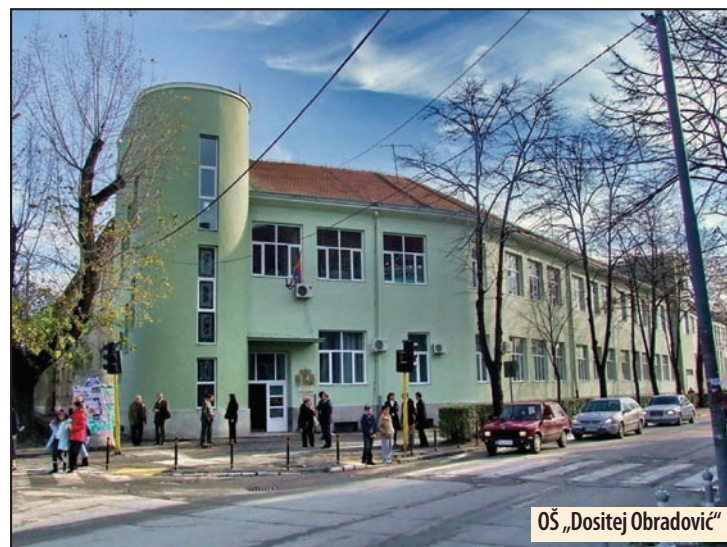
OŠ „Dositej Obradović“

O rekonstrukciji ove škole priča se u poslednje dve godine. Gradonačelnik Spasović kaže da je bilo određenih problema, ali da je na kraju potvrđen projekat rekonstrukcije i dobijeni lokacioni uslovi za izgradnju. Ostaje da se konkuriše za sredstva kod vladine kancelarije i odredi period kada će građevinski radovi i opremanje biti izvedeni.