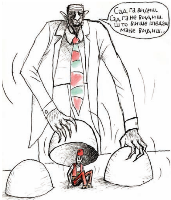
Ilustracija: M. Đerlek