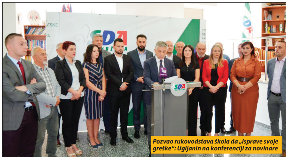
Pozvao rukovodstava škola da „isprave svoje greške“: Ugljanin na konferenciji za novinare

Na kraju pisma je priprećeno direktorima i zaposlenima u školama, da će protiv njih biti preduzete „sve zakonom propisane mere“, ako ne ispoštuju ove zahteve.