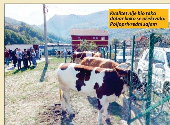
Kvalitet nije bio tako dobar kako se očekivalo: Poljoprivredni sajam