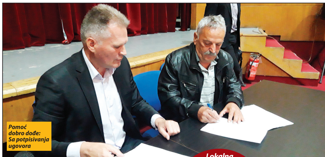
Pomoć dobro dođe: Sa potpisivanja ugovora

U okviru ovogodišnjih podsticajnih mera ruralnog razvoja, najveće interesovanje ispoljili su stočari, kojima je odobreno 80 zahteva za kupovinu krupnih grla stoke, kao i koza i ovaca. Na konkurs je stiglo i 110 zahteva proizvođača za kupovinu nove opreme i mehanizacije, od čega je najveće interesovanje vladalo za muzilice, sisteme za navodnjavanje, freze, mlekovode, pčelinju aparatu-