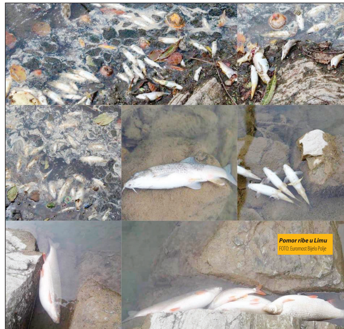
Pomor ribe u Limu

„Odrekli smo se valorizacije velikog nalazišta uglja na području Pljevalja za gradnju druge termoelektrane, iako je to velika investicija i donosi veliki broj radnih mjesta. Rekli smo ne, gradićemo nešto što je u duhu naše ekonomske politike, održivog razvoja i očuvanja životne sredine. Možda će buduće generacije za 50 ili 100 godina osmisli neku novu tehnologiju iskoriscavanja lignita u kombinaciji sa bio masom koja neće ugrozavati životnu sredinu“, istakao je Marković. Upozorio je da zagađivač mora biti kažnjen bez obzira na to da li je pojedinac ili kompanija. Marković je poručio da se biznis više ne može pokretati ako se ne poštuje zaštita životne sredine. „Ne smijemo dozvoliti da se ponovi zagađenje kakvo je bilo u rijeci Cehotini u Pljevljima, u Limu u Bijelom Polju ili kao što je zagađenje rijeke Zete“, kazao je Marković na panelu „Ekologija - edukacija i biznis“.