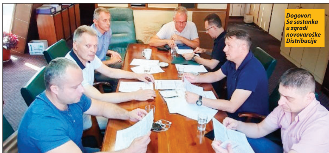
Dogovor: Sa sastanka u zgradi novovaroške Distribucije