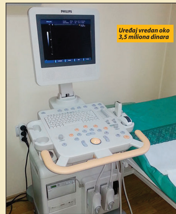
Uređaj vredan oko 3,5 miliona dinara

Direktor užičkog Zdravstvenog centra dr Miloš Božović je istakao da je Prijepolje jedna od retkih lokalnih samouprava koje pomažu radu lokalnog Doma zdravlja. Da je to tako potvrđuje i podatak da je Domu zdravlja u ovoj godini, iz opštinskog budžeta određeno 15,5 miliona dinara. Nabavljeno je sanitetsko vozilo i kotao kako bi se prešlo na grejanje na pelet u Zdravstvenoj stanici u Brodarevu. I. H. D.