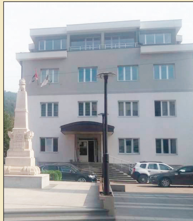
„Široka“ pomoć komšijama: SO Prijepolje

Od devet miliona dinara za informisanje građana Prijepolja, više od trećine medijima iz Novog Pazara