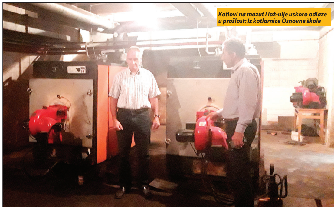
Kotlovi na mazut i lož-ulje uskoro odlaze u prošlost: Iz kotlarnice Osnovne škole