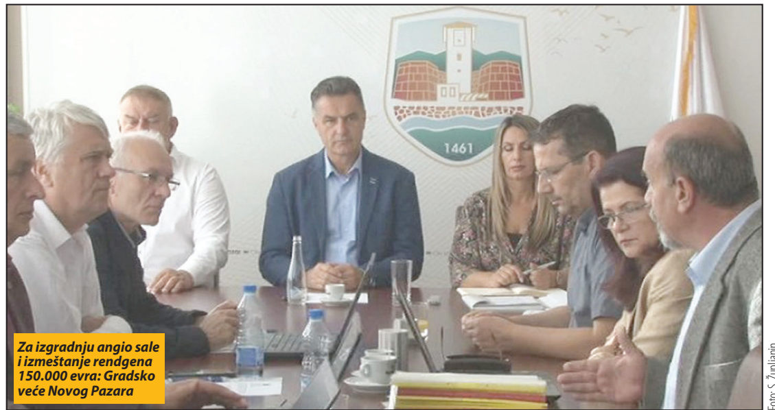
Za izgradnju angio sale i izmeštanje rendgena 150.000 evra: Gradsko veće Novog Pazara