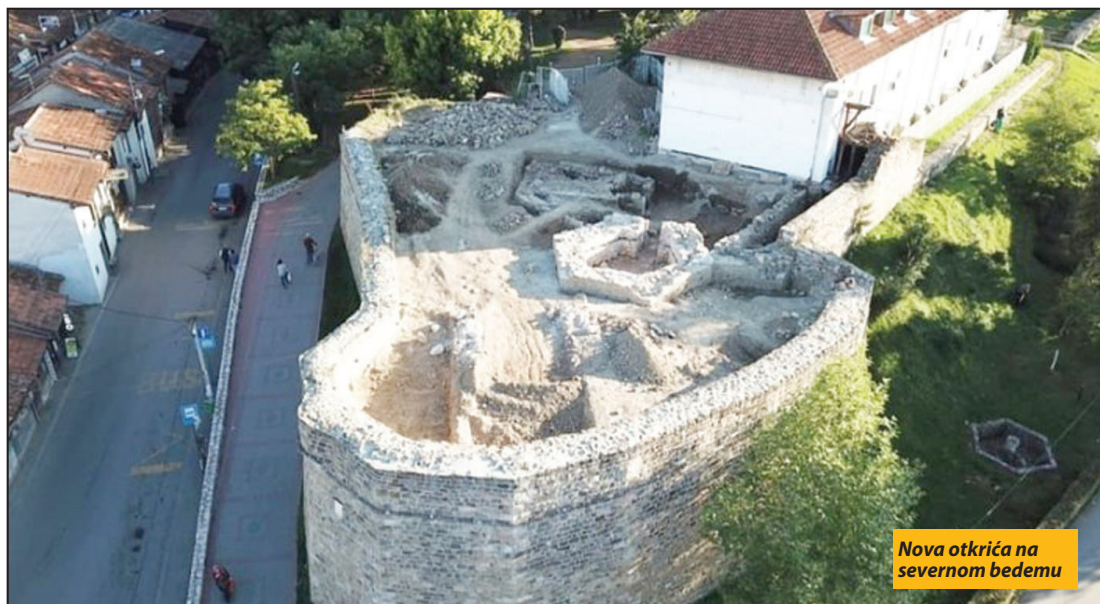
Nova otkrića na severnom bedemu