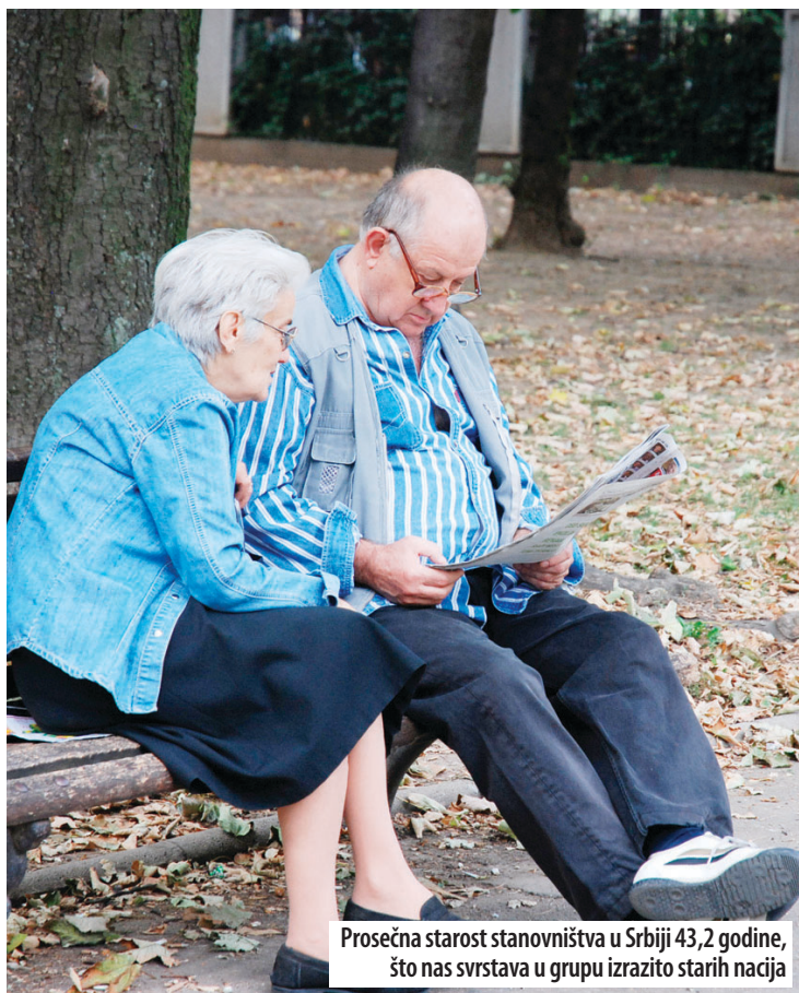
Prosečna starost stanovništva u Srbiji 43,2 godine, što nas svrstava u grupu izrazito starih nacija

■ Najavljeno je povećanje penzija. Šta je potrebno za dostojanstvenu starost?