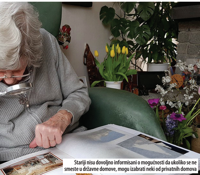
Stariji nisu dovoljno informisani o mogućnosti da ukoliko se ne smeste u državne domove, mogu izabrati neki od privatnih domova

„Država time dokazuje svoju socijalnu svest i empatiju prema našoj najstarijoj populaciji prema kojoj se svi moramo odgovorno i humano odnositi. Mnogo starih žive sami u jako lošim uslovima, nisu kadri da se samo-