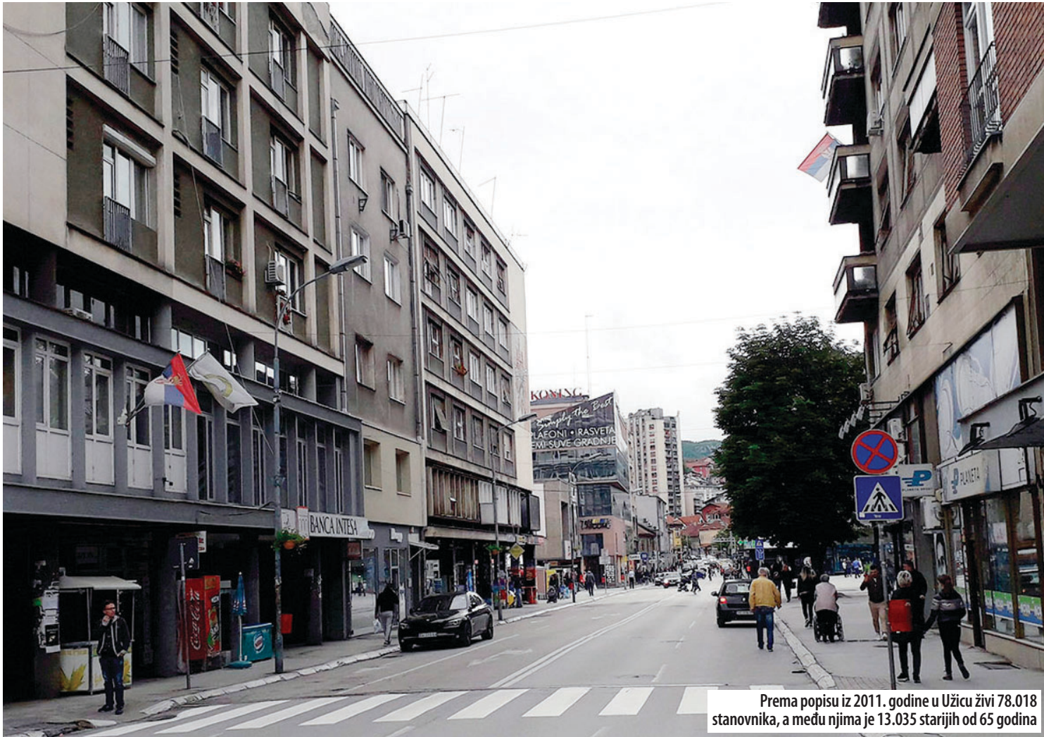
Prema popisu iz 2011. godine u Užicu živi 78.018 stanovnika, a među njima je 13.035 starijih od 65 godina