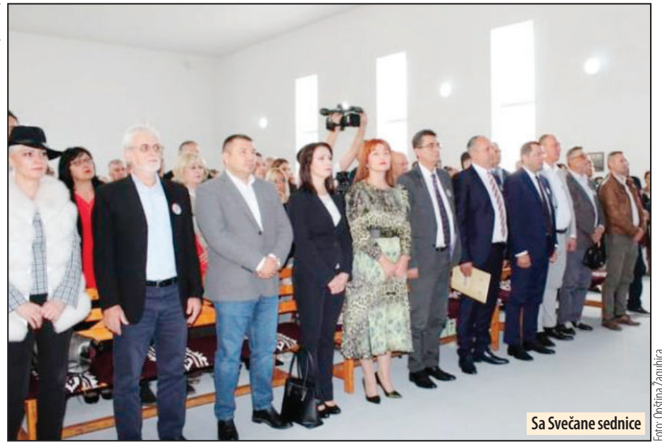
Sa Svečane sednice

- Konačno su se stekli uslovi za dovođenje velikih investitora i otvaranje radnih mesta za 100 do 150 ljudi. Sredstvima