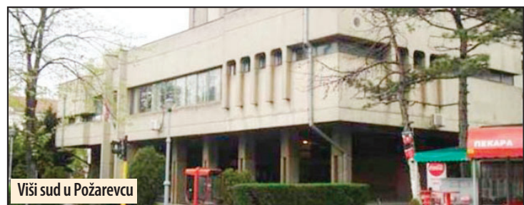
Viši sud u Požarevcu

dao ubodnu ranu u nogu 26. godišnjem muškarcu i naneo mu lake telesne povrede. Policija ga je uhapsila u blizini ugostiteljskog objekta dok je pokušavao da pobjegne. Po nalogu Osnovnog javnog tužilaštva u Požarevcu, osumnjičenom je određeno zadržavanje do 48 sati i, uz krivičnu prijavu, priveden je tužiocu. M. V.