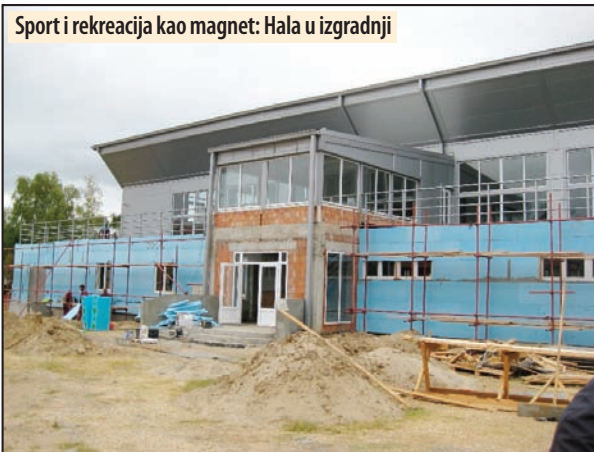
Sport i rekreacija kao magnet: Hala u izgradnji

- Lokalna samouprava investirala je određena sredstva u unapređenje i tehničke kapacitete naših sportskih objekata. U procesu predlaganja i donošenja budžeta za 2019. godinu izvršena je procena potreba korišćenja ovog objekta u Gimnaziji u Velikom Gradištu, gde su se srednjoškolski izjasnili da su im potrebna sedišta, jer fizičko vaspitanje, pored hale, imaju i ovde, a poligon koriste i u rekreativne svrhe, rekao je direktor Sportskog centra, Saša Branković, o ulaganjima u poligon malih sportova.