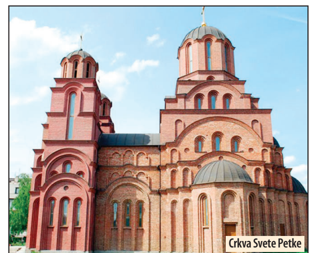
Crkva Svete Petke