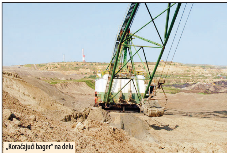
„Koračajući bager“ na delu

- Ovim bagerima rade se mnogi poslovi. Skidaju jalovinu neposredno iz-