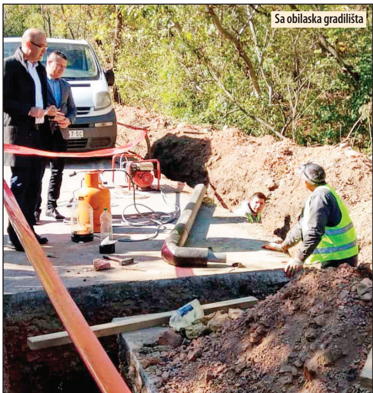
Sa obilaska gradilišta