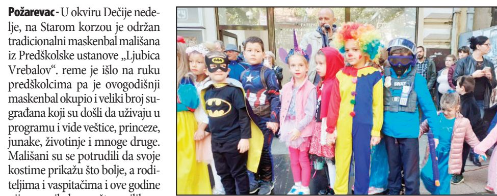
Opština Veliko Gradište

Požarevac - U okviru Dečije nedelje, na Starom korzou je održan tradicionalni maskenbal mališana iz Predškolske ustanove „Ljubica Vrebalov“, reme je išlo na ruku predškolicima pa je ovogodišnji maskenbal okupio i veliki broj sugrađana koji su došli da uživaju u programu i vide večiste, princeze, junake, životinje i mnoge druge. Mališani su se potrudili da svoje kostime prikažu što bolje, a roditeljima i vaspitačima i ove godine nije manjkalo mašte prilikom osmišljavanja istih. Direktorica PU „Ljubica Vrebalov“, Tanja Lončar, je rekla da su u vrtićima u okviru Dečije nedelje organizovane raznovrsne aktivnosti za decu.