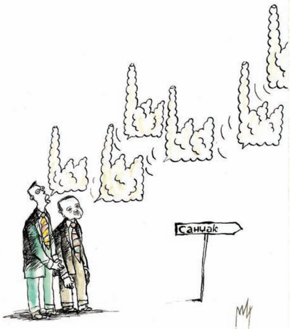
Ilustracija: M. Perlek