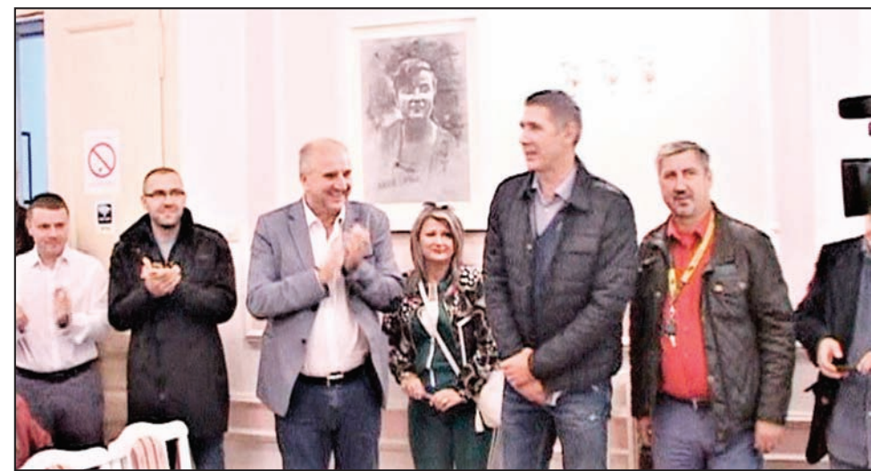
Opština Veliko Gradište

Veliko Gradište - Ponosni Gradištanci su, uz predsednika opštine Veliko Gradište Dragana Milića, svečano dočekali proslavljenog selektora odbojkaške reprezentacije Srbije Slobodana Bobu Kovača poredom iz ove varošice, nakon pobeđe reprezentacije na Evropskom prvenstvu. Na svečanom prijemu u sali Skupštine opštine okupili su se gradski zvaničnici, sportski radnici kao i svi ljubitelji sporta i odbojke koja je ime ovog grada pronela širom sveta.