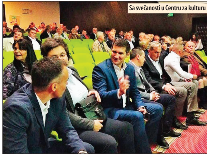
Sa svečanosti u Centru za kulturu