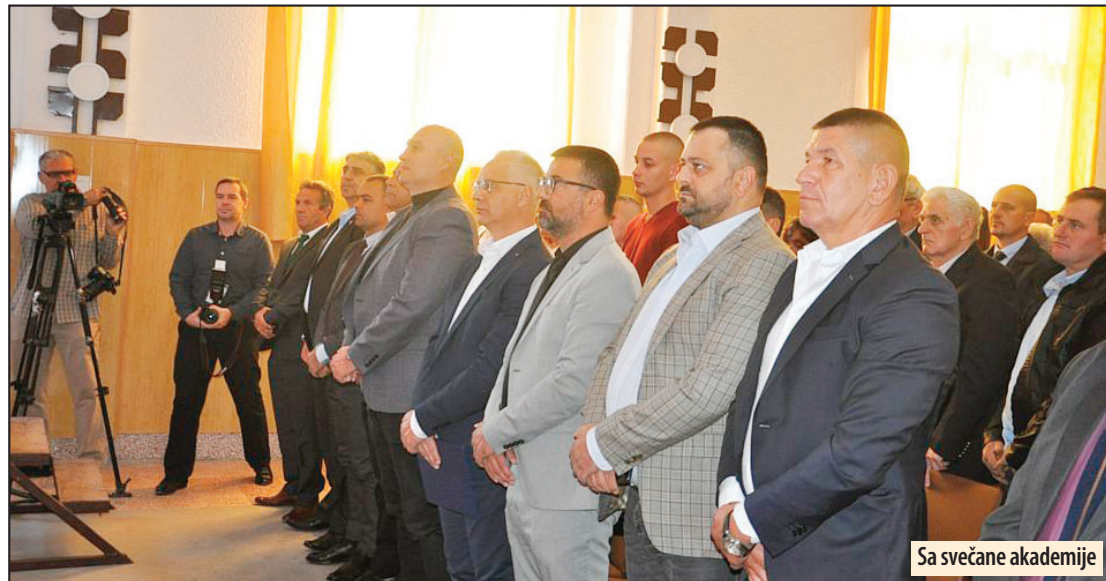
Sa svečane akademije