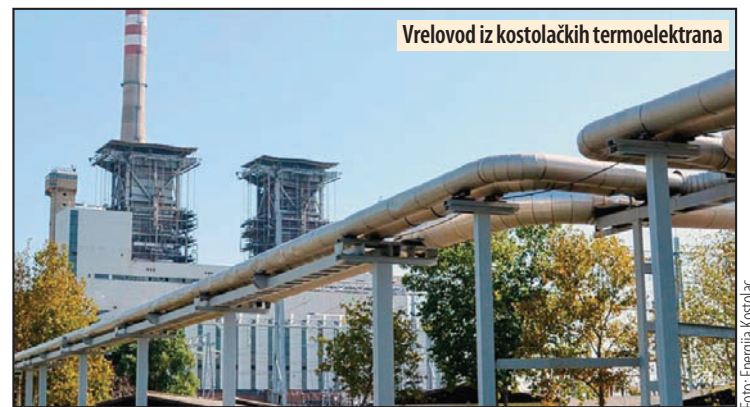
Vrelovod iz kostolačkih termoelektrana