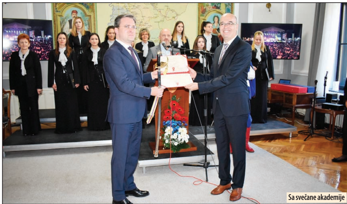
Sa svečane akademije

- Sastali smo se danas da, najpre ovim skupom, a potom i polaganjem venaca na spomen obeležja i grobove, odužimo deo duga našim precima. Precima, ali i saveznicima koji su svojim životom, ili nekom drugom žrtvom koju su podneli, doprineli oslobođenju Grada Požarevca u Prvom i u Drugom svetskom ratu. Da, mi smo im dužni i te dugove, ma koliko im vraćali, prenećemo i na generacije koje dolaze posle nas jer smo od njih dobili nešto najdragocenije - slobodu. Kaže se da nju čovek najviše ceni kada je izgubi, a mi Srbi smo slobodu toliko puta gubili i po-