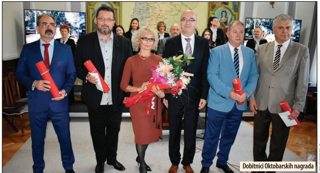
Dobitnici Oktobarskih nagrada