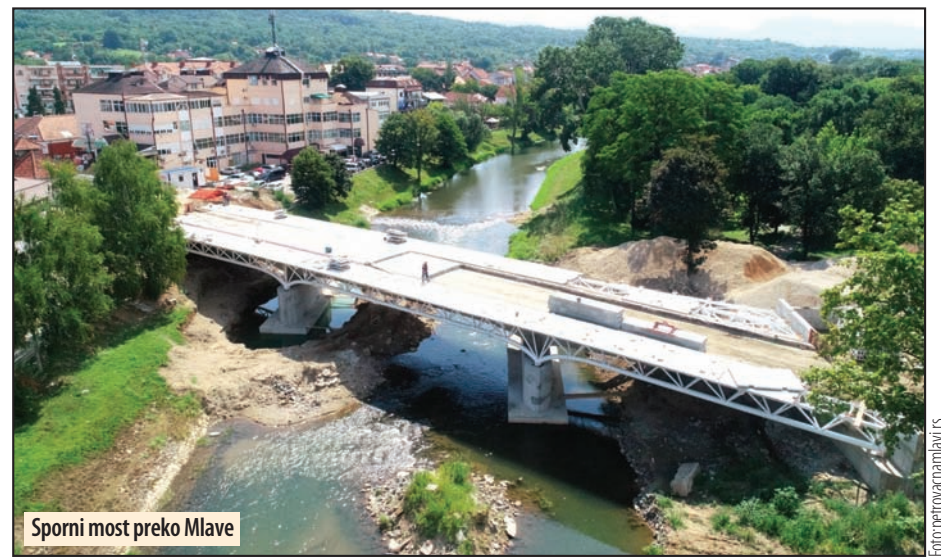
Sporni most preko Mlave

vanje je izvršeno 3. oktobar. Izveštaj o ispitivanju biće kompletiran i predat izvođaču radova. Izvođač će to dostaviti Nadzornom organu i Investitoru u skladu sa odredbama Ugovora o izvođenju radova. Prema preliminarnim informacijama od strane vršioca ispitivanja na licu mesta, rezultati su u skladu sa zahtevima projektne doku-