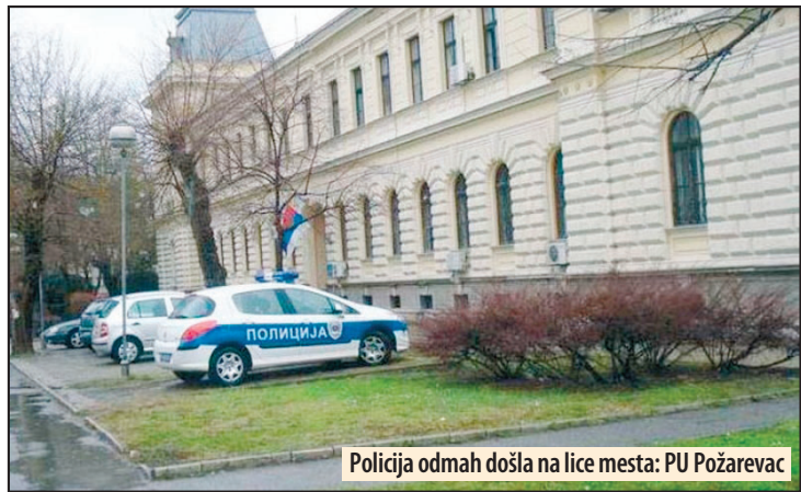
Policija odmah došla na lice mesta: PU Požarevac

Petrovacna Mlavi - Telo Marka Petkovića (39) iz Smedereva, čiji je nestanak prijavljen početkom ovog meseca, pronađeno je obešeno na jednom drvetu u šumi u blizini Petrovca na Mlavi. U subotu, 12. oktobra duboko u šumi drvoseče koji su sekli drva ugledali su telo čoveka kako visi na grani jednog drveta. O tome su odmah obavestili policiju koja je došla na lice mesta i napravila uviđaj.