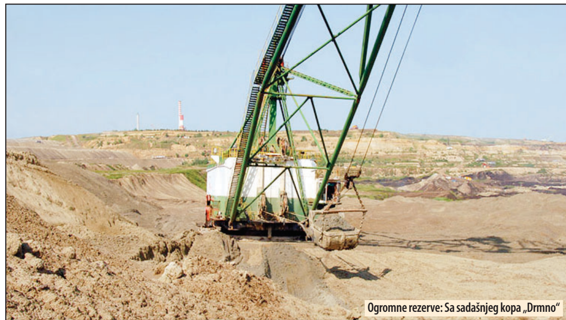
Ogromne rezerve: Sa sadašnjeg kopa „Drmno“

Osim što će EPS dobiti moderan i efikasan blok, kaže Grčić, on će ispu-