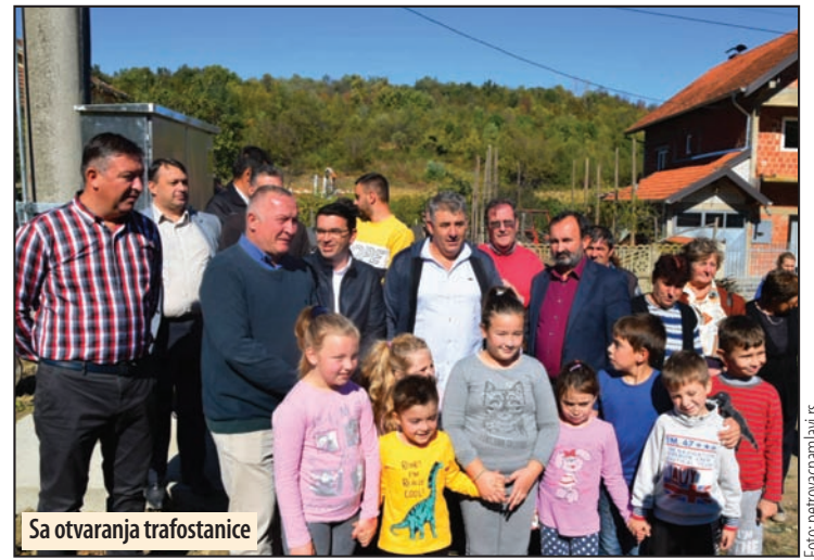
Sa otvaranja trafostanice