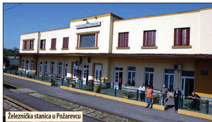
Železnička stanica u Požarevcu

Požarevac - „Srbija Voz“ a. d. obaveštava korisnike svojih usluga da će, zbog infrastrukturnih radova na delu pruge između stanica Požarevac i Majdanpek, od 21. do 31. oktobra, od 6 do 18 sati, doći do izmene organizacije saobraćaja vozova za prevoz putnika. Vozovi koji iz Zaječara za Požarevac polaze u 6:22 i 15:04, kao i vozovi iz Požarevca za Zaječar u 6:15 i 15:08 časova, saobraćaću do i od Majdanpeka. Za putnike ovih vozova biće organizovan autobuski prevoz na relaciji Majdanpek - Požarevac - Majdanpek. B. D.