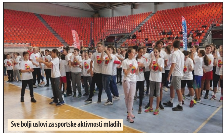
Sve bolji uslovi za sportske aktivnosti mladih