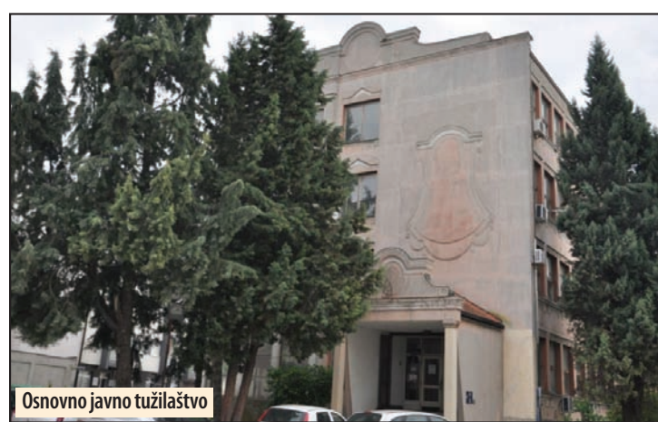
Osnovno javno tužilaštvo