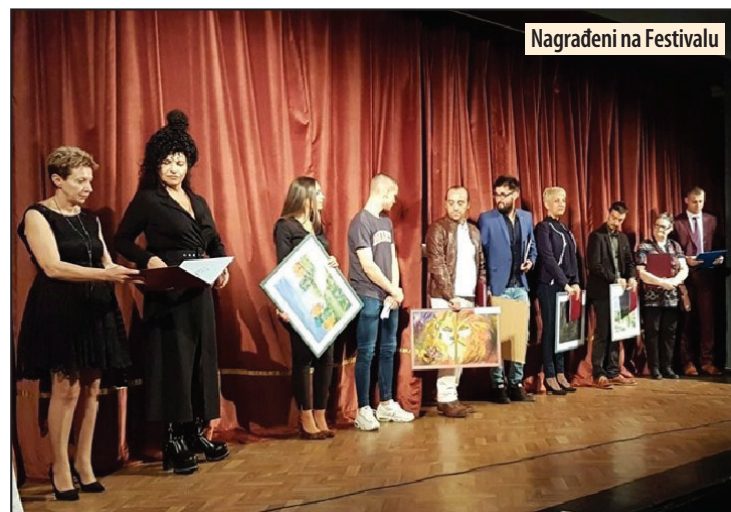
Nagrađeni na Festivalu