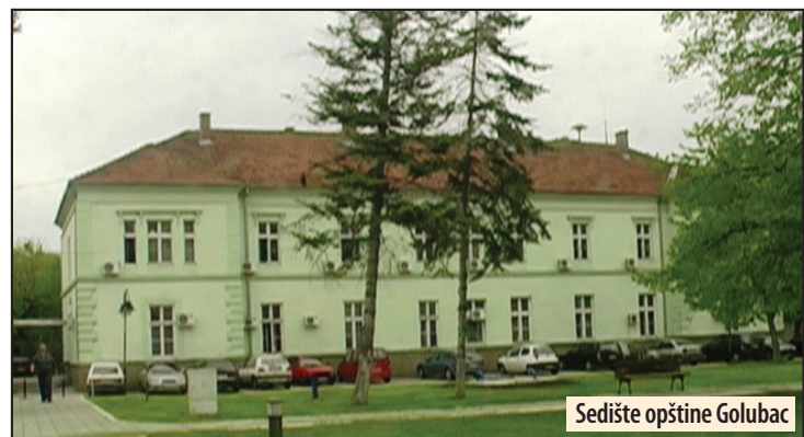
Sedište opštine Golubac