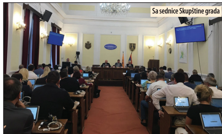
Sa sednice Skupštine grada

Lokalna samouprava Požarevca je u prethodnom periodu uložila velike napore u poboljšanje putne i komunal-