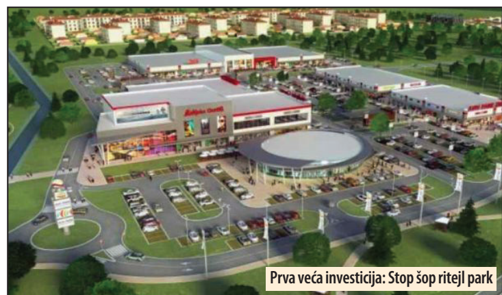
Prva veća investicija: Stop šop ritejl park