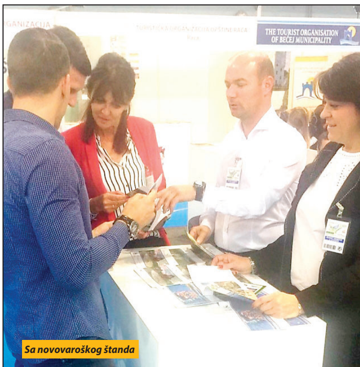
Sa novovaroškog štanda

Do kraja godine moguće potpisivanje ugovora o rekonstrukciji TE Pljevlja