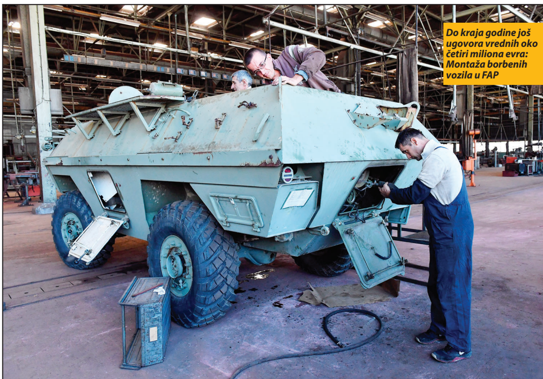
Do kraja godine još ugovora vrednih oko četiri miliona evra: Montaža borbenih vozila u FAP

Radnici pribojske fabrike radiće na poslovima modernizacije borbenog oklopnog vozila Vojske Srbije