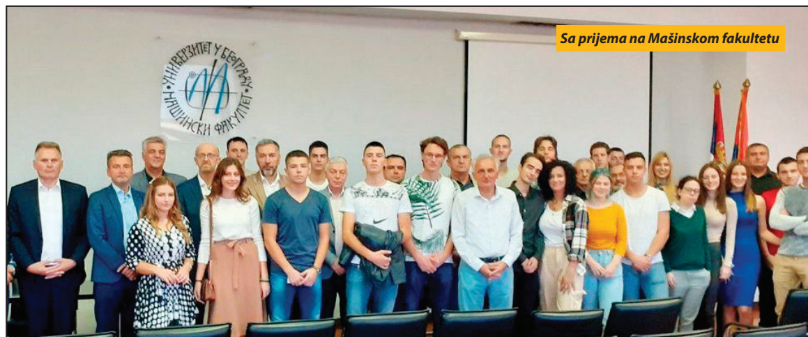
Sa prijema na Mašinskom fakultetu

Lokalna samouprava je obezbedila značajan iznos sredstava za prevoz učenika, a ovih dana biće raspisana javna nabavka za pet putnih pravaca. U rešavanje ovog problema uključila se Vlada Republike Srbije, rekao je Kurbegović i izrazio žaljenje što ovaj značajan jubilej nije upriličen u fiskulturnoj sali, koja je zbog nepravilnosti prilikom izdavanja upotrebne dozvole privremeno zatvorena.