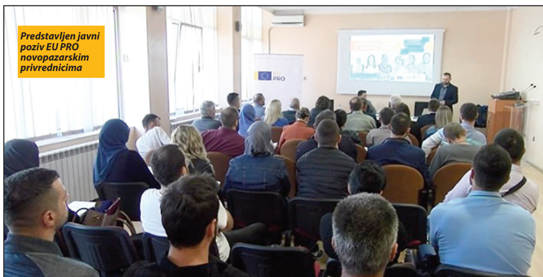
Predstavljen javni poziv EU PRO novopazarskim privrednicima