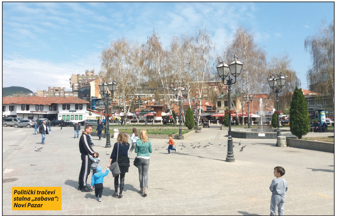
Politički tračevi stalna „zabava“: Novi Pazar

Novi Pazar - Kako se približavaju izbori, tako se u priču uvodi sve što bi moglo da namakne koji glas više u biračkom telu, a po malo „preporučiti“ jakom koalicijom partneru. U igri je i nedavna poseta Srbiji predsednika Turske Redžepa Taipa Erdogana. Uoči njegovog dolaska, spekuliralo se da će,