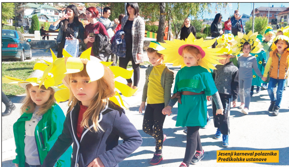
Jesenji karneval polaznika Predškolske ustanove

U OŠ „Živko Ljujić“ su organizovane zanimljive zabavno-edukativne aktivnosti. Tokom obeležavanja manifestacije, koja se ove godine proslavlja pod sloganom „Da pravo svako dete živi lako“, u ovoj obrazovnoj ustanovi priređeni su sastanci učeničkog parlamenta, medijska promocija „Dečje nedelje“, poseta opštinskim i skupštinskim čelnicima, foto izložba i oslikavanje murala u okviru školskog dvorišta, on-lajn kampanja pod nazivom „Imam pravo da...“ Po motivi-