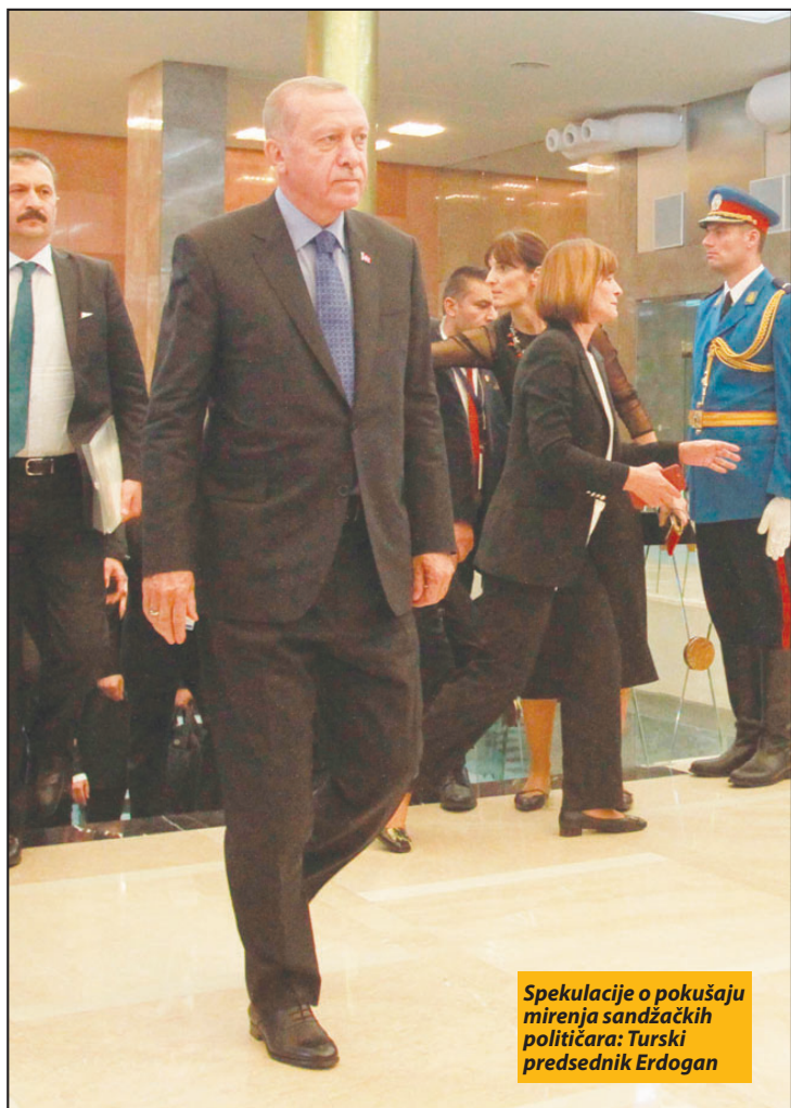
Spekulacije o pokušaju mirenja sandžackih političara: Turski predsjednik Erdogan