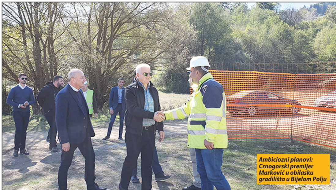
Ambiciozni planovi: Crnogorski premijer Marković u obilasku gradilišta u Bijelom Polju

- Za nešto više od godinu dana imamo impresivan rezultat. Kompanija Novi Volvox, koja je dobila projekat izgradnje žičare do Đalovića pećine, radi odličan posao u teškim uslovima. Nijesam ni očekivao da će do kraja godine ovdje biti postavljeno sedam stubova žičare u ovakvim uslovima. Dakle, na ovom projektu imamo odlične izvođače i u Novom Volvoxu i naravno u Crnogoraputu - rekao je premijer na gradilištu. Predsjednik Vlade je obišao i radove na trafostanici koja je dio nove elektroenergetske strukture za snabdijevanje strujom žičare i turističkog kompleksa pećine i provezao se putem od Bistrice ka Manastiru Podvrh gdje će biti podnožje žičare.