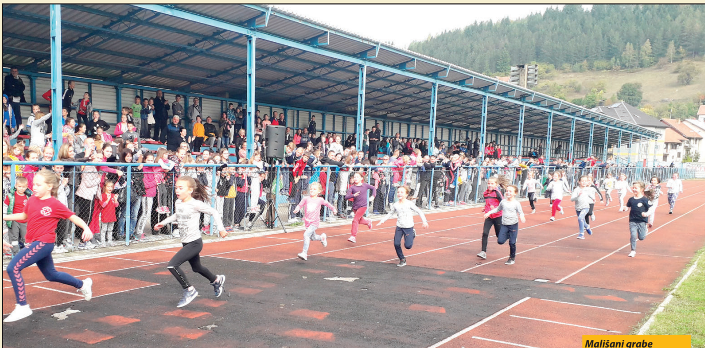
Mališani grabe ka cilju: Sa trka u Novoj Varoši i Priboju

Nova Varoš, Priboj - U organizaciji lokalnih ogranaka Crvenog krsta u Novoj Varoši i Priboju je prošlog vikenda održano takmičenje osnivača u atletici „Trka za srećnije detinjstvo“. Na novovaroškom stadionu „Branoševac“, 16-tu godinu za redom, okupilo se oko 250 takmičara - polaznika iz svih šest odnornih škola sa teritorije opštine.