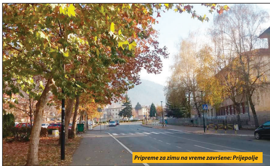
Pripreme za zimu na vreme završene: Prijepolje

Budući planovi podrazumevaju izgradnju centralne kotlarnice kod zgrade Gimnazije, koja će