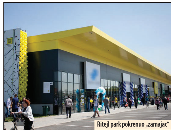
Ritejl park pokrenuo „zamajac“

Spasović je ovom prilikom istakao da su u prethodne tri godine došli novi investitori i velike kompanije kao što je Koka kola. Otvoren je ritejl park Stop šop koji se sada već širi i ima preko 10.000 kvadrata i nekoliko stotina radnika, Ariva je otvorila novu modernu garažu, u industrijskoj zoni lokalni investitor gradi proizvodno-prodajni pogon na 11.000 kvadrata, očekuje se otvaranje fabrike konditorskih proizvoda, fabrika za proizvodnju kafe, multinacionalna kompanija za reciklažu plastike već ima 60 zaposlenih a uskoro, čim startuje sa proizvodnjom imaće 300 radnika i reč je o višemilionskoj investiciji u evrima. Bambi je proširio kapacitete i imao je odličnog partnera u gradu, a od pre nekoliko meseci Koka kola je preuzela Bambi što otvara tržišna vrata celog sveta. Sve ovo su pratile investicije u infrastrukturu preko pet milijardi evra. Z. V.