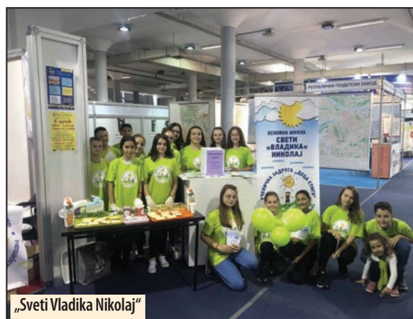
„Sveti Vladika Nikolaj“

„Most u centru“, „most kod bolnice“, „glavni most“, naredne godine puni 80 godina postojanja! 25. juna 1939. godine otvoren je i u saobraćaj svečano pušten prvi armirano-betonski most u ovom delu tadašnje Kraljevine Jugoslavije. Tada je to bio najveći graditeljski poduhvat u istoriji opštine Petrovac na Mlavi i ovog kraja.