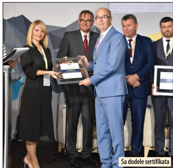
Sa dodele sertifikata

„Požarevac je u proces sertifikacije ušao sa samo 30 odsto poena, a sertifikaciju završio je sa više od 80 procenata postignutih poena. Ovakav rezultat je dobijen zahvaljujući ljudskim resursima u Gradu Požarevcu koji su u rekordnom roku izneli proces sertifikacije, ali sigurno je morao da ispuni niz kriterijuma sa liste od 107 zahteva koji se odnose na unapređenje rada lokalne samouprave