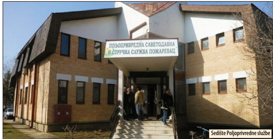
Sedište Poljoprivredne službe

pomenutim gazdinstvima u ukupnom iznosu od oko 2.254.000 dinara na račune kod poslovnih banaka. Vlasnici gazdinstava su taj novac podigli sa svojih računa i direktno, ili