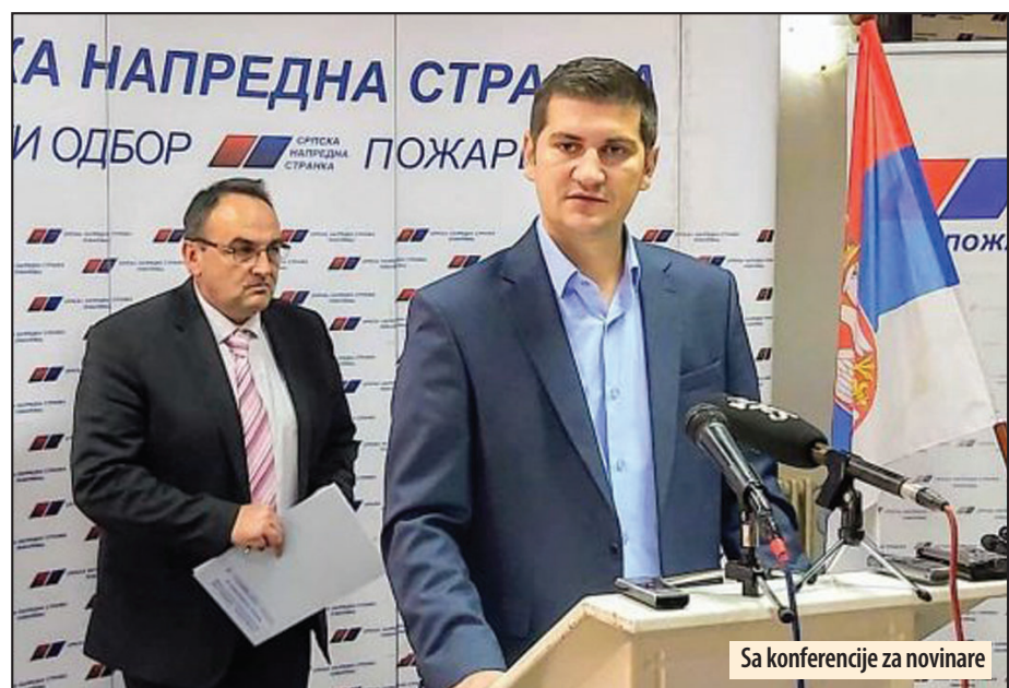
Sa konferencije za novinare

miliona dinara a iduće godine biće toplificiran i drugi deo sela. Sada se ušlo u sistem da se jedne godine rade projekti a naredne se izvode radovi rekao je Dačić i dodao da se za Moravsku ulicu sa bočnim ulicama i Ratarsku do Zmaj Jovine ulice izdvojilo 320 miliona dinara. Urađen je projekat predpumpne stanice podizućeg pritiska Jeremino polje kako bi se omogućilo dalje širenje toplifikacione mreže ka višinskim zonama i dodatno stabilizovalo grejanje grada. Vrednost ove investicije ukoliko se