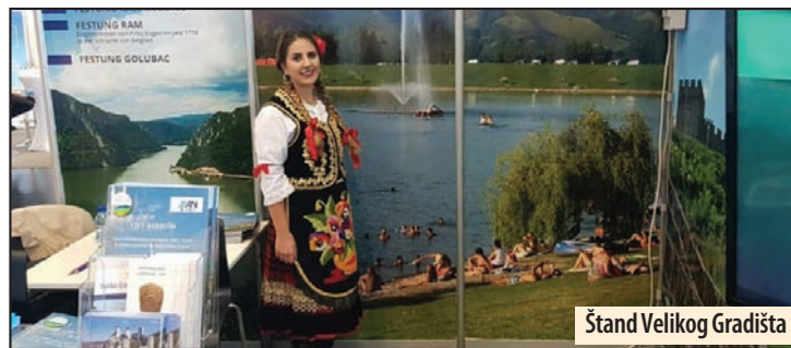
Štand Velikog Gradišta

Veliko Gradište - Na sajmu za seniore u Beču, Turistička organizacija opštine Veliko Gradište predstavila je svoju bogatu ponudu, u saradnji sa turističkom agencijom Pinkum. Na štandu je prezentovan katalog agencije sa turističkom rutom Istočne Srbije koja traje nedelju dana, i koja se već godinu dana realizuje kroz dolazak austrijskih državljana u stalnim turama od maja do oktobra.