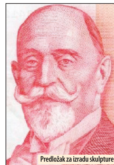
Predložak za izradu skulpture