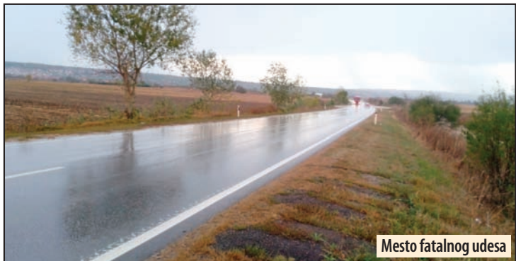
Mesto fatalnog udesa

Teška saobraćajna nesreća između nedelje i ponedeljka