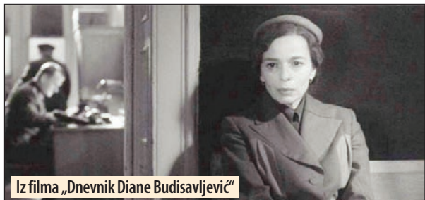
Iz filma „Dnevnik Diane Budisavljević“