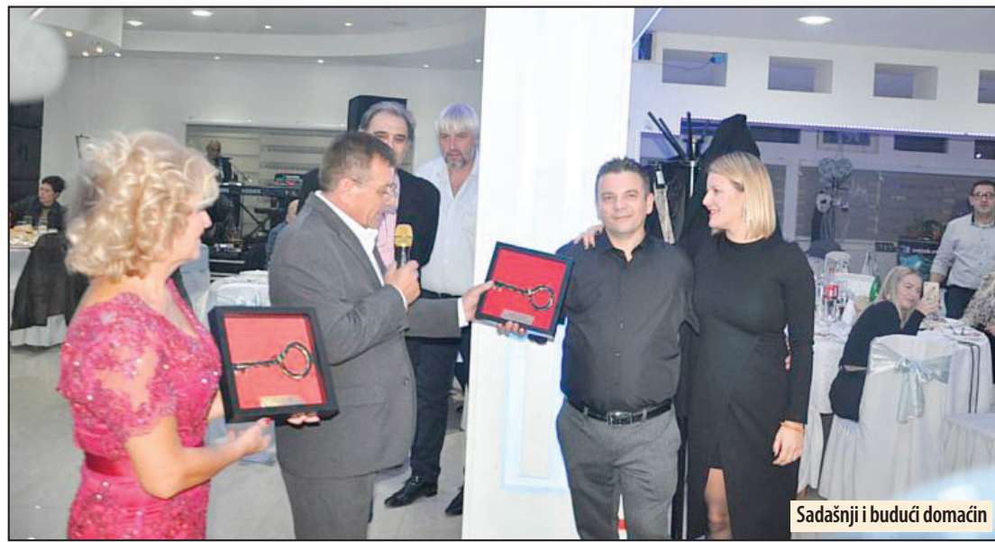
Sadašnji i budući domaćin