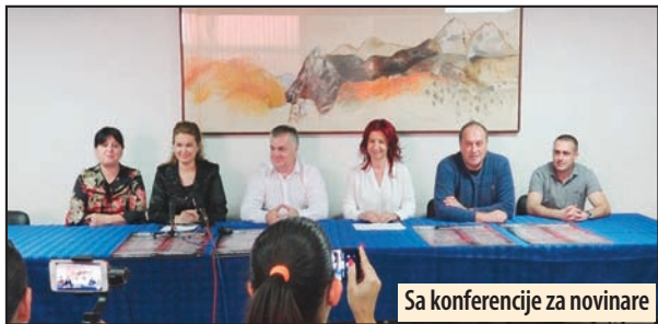
Sa konferencije za novinare