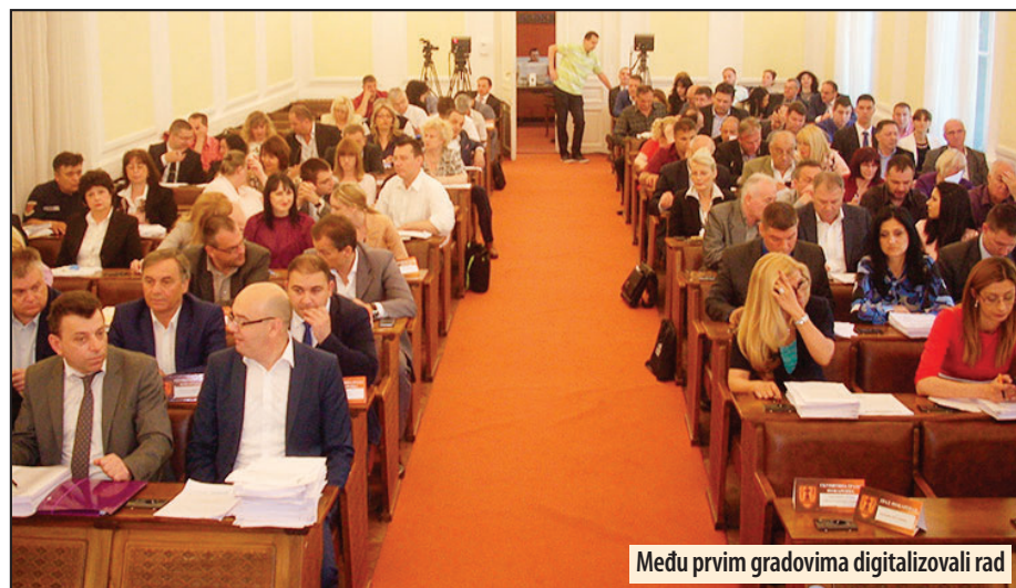
Među prvim gradovima digitalizovali rad

- Kao predsednik Skupštine posebno bih istakao da vodim Skupštinu u kojoj Srpska napredna stranka ima apsolutnu većinu odbornika, za koje smo dobili poverenje građana Požarevca, pre svega zavaljujući rezultatima koje je ostvarila Srpska napredna stranka predvođena predsednikom Aleksandrom Vučićem i programom SNS Po-