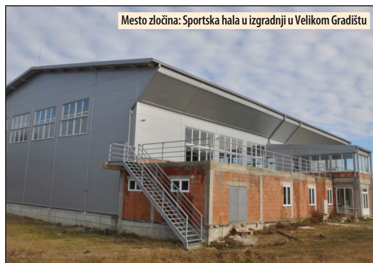
Mesto zločina: Sportska hala u izgradnji u Velikom Gradištu