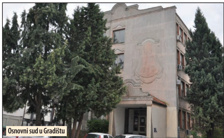
Osnovni sud u Gradištu

Veliko Gradište - Osnovni sud pravosnažno je osudio Ratomira Veselinovića (22) iz Velikog Gradišta na pet meseci zatvora, zbog krivičnog dela nasilničko ponašanje. Ova presuda doneta je na osnovu sporazuma o priznavanju krivice, koju je optuženi sklopio sa Osnovnim javnim tužilaštvom. Njemu je izrečena i mera zabrane prilaska oštećenom Nenadu Novakoviću (28) iz Velikog Gradišta, a dužan je i da Osnovnom javnom tužilaštvu plati troškove u iznosu od 13.125 dinara. Napad na oštećenog de-