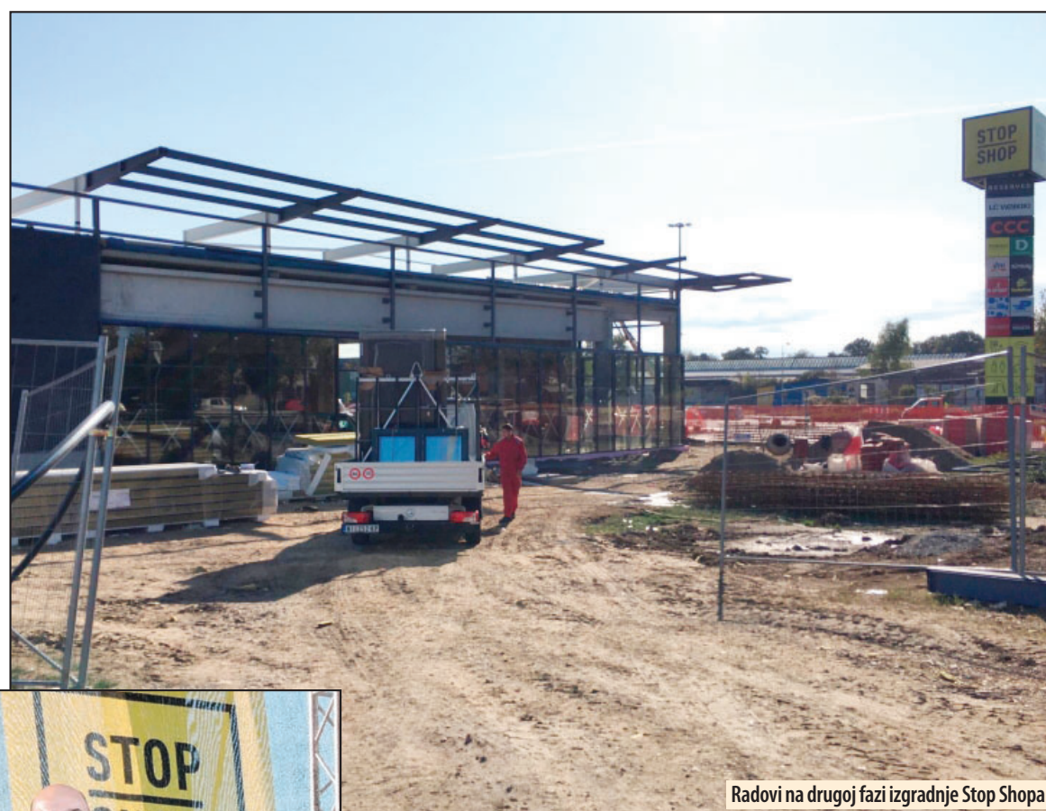
Radovi na drugoj fazi izgradnje Stop Shopa

Reč je objektu od 2.500 kvadrata a, prema planu, polovinom novembra će biti završeni svi grubi radovi na objektu. Završetak posla i otvaranje novog objekta očekuju se za nešto više od šest meseci. Kako Požarevljani sa nestrpljenjem očekuju vesti o tome koji novi brend dolazi ovaj grad, lokalni Hit radio uspeo je nezvanično da sazna kako će to biti čuvena firma Lidl, ali ovaj trgovinski lanac još uvek se nije obratio javnosti sa informacijom da li zaista dolazi u varoš pod Čačalicom. Međutim, ono što je izvesno