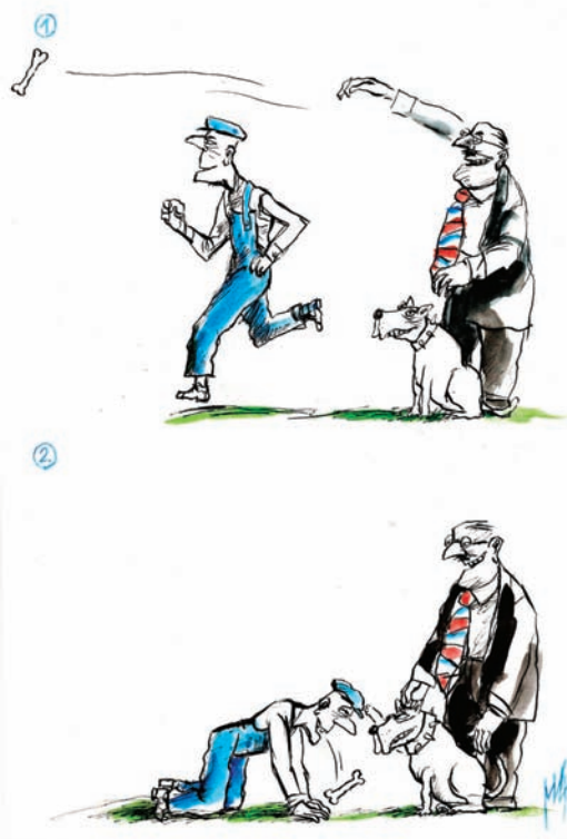
Ilustracija: M. Perlek