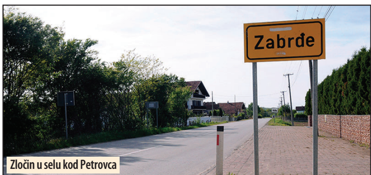
Zločin u selu kod Petrovca

svađe i tuče, nožem zadao više uboda tridesetjednogodišnjem mladiću nanevši mu teške telesne povrede. Povređeni muškarac zbrinut je u petrovačkoj bolnici. Po nalogu Osnovnog javnog tužilaštva u Petrovcu na Mlavi, osumnjičenom je određeno zadržavanje do 48 sati i, uz krivičnu prijavu, biće priveden tužiocu. M. V.