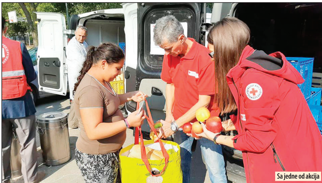
Sa jedne od akcija

opredeljena su sredstva u ukupnom iznosu od 2.180.618 dinara, za uslugu servis pomoći u kući za stara lica i osobe sa invaliditetom trogodišnjim ugovorom zaključenim do 31.12.2020. godine, iz budžeta grada obezbeđena su sredstva u ukupnom iznosu od 15.296.740 dinara za finansiranje rada 10 gerontodomaćica. Ugovorom zaključenim za period od 1.8.2019. godine do 31.12.2020. godine, iz budžeta grada obezbeđena su dodatna sredstva u ukupnom iznosu od 3.960.830 za