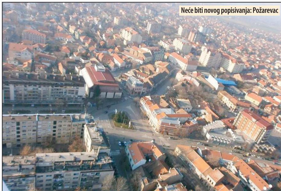
Neće biti novog popisivanja: Požarevac