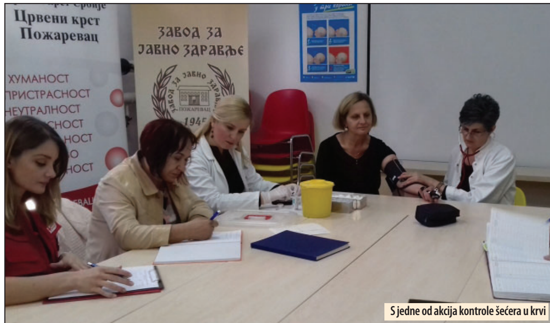
Sjedne od akcija kontrole šećera u krvi

Dijabetes tipa 2 se javlja kod neefikasne upotrebe postojećeg insulina, odnosno telo stvara insulin, ali ga neefikasno upotrebljava i on se uglavnom javlja kao posledica viška kilograma, fizičke neaktivnosti i uglavnom se javlja kod starije populacije, ali je usled loših navika i načina života ovaj tip počeo sve više da se javlja i kod dece.