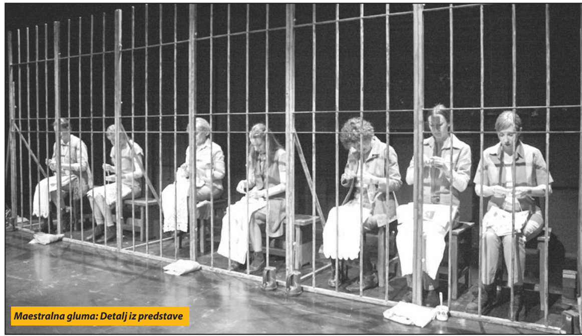
Maestralna gluma: Detalj iz predstave