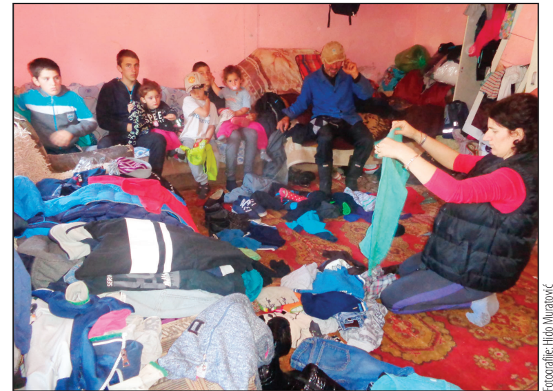
Bandere konačno stigle do Jelića, a stiže i pomoć u garderobi

Deo novca od prodatih rukotvorina odvajao je za siromašne, kada je i prvi put video, kako kaže, zaboravljene ljude. - Primito sam da su ih najmiliji zaboravili, ali bogami i država. Ja sam tu da potaknem dobrotu koja se izgubila, da