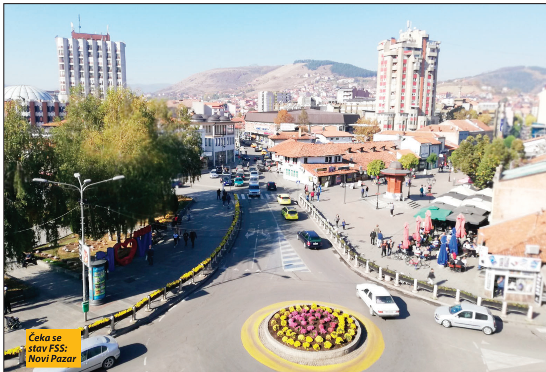
Čeka se stav FSS: Novi Pazar