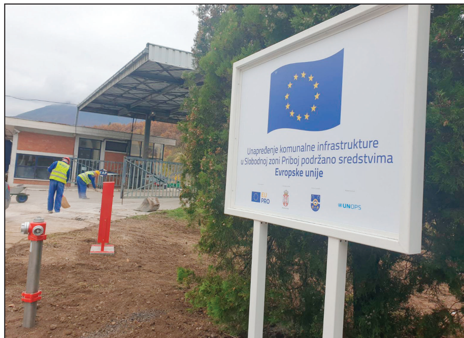
Unapređenje komunalne infrastrukture u Slobodnoj zoni Priboj

Priboj - U industrijskoj zoni u Priboju završeni su radovi na rekonstrukciji postojeće i izgradnji nove vodovodne i hidrantske mreže što je dodatno unapredilo uslove za poslovanje i privlačenje novih investitora. Radovi koje je finansijski podržala Evropska unija (EU) preko programa EU PRO sa 280.000 evra obezbedili su stabilno snabdevanje vodom i protivpožarnu zaštitu u zoni u kojoj trenutno posluje deset kompanija, navodi se u saopštenju.