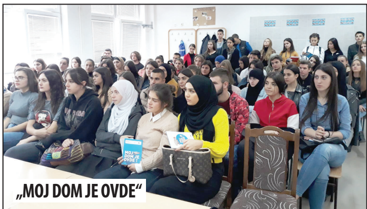
„MOJ DOM JE OVDE“

NOVI PAZAR // Nevladina organizacija iz Novog Pazara Urban-in održala je još dve radionice u okviru projekta „Moj dom je ovde“. Ovoga puta u Medicinskoj školi. Više od 100 učenika i učenica Medicinske škole učestvovalo je u projektu. S. D.