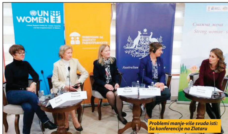
Problemi manje-više svuda isti: Sa konferencije na Zlataru

Na skupu, kome su prisustvovala i ambasadorica Australije za Srbiju, Crnu Goru i Makedoniju Rut Stjuart, zamenica ambasadora Velike Britanije u Srbiji Rebeka Fabricio i predstavnic