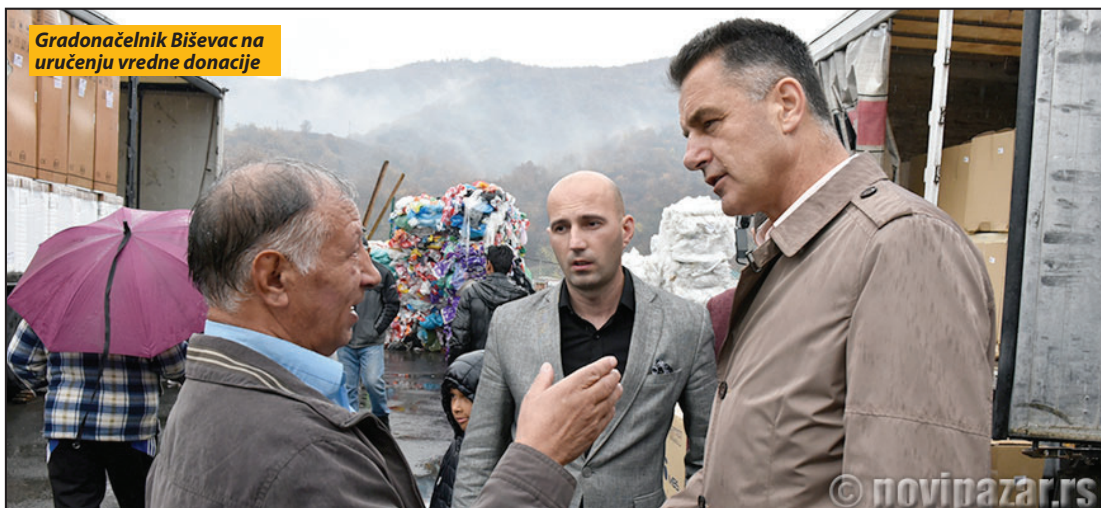
Gradonačelnik Biševac na uručivanju vredne donacije

Novi Pazar - U okviru poslednje faze projekta opremanja romskih domaćinstava, za 108 porodica obezbeđena je bela tehnika. Projekat vredan 50 000 evra realizuju Evropska unija preko Kancelarije ujedinjenih nacija za projektne usluge (UNOPS), Grad Novi Pazar i Muslimansko humanitarno društvo Merhamet Sandžak. Za svako projektom obuhvaćeno domaćinstvo obezbeđeni su frižider, šporet za ogrev i mašina za pranje veša.