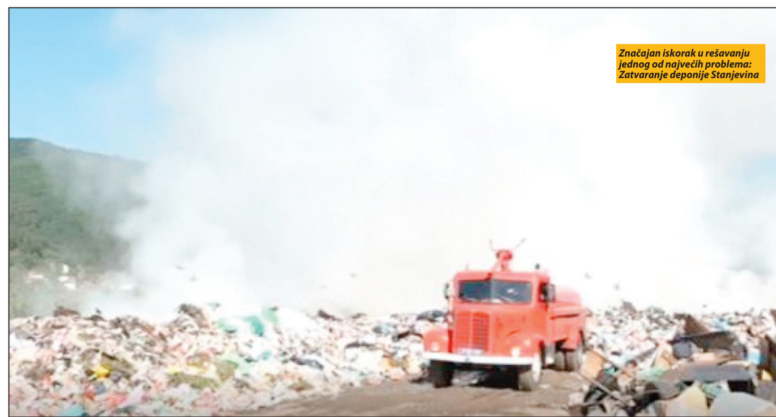
Značajan iskorak u rešavanju jednog od najvećih problema: Zatvaranje deponije Stanjevina

Ovo je značajan iskorak u rešavanju jednog od najvećih problema, kaže predsednik opštine Dragoljub Zindović, podsećajući da je Vlada Srbije preuzela sve ingerencije na rešavanju pitanja zatvara-