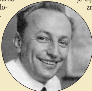
Miodrag Bulatović (1930 - 1991)