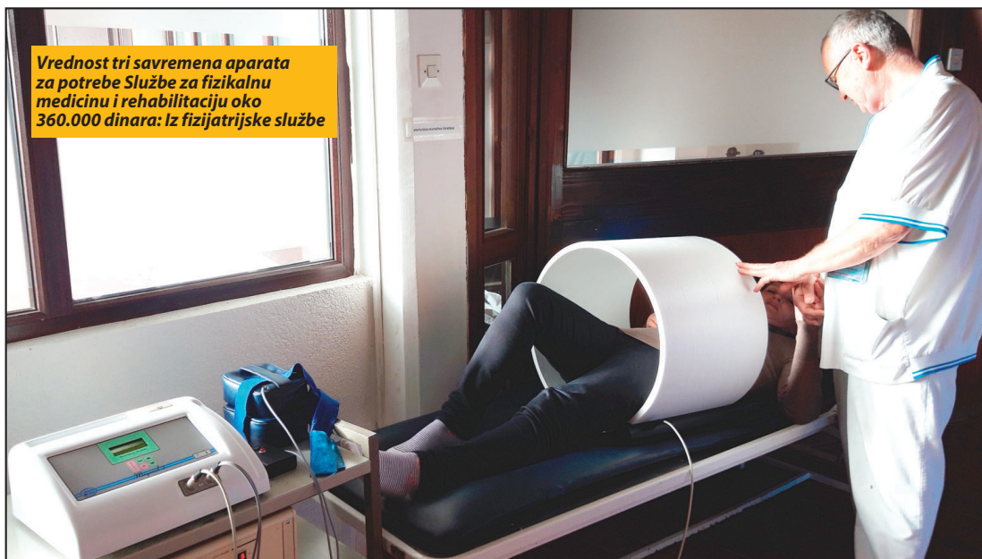
Vrednost tri savremena aparata za potrebe Službe za fizikalnu medicinu i rehabilitaciju oko 360.000 dinara: iz fizijatrijske službe

Berane - Saradnja Regionalnog biznis centra, Univerziteta Saksion iz Enshede i NVO „CRIL“ iz Podgorice nastavljena je studijskom posjetom grupe studenata iz Holandije Beranama. Posjeta je dio redovnog studijskog programa tokom kojeg studenti rade na konkretnim zadacima ispitivanja tržišta u saradnji sa preduzećima u inostranstvu. Tokom boravka u Beranama, studenti su radili na konkretnim zadacima, kao što je ispitivanje mogućnosti izlaska na evropsko tržište i unapređenje proizvodnje za Beranska preduzeća MIT, „Intertehna - sirara Stanković“ i Desetka.