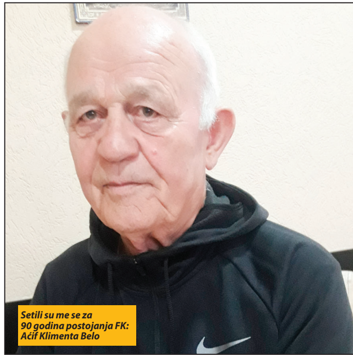
Setili su me se za 90 godina postojanja FK Aćif Klimenta Belo