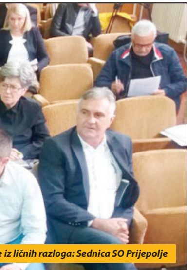
iz ličnih razloga: Sednica SO Prijepolje