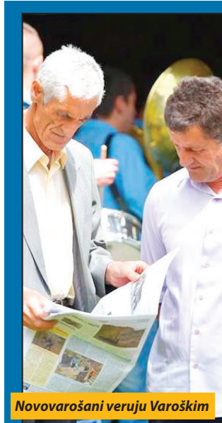
Novovarošani veruju Varoškim

- Za njima slede Vlada Republike Srbije i Narodna skupština sa po 22 odsto poverenja građana Nove Varoši. Na začelju ove liste su nevladine organizacije kojima veruje 12 odsto Novovarošana i političke partije sa svega šest odsto podrške. Zanimljivo je da kada se analiziraju rezultati istraživanja, dođe se do zaključka da stanovnici opštine Nova Varoš veće poverenje imaju u lokalne medije i institucije, nego u one koji funkcionišu na državnom nivou, jedan je od zaključaka u CESID-ovom istraživanju.