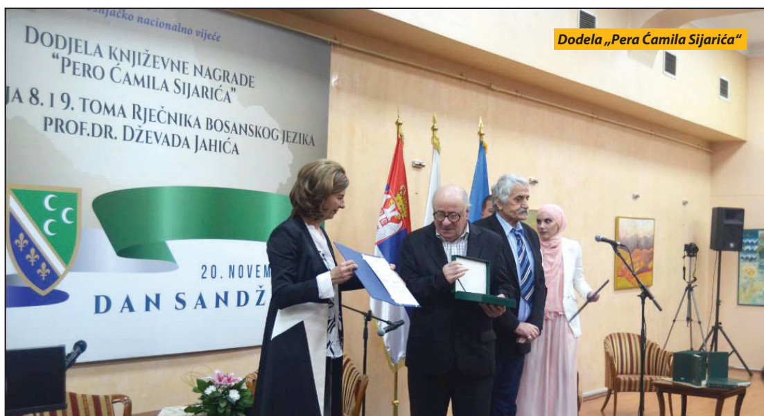
Dodela „Pera Ćamila Sijarića“