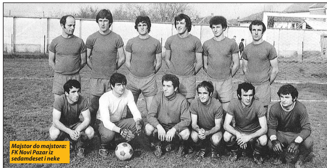
Majstor do majstora: FK Novi Pazar iz sedamdeset i neke