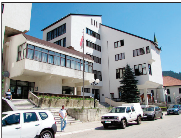
U službi građana i privrede: Zgrada Opštine Nova Varoš

Projekti su, inače, odobreni u okviru javnog poziva „Da kliknemo zajedno“. Opština Nova Varoš je na ovom konkursu aplicirala sa programom