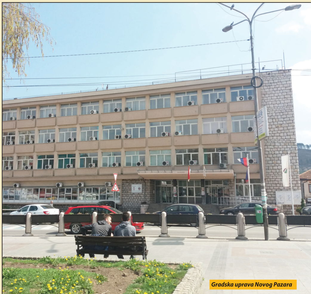
Gradska uprava Novog Pazara

ketom na zvaničnom sajtu grada, a građani anketni listić mogu popuniti i u uslužnom centru lokalne samouprave (u toku radnog vremena), kao i na štandovima postavljenim na gradskom šetalištu (kod Sebilja). S. D.