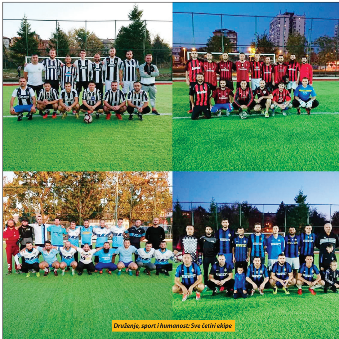
Druženje, sport i humanost: Sve četiri ekipe