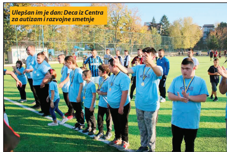
Ulepšan im je dan: Deca iz Centra za autizam i razvojne smetnje

kojoj deca u trošnoj kućici žive sa starijom nanom, kao i siročićima, dok je u poslednjem kolu prikupljeno 400 evro, taj novac završio je kod porodica slabog