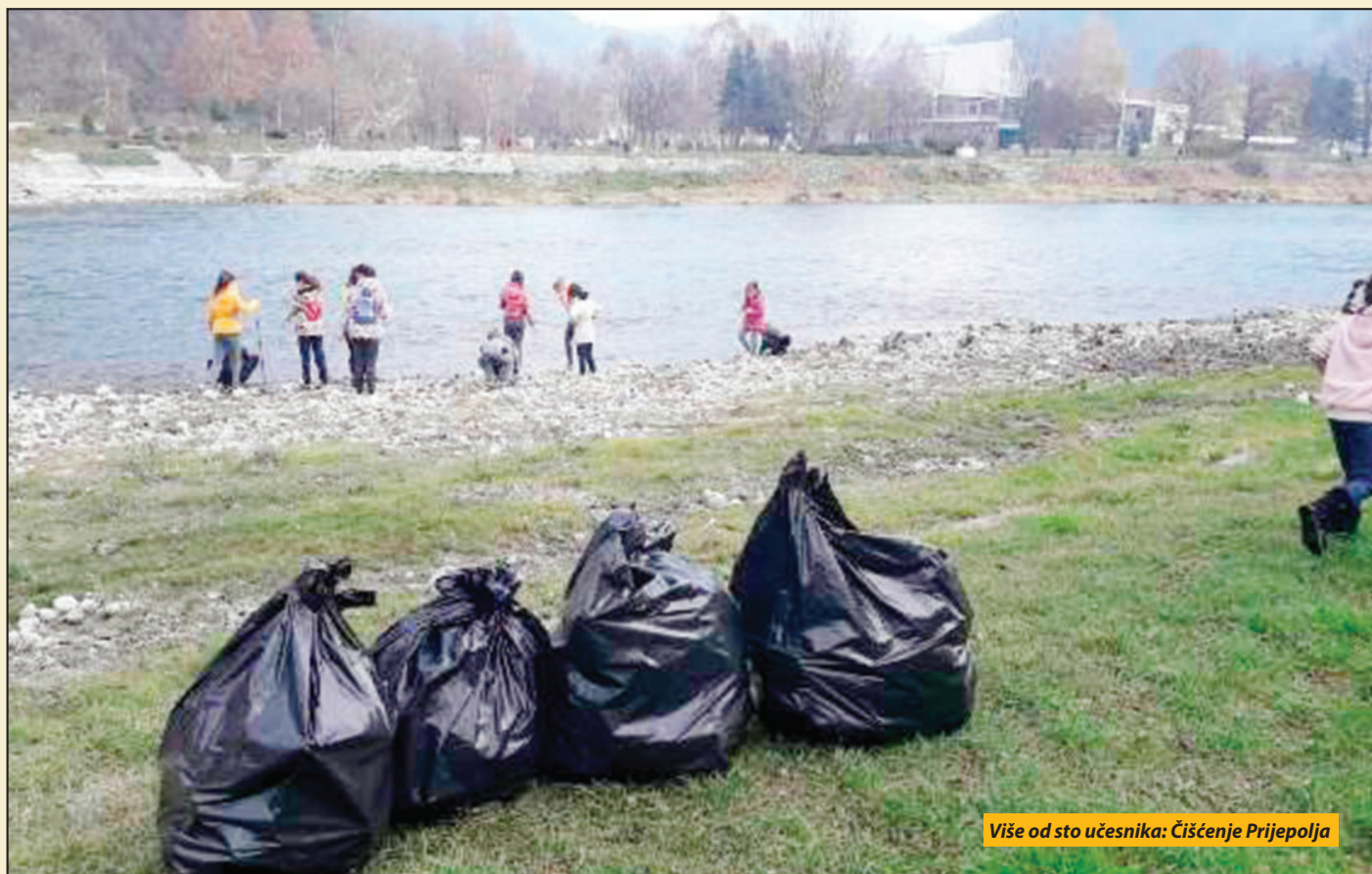
Više od sto učesnika: Čišćenje Prijepolja

Prijepolje - Kancelarija za mlade opštine Prijepolje, u saradnji sa Ekonomsko-trgovinskom školom, Mladim istraživačima Srbije, Centrom za građansko delovanje, Narodnim parlamentom i Pokretom gorana Vojvodine, realizovala je akciju čišćenja