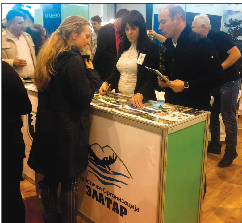
Veliko interesovanje za novogodišnje aranžmane: Sa štanda TO „Zlatar“

tako najviše upita imali za aranžmane za Novu godinu i predstojeću zimsku sezonu. Prednost su povoljne cene i zadovoljavajući kvalitet smeštaja, s tim što je Zlatar u deficitu sa objektima visoke kategorije i dečjim odmaralištima. Trenutno se raspolaze sa maksimum 1.500 ležajeva, a nedostaje nam još najmanje hiljadu kreveta u kategorizovanim objektima.