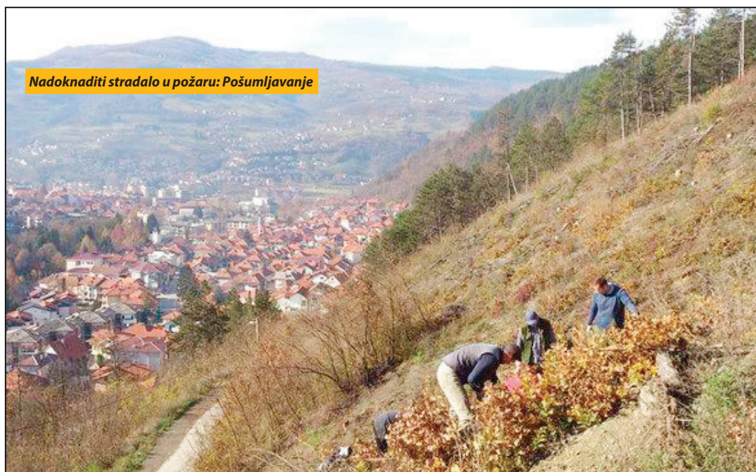
Nadoknaditi stradalo u požaru: Pošumljavanje

U fokusu promocije lokalne Turističke organizacije predstojeća zimska sezona