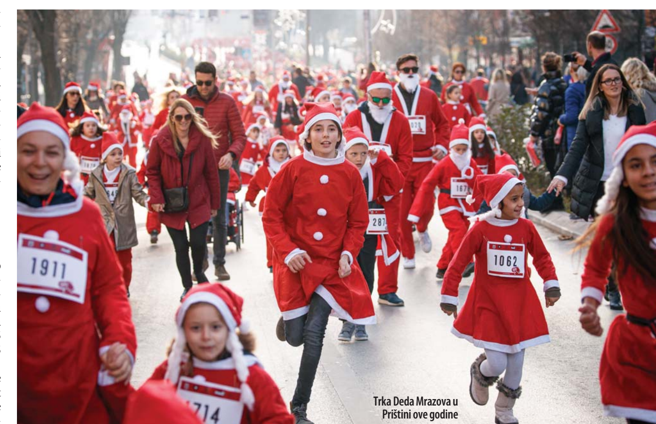
Trka Deda Mrazova u Prištini ove godine

U poslednjih 20 godina Kosovo je posetilo 34 procenta naših anketiranih, dok je 60 odsto odgovorilo da nije. Opciju „Samo prošao/la“ štikiralo je šest procenta glasača Danasove ankete. Negativnu sliku o životu na Ko-