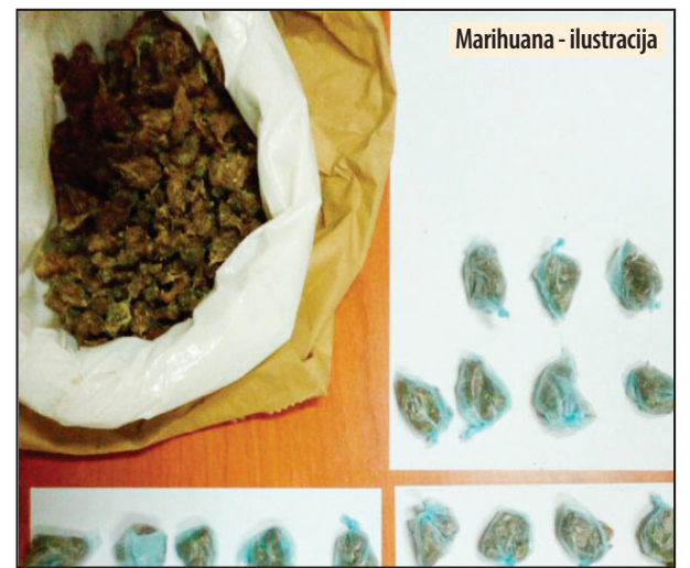
Marihuana - ilustracija