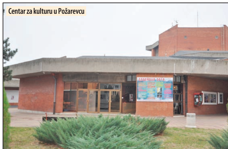
Centar za kulturu u Požarevcu

- Iako je 2019. godine bila izuzetno dinamična i uspešna, za kolektiv Centra za kulturu nema predaha, jer se pripremaju za narednu godinu. „Central-