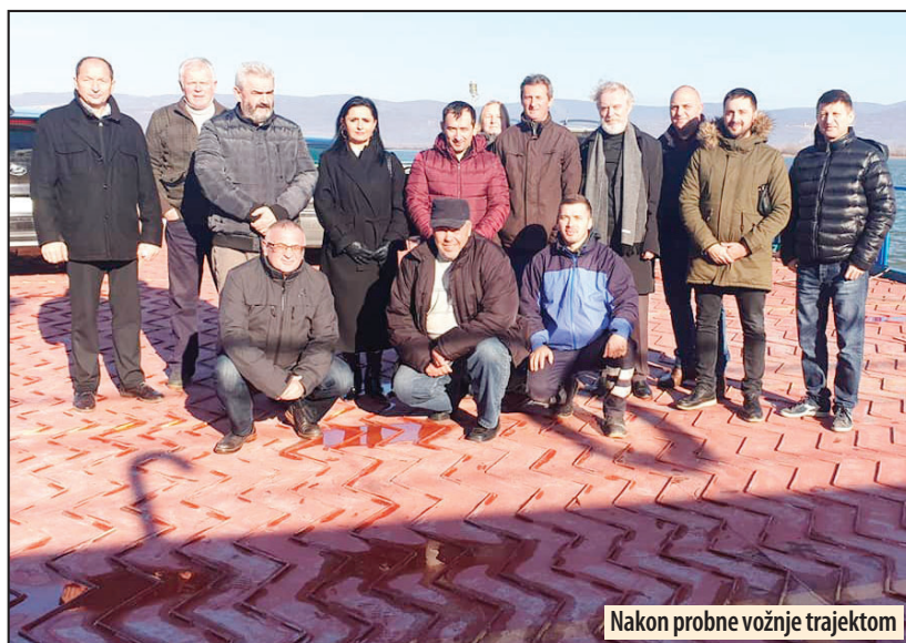
Nakon probne vožnje trajektom