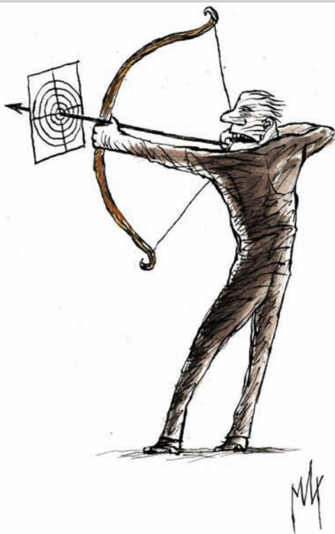
Ilustracija: M. Đerlek