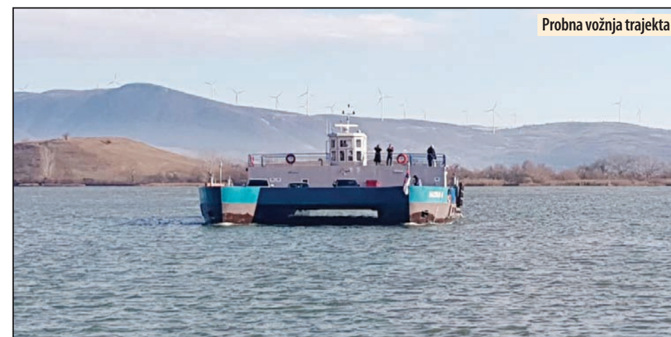
Probna vožnja trajekta

predio kvalitet života lokalne zajednice i unapredila saradnja lokalnog pograničnog stanovništva. Za ovo nerazvijeno pograni-