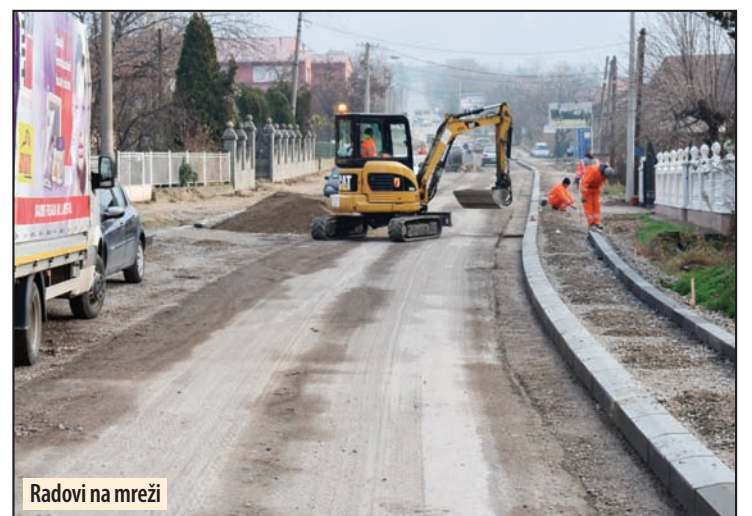
Radovi na mreži