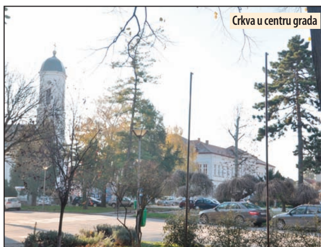
Crkva u centru grada