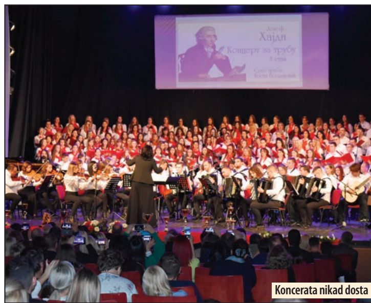
Koncerata nikad dosta

Učenici ove škole postižu zapažene uspehe na takmičenjima svih nivoa, ali i pri opusu na fakultete u zemlji i inostranstvu. Zajedno sa svojim nastavnicima, učenici ove škole imaju osamdesetak nastupa na manifestacijama u gradovima u kojima škola ima odeljenja, ali i i šira, pa i van zemlje. Treba tome dodati i petnaestak celovečernih koncerata. Škola je intenzivno radila i na poboljšanju uslova za rad, kako u matičnoj školi, tako i u isturenim odeljenjima. U matičnoj školi u narednom periodu, u saradnji sa lokalnom samoupravom, radiće se na