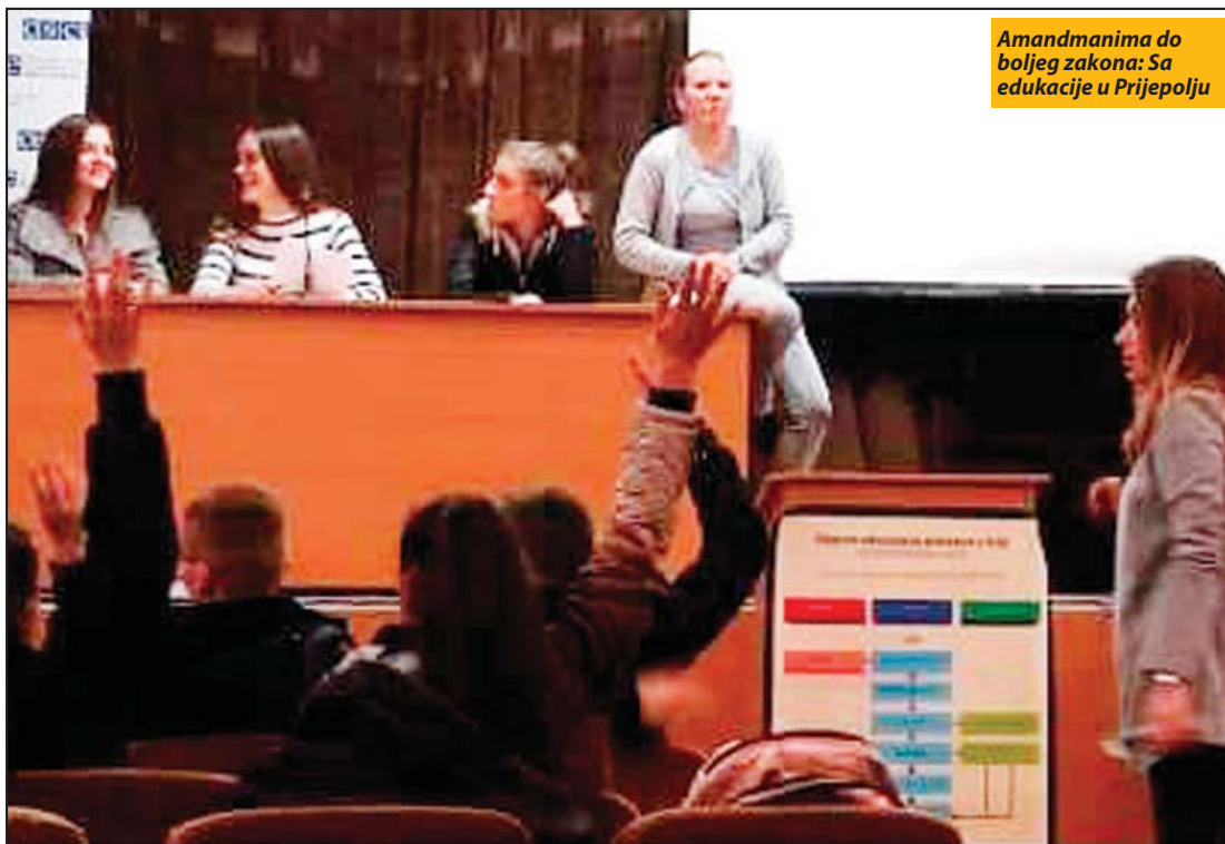
Amandmanima do boljeg zakona: Sa edukacije u Prijepolju

U radionicama o praktičnom funkcionisanju Narodne skupštine učestvovalo 50 učenika iz Nove Varoši i Prijepolja