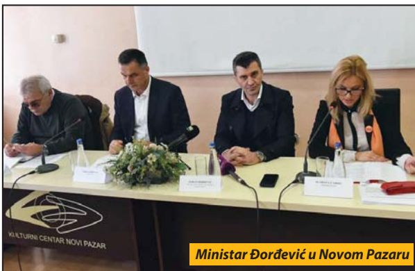
Ministar Đorđević u Novom Pazaru

Novi Pazar – U narednoj godini Novi Pazar će biti deo spektra izuzetno kvalitetnih projekata koji za građane donose konkretno dobro. Da budem konkretan, bavićemo se i smanjenjem nezaposlenosti u ovom gradu i moramo da radimo na tome da buduća ekonomska strategija Srbije obuhvati i Novi Pazar – rekao je ministar za rad, zapošljavanje, boračka i socijalna pitanja Zoran Đorđević, na javnoj raspravi o Strategiji za sprečavanje i zaštitu dece od nasilja za period 2020.-2023. godine.