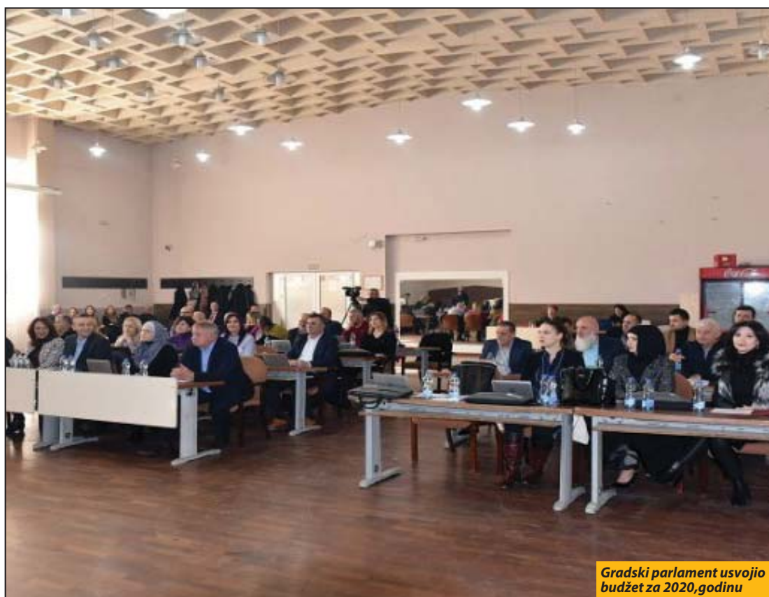
Gradski parlament usvojio budžet za 2020.godinu