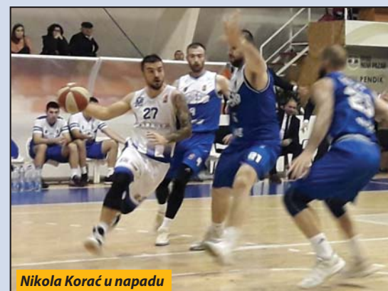
Nikola Korać u napadu