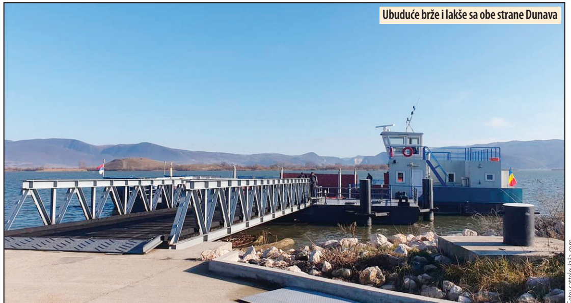
Ubuduće brže i lakše sa obe strane Dunava