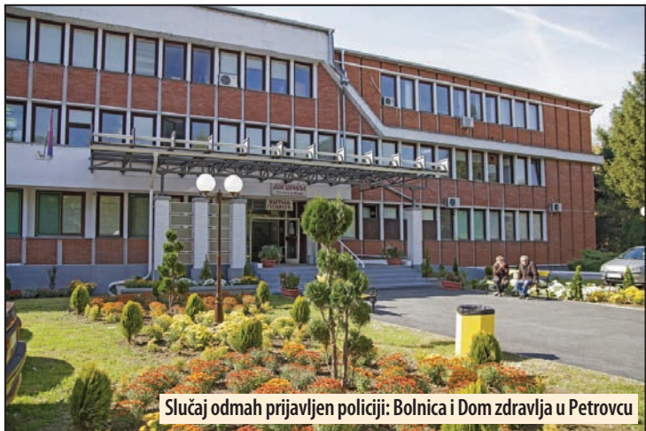
Slučaj odmah prijavljen policiji: Bolnica i Dom zdravlja u Petrovcu