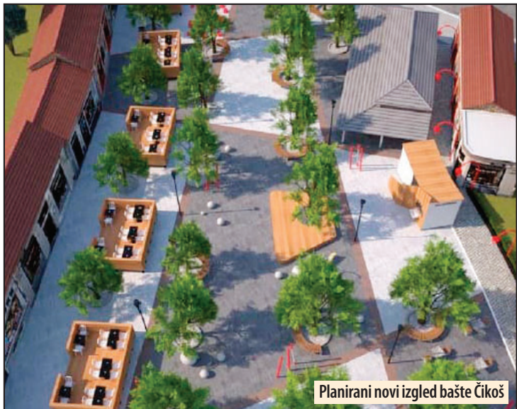
Planirani novi izgled bašte Čikoš