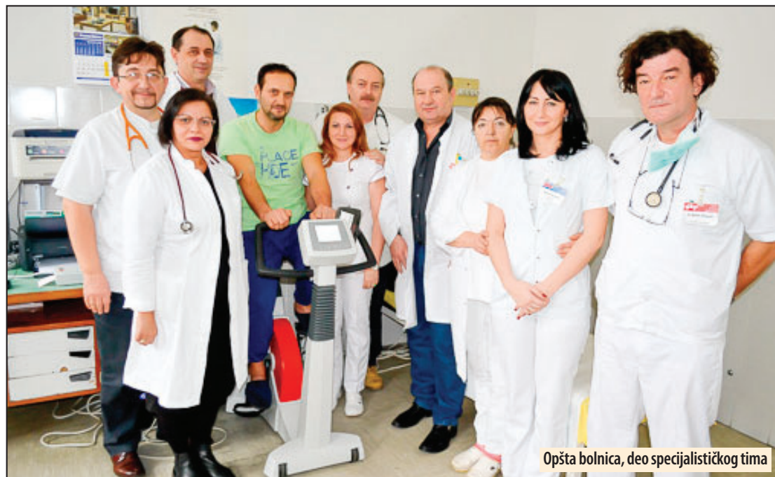
Opšta bolnica, deo specijalističkog tima

nara i popravkom gastroskopa koja je koštala 648.082,94 dinara, a takođe omogućena od strane ministarstva, dobili smo priliku da izvodimo i laparaskopske operacije tumora debelog creva, želuca, kao i komplikovanije laparaskopske zahvate.