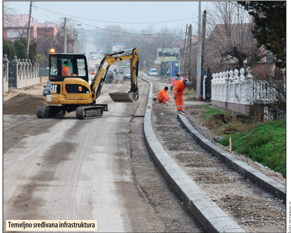
Temeljno sređivana infrastruktura

Mnogo je uloženo i u kulturu. Osnovan je novi festival Vi-