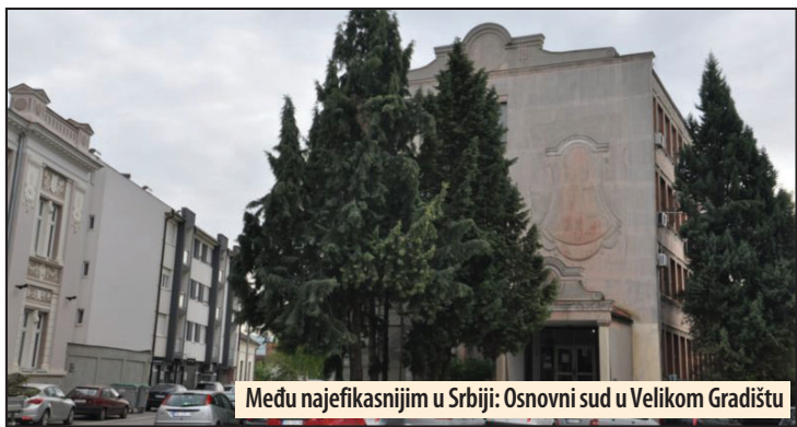
Među najefikasnijim u Srbiji: Osnovni sud u Velikom Gradištu

Veliko Gradište - Vladimir Bradičin (61) iz Brnjice kod Golupca, osuđen je pravosnažno pred Osnovnim sudom u Velikom Gradištu na jedinstvenu kaznu od 10 meseci kućnog zatvora uz elektronsko praćenje, zbog tri krivična dela. To su: nasilje u porodici, neozvoljeno držanje oružja i neovlašćeni promet akcizne robe. Ova presuda doneta je na predlog osnovnog javnog tužioca, prema sporazumu o priznanju krivice sklopljenim sa optuženim. Osim na kućni zatvor, on je osuđen i na novčanu kaznu od 50.000 dinara, a platilo je i 16.000 na ime troškova postupka.