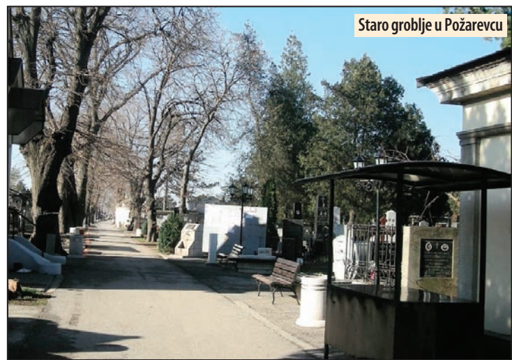
Staro groblje u Požarevcu

Ovi podaci dostavljaju se opštinskom Odeljenju za urbanizam, planiranje i razvoj, radi unosa u Lokalni registar izvora zagađivanja. Podatke za period od 1. januara do 31. decembra 2019. godine, potrebno je dostaviti najkasnije do 31. marta ove godine. Pravna lica koja nisu u obavezi da dostave podatke o izvorima zagađivanja, potrebno je da Odeljenju za urbanizam o tome dostave potpisano i overenu izjavu. M. V.