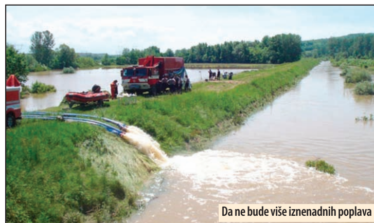
Da ne bude više iznenadnih poplava

Procenom rizika od katastrofa identifikovane se vrste, karakter i poreklo pojedinih rizika, stepen ugroženosti, uzročnici, posledice koje mogu nastupiti po ljude i životnu sredinu, materijalna i kulturna dobra i obavljanje javnih i privrednih delatnosti. U procesu izrade procene izvršilac je u obavezi da uključi sve subjekte - štab za vanredne situacije, organe lokalne samouprave, stručne službe, privred-