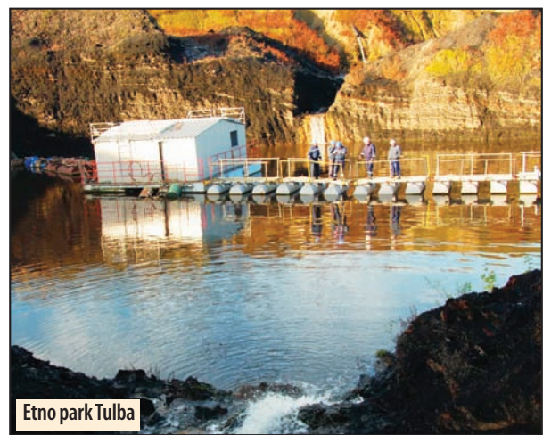
Etno park Tulba