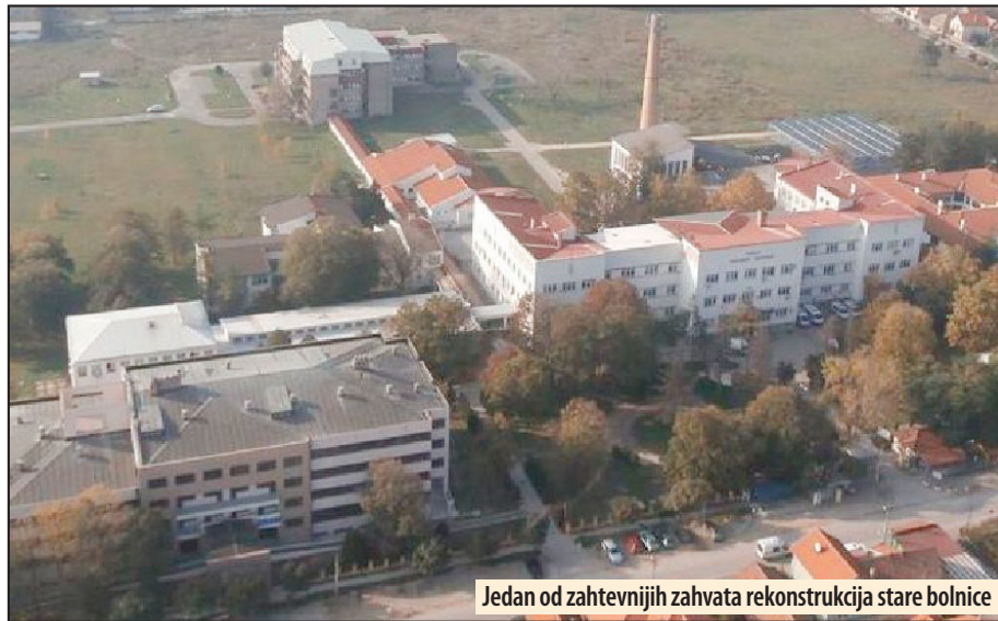
Jedan od zahtevnijih zahvata rekonstrukcija stare bolnice

projekat ventilacije, projekat klimatizacije, protiv požarni projekat, dojavljivači, projekat video nadzora, detektor rasvete u hodnicima) i svu ostalu dokumentaciju. Procenjena vrednost ove javne nabavke iznosi 45.8 miliona dinara bez PDV.