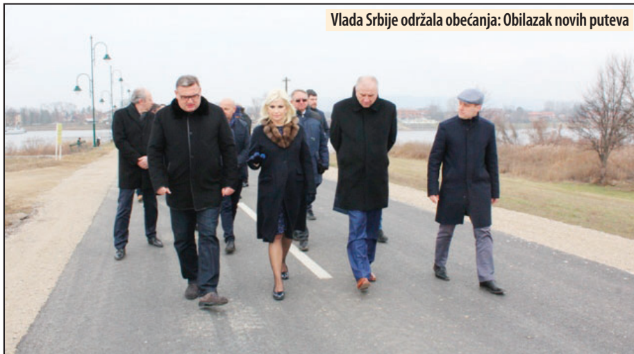
Vlada Srbije održala obećanja: Obilazak novih puteva

Zatonje - Na teritoriji Opštine Veliko Gradište otvorene su dve saobraćajnice od velikog značaja za Istočnu Srbiju - regionalni put Ram - Topolovnik i lokalni put Srebrno jezero - Zatonje, ukupne dužine 22 kilometra, u koje je uloženo oko dva miliona evra, zahvaljujući podršci Vlade Srbije najavljenim prethodne godine prilikom poseta najviših funkcionera ovom kraju koji, pored ostalog, ima izuzetno visoke i realne ambicije u oblasti turističke privrede.