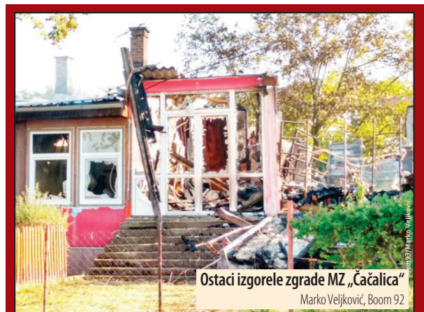
Ostaci izgorele zgrade MZ „Čačalica“

Zbog toga je Grad Požarevac zaključio ugovore sa izvođačima u tri projekta koji se odnose na gazdovanje spomen parkom Čačalica, revitalizaciju parkovske šume na Tulbi i obnavljanje drvoreda u Bosanskoj