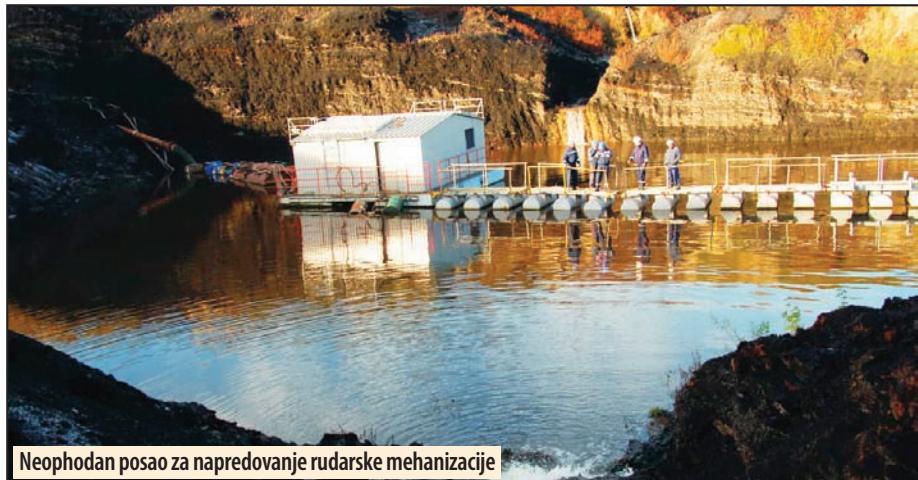
Neophodan posao za napredovanje rudarske mehanizacije

Kostolac - Odvodnjavanje Površinskog kopa „Drmno“ osnovni je preduslov za nesmetani rad i napredovanje osnovne rudarske mehanizacije. Zbog toga je od velike važnosti efikasan rad velikog broja objekata za isušivanje ležišta. Prema podacima Službe odvodnjavanja Površinskog kopa „Drmno“, za prethodnih 10 meseci ispumpano je ukupno 30.000.000 kubika vode. Sistemima za dubinsko odvodnjavanje ispumpano je oko