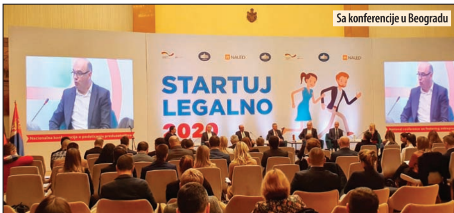
Sa konferencije u Beogradu

- Sa tim ciljem izradili smo Program lokalnog ekonomskog razvoja koji je naša pravna osno-