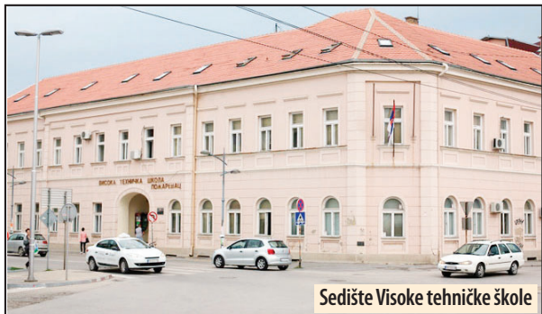
Sedište Visoke tehničke škole