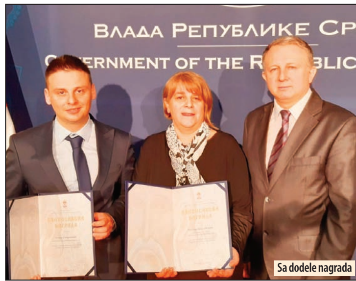
Sa dodele nagrada

„Modernizacija, zaštita i očuvanje Le- gata Miodraga Markovića“ ima veliki značaj za unapređenje kulture u nacio- nalnoj zajednici. Narodni muzej ima nau- čnu i edukativnu ulogu u nacionalnoj i internacionalnoj zajednici, jer veliki broj stručnjaka i drugih interesenata želi da sarađuje i ima uvid u zbirke Narodnog muzeja u Požarevcu. Radi se o dugoroč- nom poslu sa krajnjim ciljem zaštite i dostupnosti kulturnog nasleđa Narod- nog muzeja u Požarevcu. Z. V.