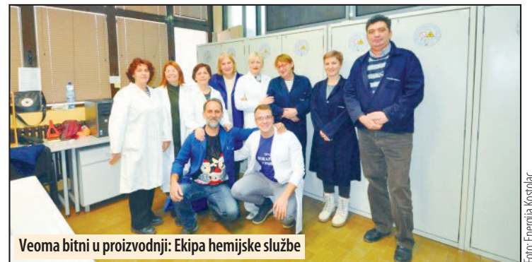
Veoma bitni u proizvodnji: Ekipe hemijske službe