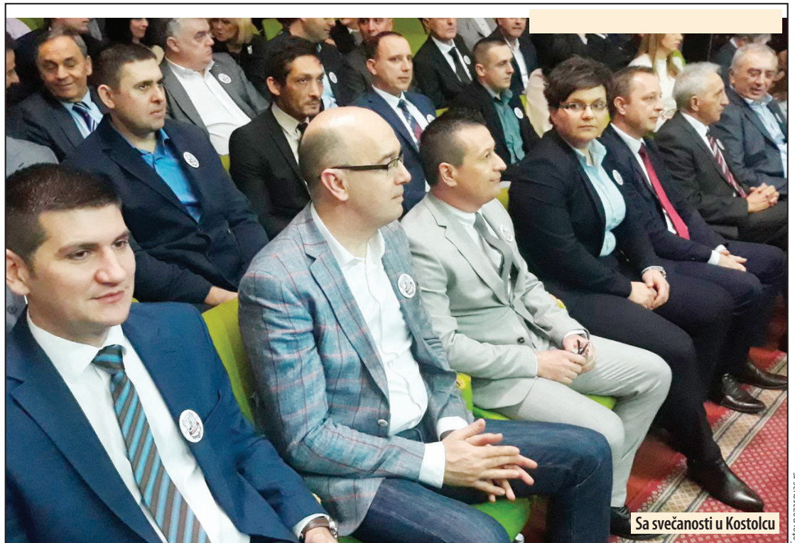
Sa svečanosti u Kostolcu