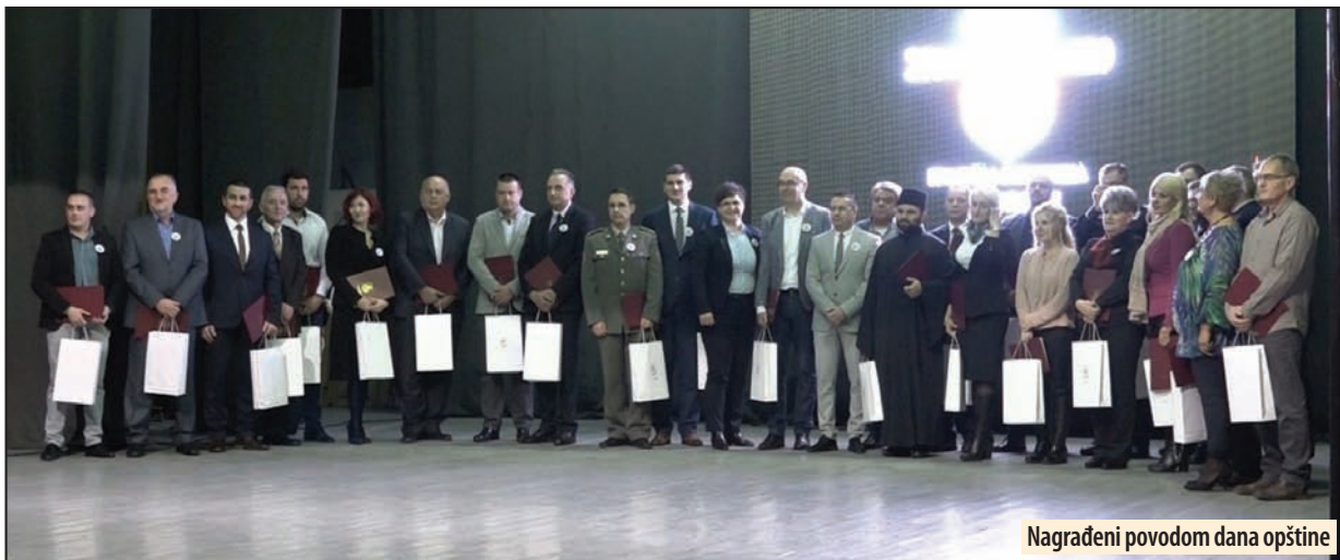
Nagrađeni povodom dana opštine