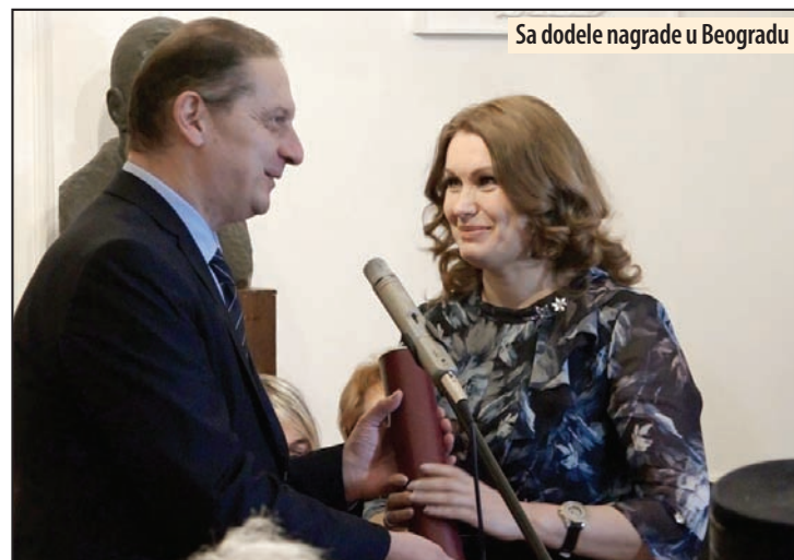
Sa dodele nagrade u Beogradu

Zatim će se predstaviti domaćin, pozorište „Milivoje Živanović“ Centra za kulturu Požarevac, komadom Ne-