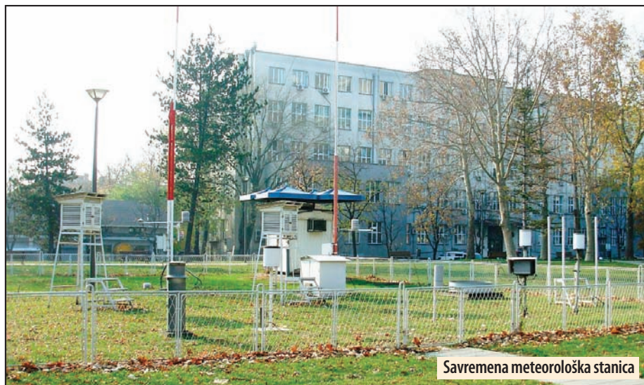
Savremena meteorološka stanica

Naime, Grad Požarevac je okončao javnu nabavku za ugradnju, montiranje i obezbeđivanje savremene automatske meteorološke stanice a