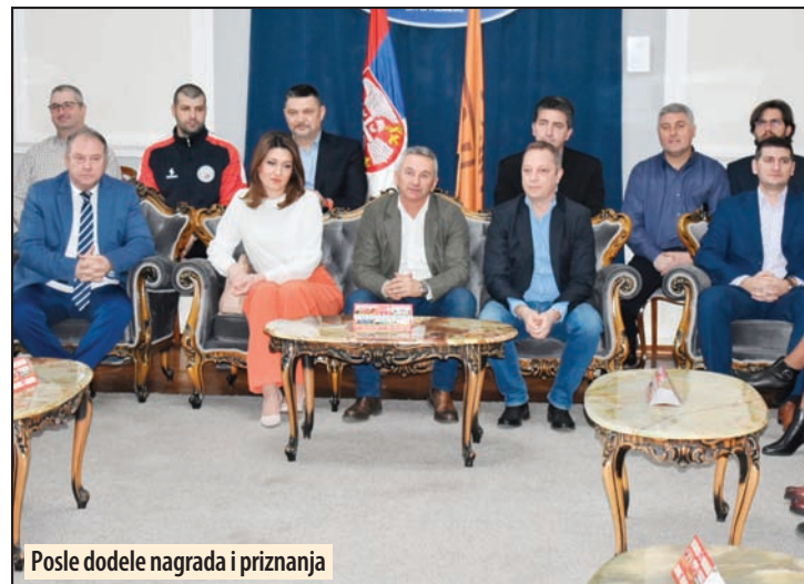
Posle dodele nagrada i priznanja

Najbolja mlada ekipa je juniorska ekipa KMF „Požarevac“, dok su za izuzetne sportske rezultate i uspehe za-