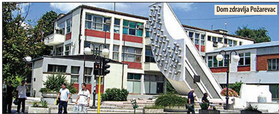
Dom zdravlja Požarevac