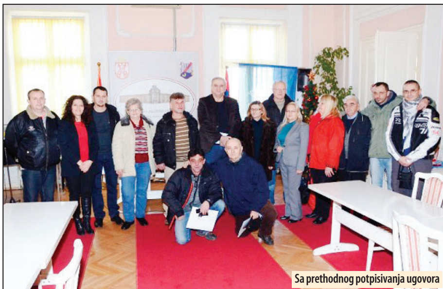
Sa prethodnog potpisivanja ugovora