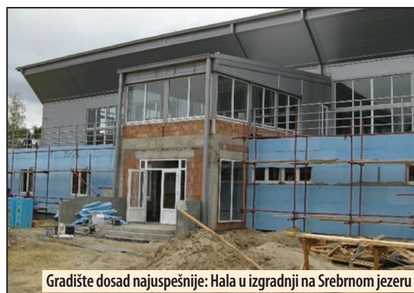
Gradište dosad najuspešnije: Hala u izgradnji na Srebrnom jezeru

U programima za 2018. i 2019. godinu, Gradu Požarevacu je odobren projekat za osiguranje poljoprivrednih proiz-